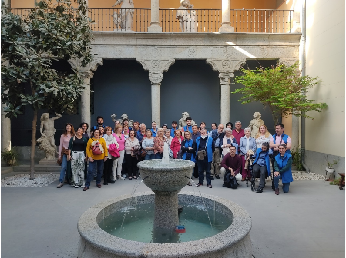
Visita guiada en el MAN, Mayo de 2023.