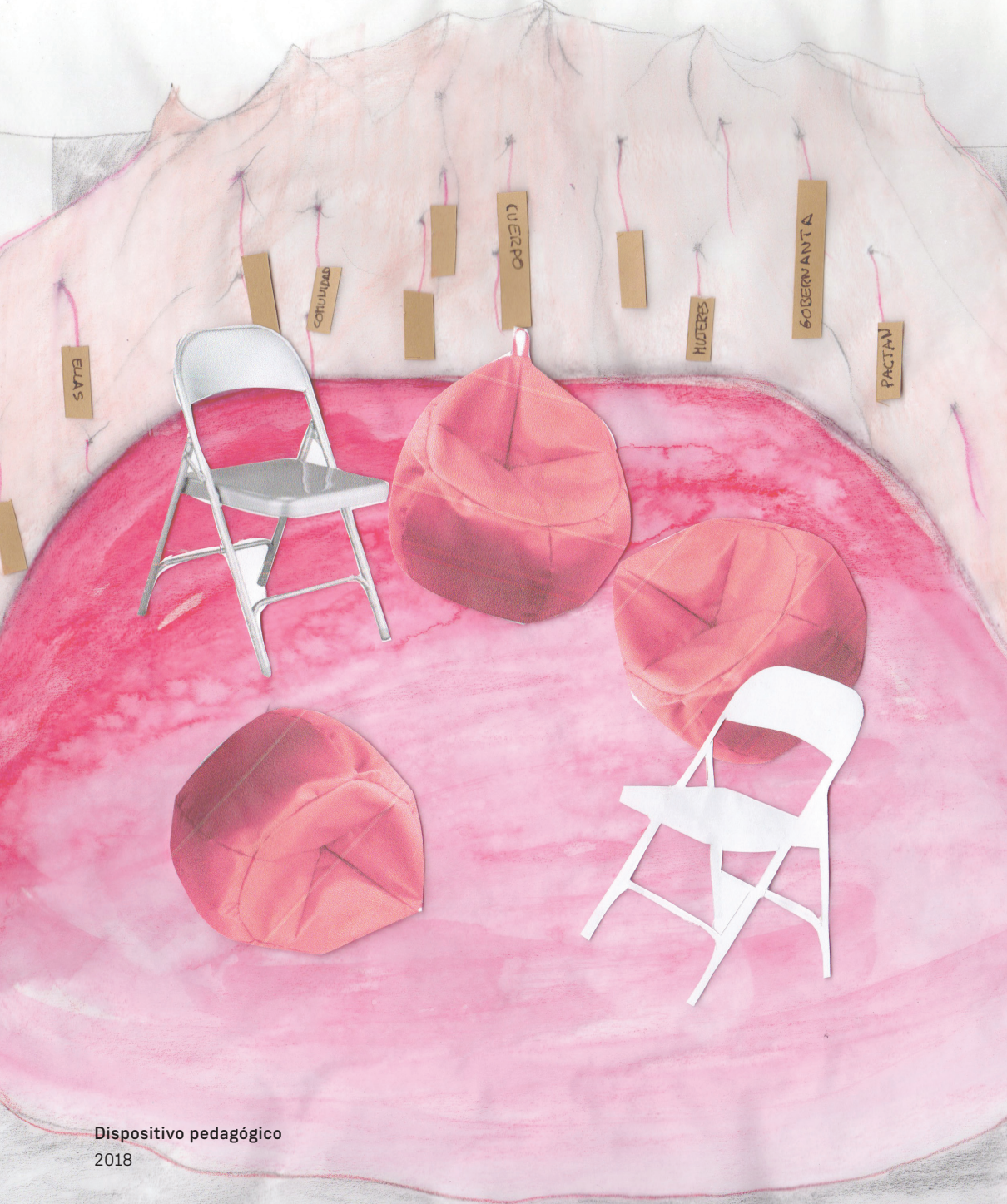
Dispositivo pedagógico 2018

Instalación formada por diferentes elementos: Cortina, luces, sillas cojines, hinchador