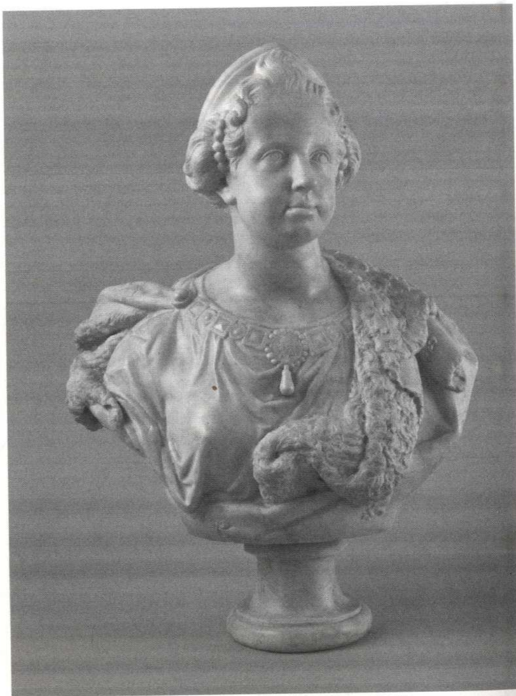
Jean-Jacques Clérion, Buste de Marie-Gabrielle-Louise de Savoie © Versailles, Musée national des châteaux de Versailles et Trianon, MR 2434 (MV 2120). Photo : Christophe Fouin. Jusqu'ici attribué à Jean Garravaque, le buste vient d'être nouvellement attribué à Clérion par Geneviève Bresc-Bautier (Versalia, 2022, à paraître).

Excellence sçavoit trop bien jusqu'à quel point j'avois l'honneur d'estre attachée à la plus grande et la plus adorable Reyne qui fut jamais, pour ne pas juger de l'extreme douleur que j'ay de sa cruelle perte », écrivait la camarera mayor au duc d'Osuna 13 .