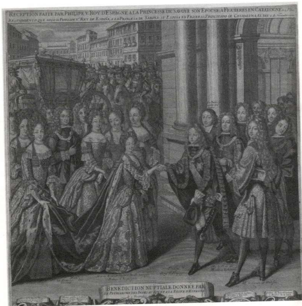
Estampe (détail), « Réception faite par Philippe V. Roy d'Espagne a la princesse de Savoye son épouse, a Figueras en Catalogne le 2. 9. brei 1701 », Paris, Chez N. Langlois, 1702. [La princesse des Ursins porte la traîne de Marie-Gabrielle-Louise de Savoie.]

social est un facteur qui peut avoir une influence sur l'avenir de tout personnage historique, et Madame des Ursins ne fait pas exception. Dans les pages qui suivent, nous aurons l'occasion d'apprécier comment la princesse des Ursins aurait été capable de gouverner « toute la monarchie d'Espagne », pour paraphraser encore une fois Saint-Simon 6 , ce qui ne peut se comprendre sans prendre en considération la logique du fonctionnement des cours de l'Ancien Régime, milieu dans lequel la Maison de la reine, où Madame des Ursins occupa une de ses fonctions principales, pouvait représenter un lieu stratégique pour accéder à la faveur princière, exercer un certain pouvoir et influencer la prise des décisions 7 .