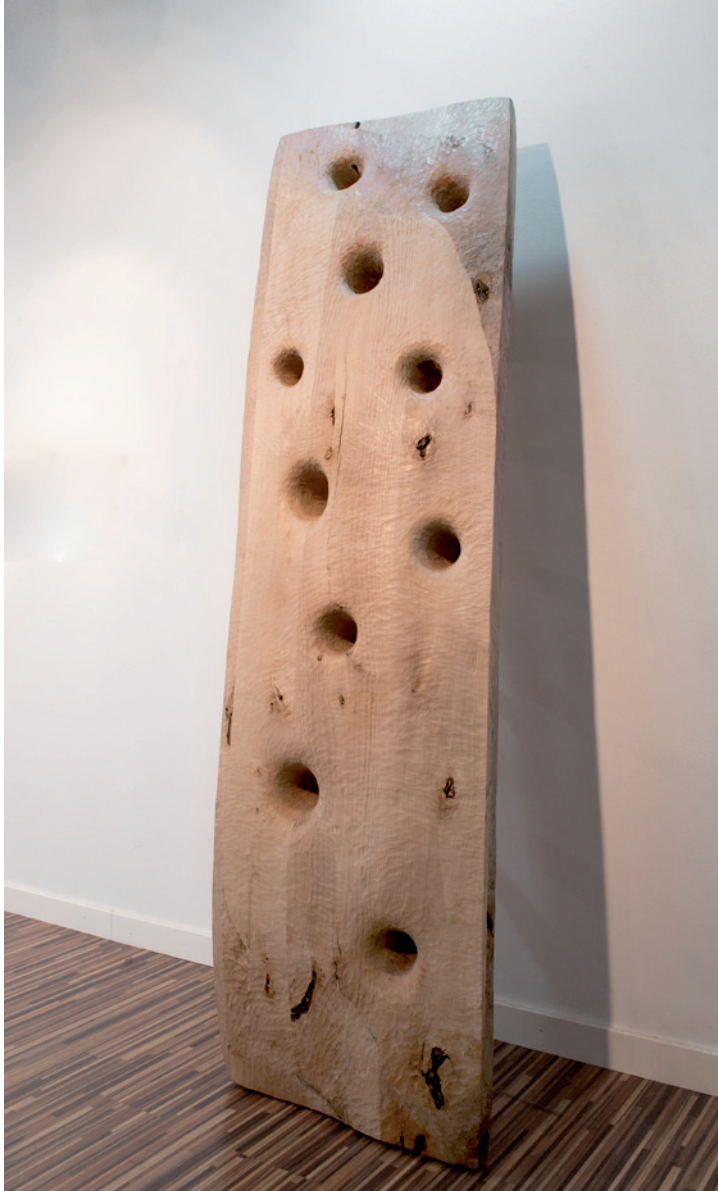
Tabla (Algunos intentos) (1999) 205 × 61 × 40 cm- Madera de abedul.