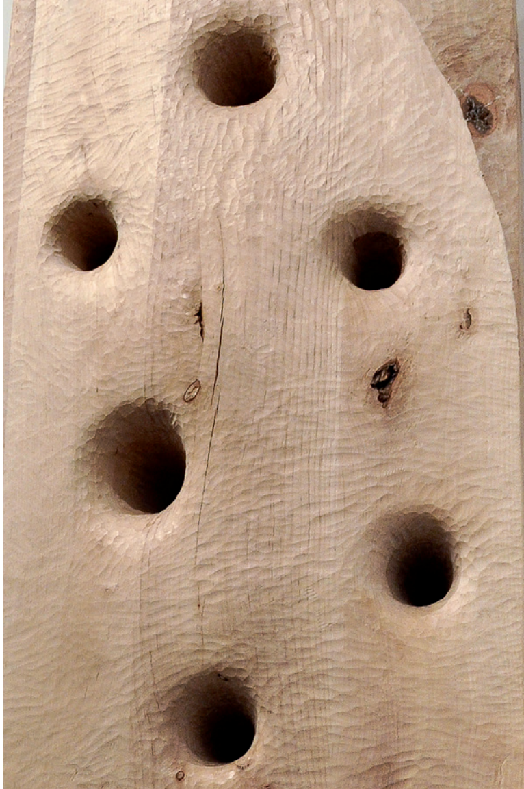
Tabla (Algunos intentos) ( 1999) 205 × 61 × 40 cm- Madera de abedul.