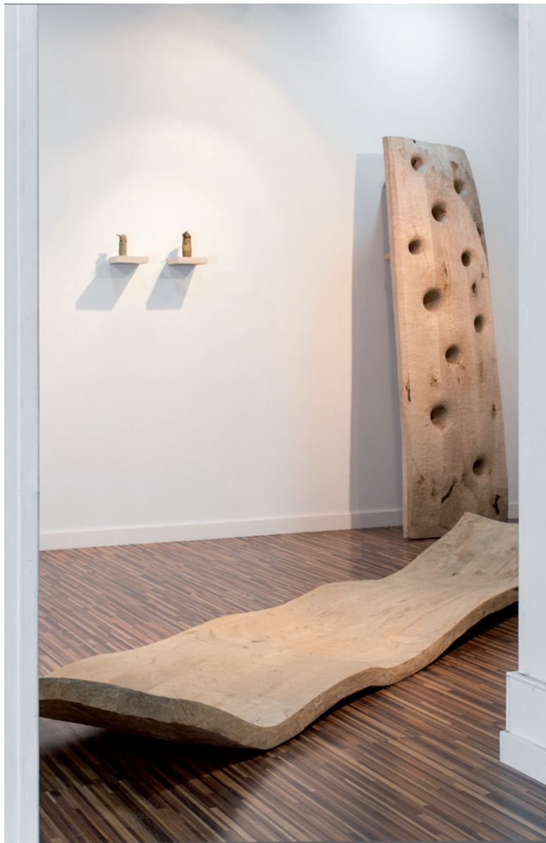
Tabla (Tallando) (1998) 315 × 67 × 40 cm. Madera de abedul.