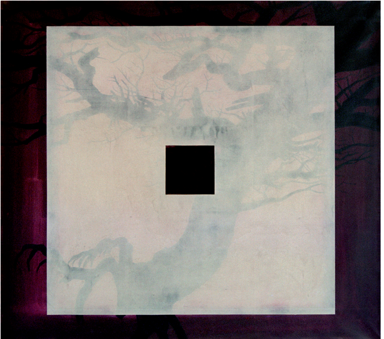
Jardín de Leonardo 1 (1993) 38 × 31,5 cm. Resina acrílica y cargas.