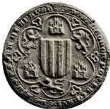
Fig. 2. Sello de Leonor de Castilla. Fernando de Sagarra y Síscar, Sigillografía catalana: inventari, descripció i estudi dels segells de Catalunya (Barcelona: Henrich i ca., 1915), núm. 157.

La relación de Pedro IV y su madrastra estaba lejos de ser idílica. Existían muchas tensiones por el poder territorial de doña Leonor y sus hijos y la presión que podrían ejercer sobre el nuevo rey de Aragón. De hecho, doña Leonor y sus hijos tuvieron que instalarse a Castilla. La revocación de los cambios de jurisdicción de Pedro IV formó parte de una política constante que consistía en enfrentar y minar la autoridad señorial de su madrastra. Aun así, doña Leonor siguió ejerciendo como señora de Tárrega, como prueba la absolució de la reina al concejo de todas las penas civiles y criminales el 16 de junio de 1343 10 y que fue confirmada por Pedro IV el 19 de agosto del mismo año 11 . Finalmente, el 5 de enero de 1357 se ordenó que Tárrega volviese a la Corona en detrimento de doña Leonor, aprovechando que acaba de iniciarse una guerra con su sobrino, Pedro I de Castilla 12 . La reina y su hijo menor, Juan, fueron muertos por orden de Pedro I en 1359 y 1358 respectivamente, mientras el mayor, Fernando, marqués de Tortosa, fue muerto por orden de Pedro IV en 1363 13 .