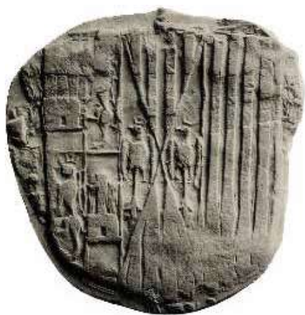
Fig. 4. Sello de don Fernando como rey de Sicilia y príncipe de Castilla y Aragón. Sagarra y Síscar, Sigillografía catalana... , núm. 238.

Con respecto a su dote, doña Isabel no solo recibió los señoríos que solían corresponder a las reinas de Aragón, sino que también se le concedió todos aquellos que hubiesen pertenecido a sus predecesoras, María de Castilla y Juana Enríquez, incluyendo Tárrega. Sin embargo, la reina Juana no recibió esta villa como parte de su dote, y tampoco lo haría su nuera.