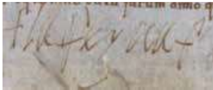
Fig. 12. Firma de Germana de Foix. ACUR, Ayuntamiento de Tárrega, t. 2, 19856.

Católico a petición de Carlos V y conservada en el fondo del Ayuntamiento de Tárrega del Archivo Comarcal de Urgell 60 .