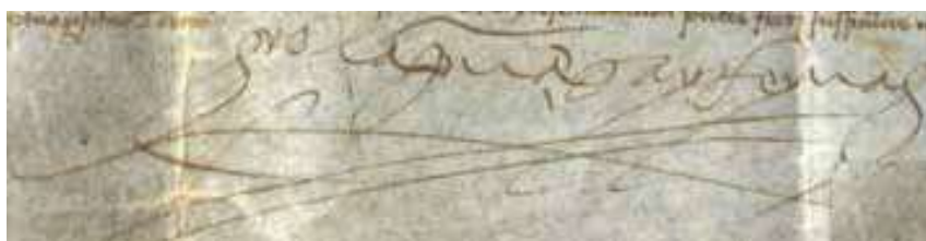
Fig. 8. Firma de doña Isabel como “la princesa y reina”. ACUR, Ayuntamiento de Tárrega, pergaminos, t. 2, 19826.

del tratamiento de reina de Sicilia a pesar de que este tiene un mayor rango. También don Fernando colocaba el título de príncipe de Castilla y León antes de todos aquellos que le pertenecían por derecho propio 46 . Esta diferencia también se hacía en la firma. Siguiendo la costumbre castellana, doña Isabel firmaba utilizando su título. Estas disposiciones las suscribió como «yo, la princesa y reina», anteponiendo la condición de heredera a la de soberana, aunque colocando ambas. Esta firma era exclusiva de los documentos aragoneses de doña Isabel, ya que en los castellanos firmaba solo como «yo, la princesa» 47 .