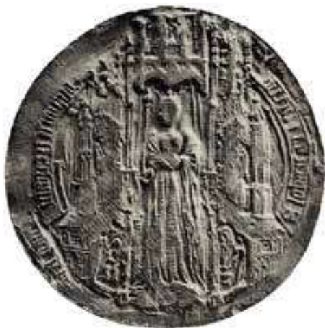
Fig. 3. Sello de Juana Enríquez. Sagarra y Síscar, Sigillografía catalana... , núm. 173.

gundo hijo varón el infante Martín, que recibió homenaje el 12 de abril de 1383 20 , y a quien su padre quería dotar de un importante patrimonio como segundogénito. Cabe recordar que además de darle ciertos señoríos su padre le hizo conde de Besalú y conde de Xérica, y posteriormente su hermano le creó duque de Montblanc. Es de suponer que Tárrega se reintegró a la Corona cuando éste se convirtió en el rey Martín I en 1396, aunque también pudo quedar como patrimonio privado del monarca. En caso de que el rey Martín mantuviese Tárrega como un bien privativo, la anexión al patrimonio real se habría producido a la muerte de este sin herederos. De este modo, Tárrega estuvo anexa a la Corona bajo el gobierno de los Trastámara-Aragón respetando finalmente lo que dispuso el rey Pedro IV, y que el propio monarca nunca cumplió.