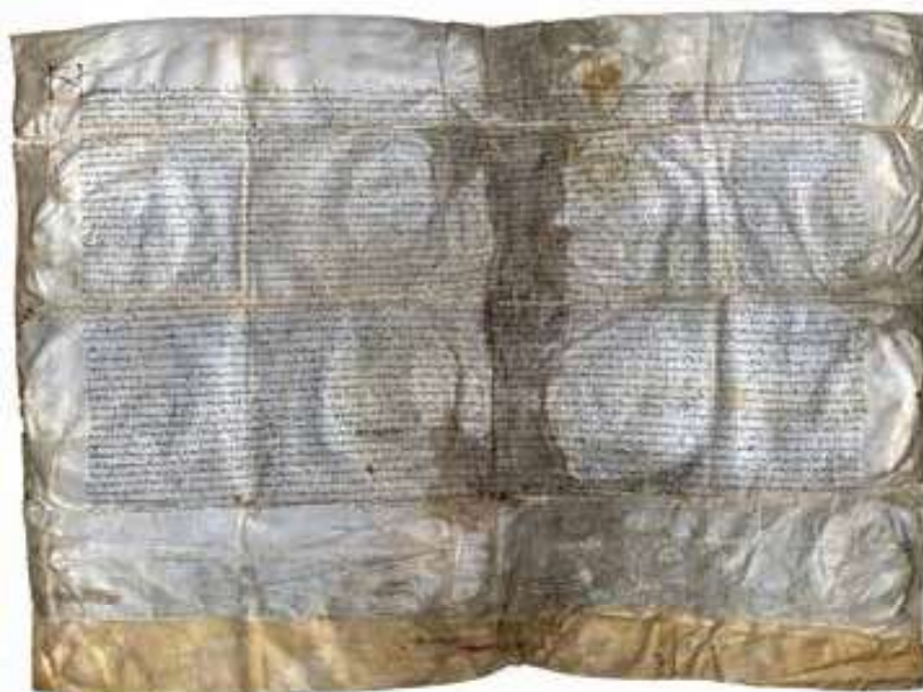
Fig. 5. Confirmación de Juan II del privilegio de Pedro IV. Sello de Juan II. ACUR, Ayuntamiento de Tárrega, pergaminos, t. 2, 19822.

Esta intitulación especifica que el título de rey de Sicilia es en gobernanza compartida con el rey Juan. A pesar de la importancia de este título, que otorgaría su primer título regio a don Fernando y doña Isabel, se vería relegado por los intereses políticos de la futura Reina Católica.