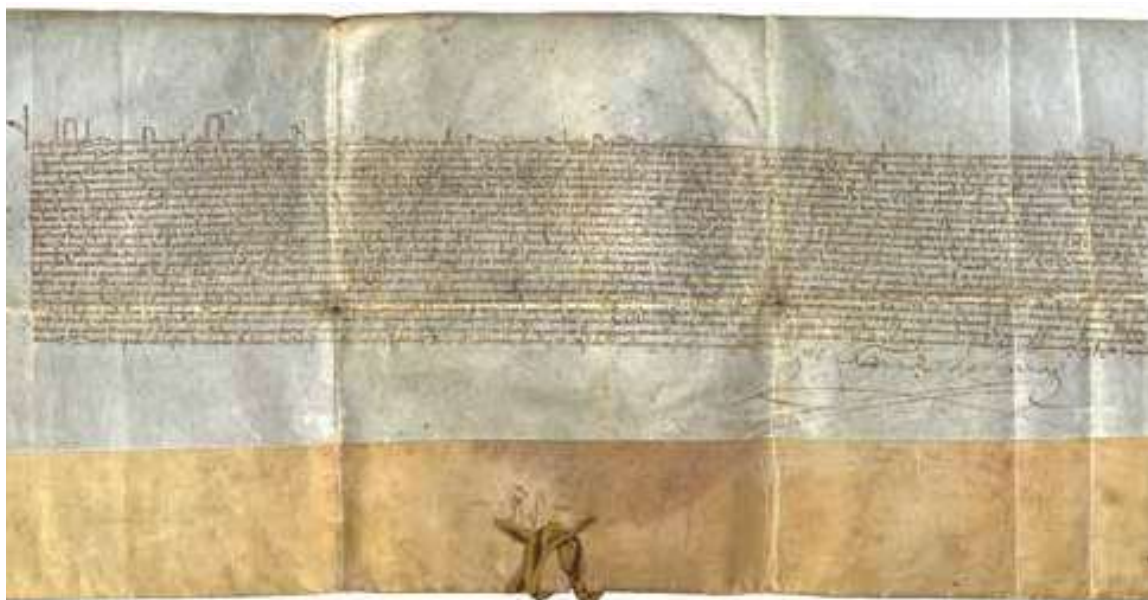
Fig. 7. Disposiciones de la princesa Isabel. ACUR, Ayuntamiento de Tárrega, pergaminos, t. 2, 19826.

princesa, incluyendo el ducado de Montbanch y Balaguer, títulos aragoneses que pertenecían al patrimonio privado de su marido y que le fueron entregados cuando aún era segundogénito 44 . No parece que fuera lo usual. El 16 de enero de 1471 la princesa pidió a Requesens de Roler, vicegobernador general de Cataluña, información sobre los privilegios de Tárrega para nombrar procurador a Lope de Toyuela. En la misiva se intituló como «Doña Isabel, por la gracia de Dios, princesa de Asturias e legitima heredera e sucesora de los reinos de Castilla e de León, reina de Sicilia, princesa de Aragón» 45 . En este segundo caso redujo los títulos a aragoneses a aquellos propios de sus reinos, sin incluir los privados, para desarrollar más sus títulos castellanos incidiendo en su legitimidad.