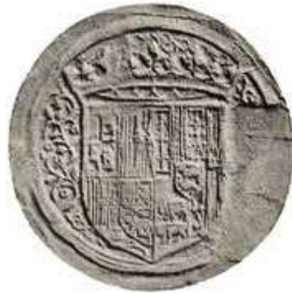
Fig. 11. Sello de Germana de Foix. Sagarra y Síscar, Sigillografía catalana... , núm. 176.

Como parte de su política imperial, Carlos V dispuso el matrimonio de doña Germana con Juan, hermano del margrave del Brandeburgo-Ansbach, celebrado el 17 de junio de 1519. En 1523 los cónyuges fueron nombrados virreyes de Valencia. En 1525 Juan de Brandeburgo falleció y un año después doña Germana se casó en terceras nupcias con Fernando de Aragón, duque de Calabria, con quien compartió el virreinato hasta el fallecimiento de la reina de 1536 59 .