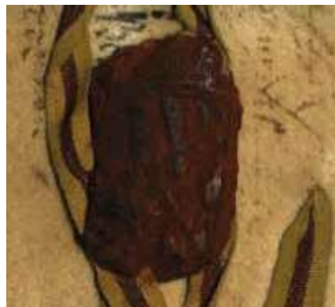
Fig. 10. Sello de doña Isabel con las armas de Aragón-Sicilia. ACUR, Ayuntamiento de Tárrega, pergaminos , t. 2, 19826.

Otro detalle por destacar de las disposiciones es el sello que pende del documento. Hasta el momento el único sello de Isabel la Católica del ámbito aragonés que se ha analizado es uno mayestático como reina de Sicilia 49 . El sello se encuentra fragmentado, y solo se distingue que en el campo tenía las armas de Aragón-Sicilia. Según la cláusula de hechura, el sello solo puede ser de doña Isabel: «In cuius rey testimonium presens fieri jus-