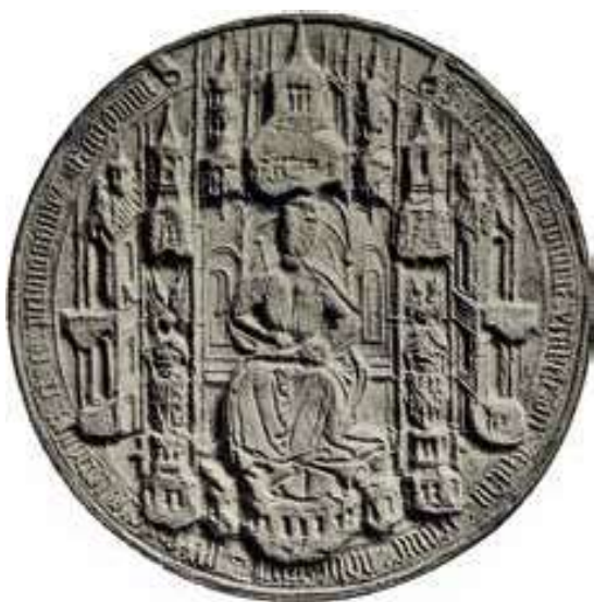
Fig. 9. Sello de doña Isabel como reina de Sicilia. Sagarra y Síscar, Sigillografía catalana... , núm. 175.

e hija muestra como el enfrentamiento dinástico hizo que la futura Reina Católica antepusiera su causa a un mayor estatus. La reina de Portugal no se vio en esa situación, y por tanto podía seguir un orden más lógico manteniendo el título regio como el principal.