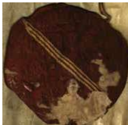
Fig. 6. Sello de Juan II. ACUR, Ayuntamiento de Tárrega, pergaminos, t. 2, 1982.

Cuando Pedro IV revocó el derecho de su madrastra sobre Tárrega le dio un estatus jurídico especial, una especie de régimen de realengo inalienable. Esto obligó a Juan II a conceder Tárrega, junto a Tarraza y Sabadell para la Cámara de la princesa Isabel por separado de la dote. El concejo esgrimió su adscripción a la Corona para negase a prestar homenaje a la princesa 36 , lo que retrasó su toma de posesión de la villa. En consecuencia, Juan II no emitió el privilegio de concesión hasta el 8 de mayo de 1470, meses después de la boda, y el príncipe Fernando lo confirmó el día 18 del mismo mes 37 .