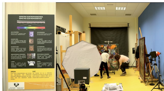
Figura 7. Alumnado fotografiando una obra en el aula de estudio de examen y documentación de la facultad de Bellas Artes

En la actualidad, múltiples proyectos avalan también la necesidad de digitalizar el patrimonio como parte de su adecuada preservación y trasmisión. Además de la creación de códigos QR, el uso de la realidad aumentada o sitios web como Google Arts & Culture, Googleplaces o Googlemuseums 12 , otros grupos de investigación como el de La Universidad Internacional de la Rioja-UNIR 13 analizan, además, el impacto de estas nuevas tecnologías en el ámbito de la educación.