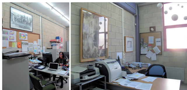
Figura 4. Despachos de la Facultad de Bellas Artes donde se ubican algunas de las obras estudiadas por el alumnado durante el proyecto

Además, este trabajo previo favorece el que sean