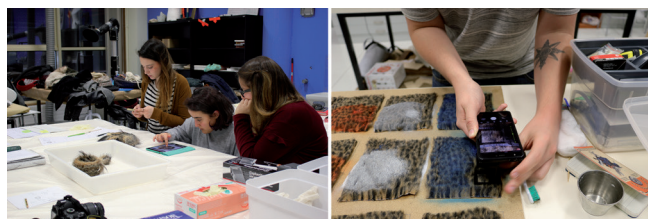
Figura 6. Alumnado realizando un Condition Report empleando un Ipad y un Smartphone para registrar el estado de conservación de una obra. En la derecha, un alumno utilizando un móvil para fotografiar, a través de un cuentahilos, los cambios tras aplicar un tratamiento sobre probetas.

A pesar de ello, no renunciamos a la utilización paralela de ambos recursos ya que todavía creemos,