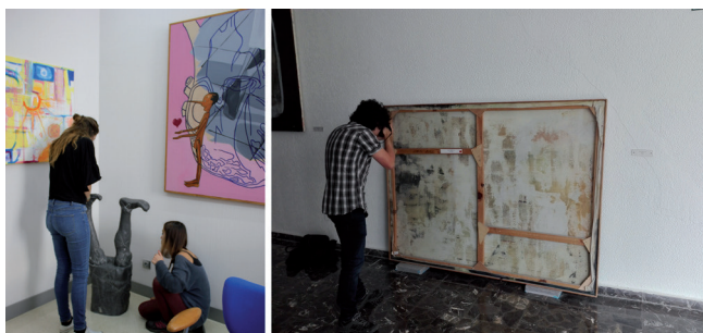
Figura 3. Alumnado inspeccionando y documentando diferentes obras ubicadas en diferentes espacios del campus.

Al igual que se describe, de nuevo en el modelo IKD, también desde el grado “aspiramos a que nuestros estudiantes interactúen fluidamente con sus profesores y profesoras, con sus iguales y con el entorno; se comprometan en la resolución de los problemas y retos a los que se enfrenta la sociedad y la cultura vasca con criterios de sostenibilidad y responsabilidad social; conviertan el aprendizaje en una actividad vital y permanente; utilicen las herramientas TIC y sean capaces de desarrollar su actividad de forma plurilingüe” 8 .