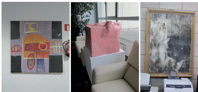
Figura 2. Obras pertenecientes a la colección de patrimonio de la UPV/EHU repartidas en los espacios comunes y lugares de trabajo del personal de la universidad. De izquierda a derecha: Obra de David Tapuerca, Maquina Parlante I . 1996. Mixta sobre tela. Sin Título de Elena Mendizábal y obra gráfica de Marta Iraurgi Mendoza, Autorretrato , 1992/1993. Papel hecho a mano emulsionado.

Artístico de la UPV/EHU de la Facultad de Bellas Artes (curso 2001/2002), “hace tiempo que la actividad artística del País Vasco no puede entenderse sin ese vivero en el que se ha convertido nuestra facultad”. Estas iniciativas han sido la principal causa por la que la Universidad del País Vasco ha ido dotándose de una gran cantidad y variedad de piezas artísticas contemporáneas de gran interés [figura 2].