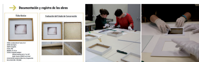
Figura 5. Ficha de una de las obras estudiadas y planteamiento de conservación propuesto en una de las clases del grado partiendo de la problemática observada en la obra real.

capaces de realizar propuestas de conservación e intervención basándose en la problemática observada durante dicha fase de estudio con mayor implicación y conocimiento de las obras.