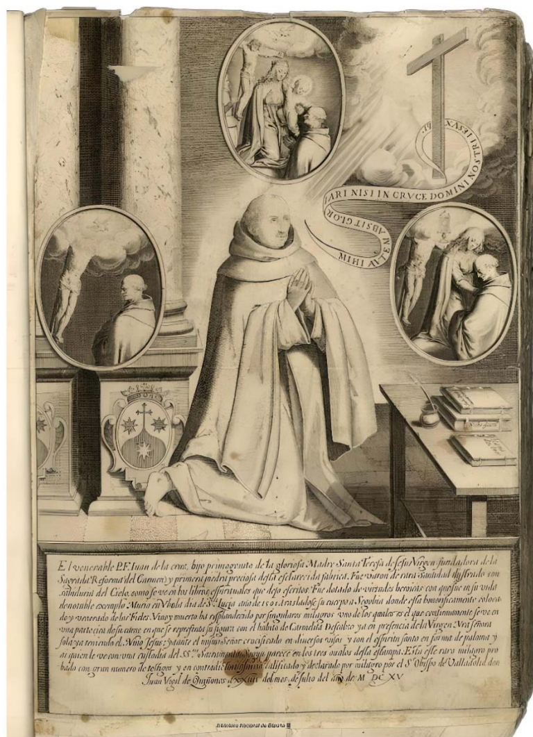
Fig. 8. [San Juan de la Cruz y sus visiones]. En: Informaciones sobre la vida y milagros de San Juan de la Cruz para su beatificación (S.XVII [1601]), Madrid, Biblioteca Nacional, Mss-012738-001, p. [7].