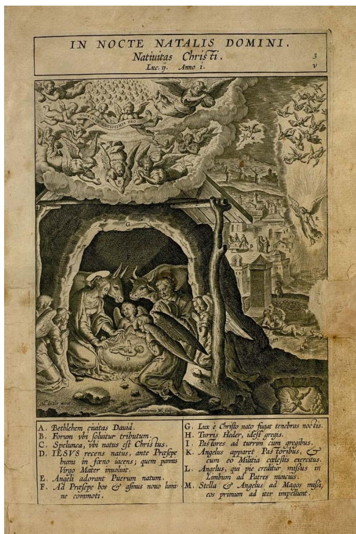
Fig. 6. In Nocte Natalis Domini . En: Nadal, J. Evangelicae imagines ex ordine evangeliorum Madrid (Lám. 3). Biblioteca Histórica Marqués de Valdecilla [BH FLL 5997].

representada y su fuente en los Evangelios. A esto se añade el comentario en castellano: «Pintola nra me Cecilia del nacimiento - carlta Descalza en el conuto de Valladolid». La parte central del grabado es la escena bíblica indicada, mientras que el último bloque corresponde a la leyenda, donde se señalan los numerosos personajes que participan de la escena mediante una letra del abecedario.