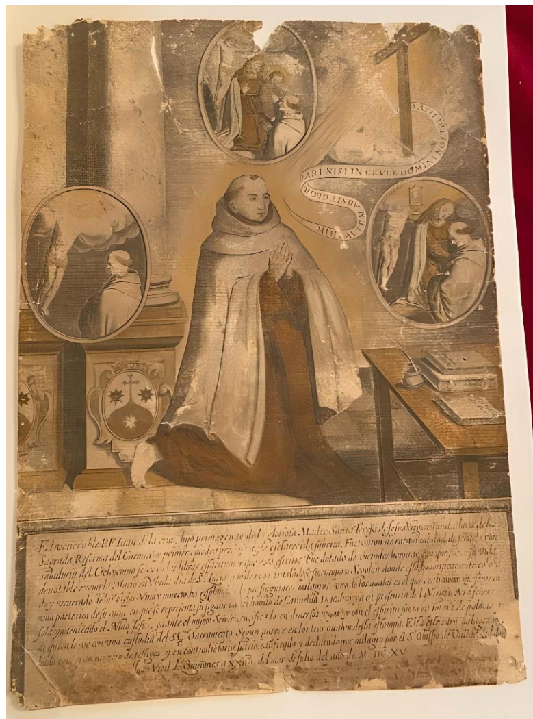
Fig. 7. AMCCV, [San Juan de la Cruz y sus visiones], K-43.