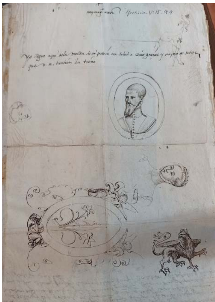
Fig. 1. AMCCV, Cartas de la familia Sobrino, K-1.