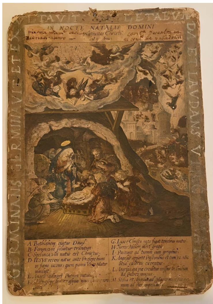
Fig. 5. AMCCV. In Nocte Natalis Domini , K-42.

La estampa K-42 se ha identificado con la lámina 3 (Fig. 6) del Evangelicae imagines ex ordine evangeliorum o Historia Evangélica del jesuita Gerónimo Nadal, impreso en Amberes en 1593. En la estampa del libro de Nadal aparecen las firmas del grabador belga Hieronymus Wierix y del dibujante italiano Bernardino Passeri 3 . Las estampas de esta Historia Evangélica son de extraordinaria calidad, ya que "los grabados realizados por los hermanos Wierix y Martin de Vos constituyen un auténtico monumento del grabado flamenco y la obra cumbre por su finura y delicadeza" (Fernández Gracia, 2004: 69).