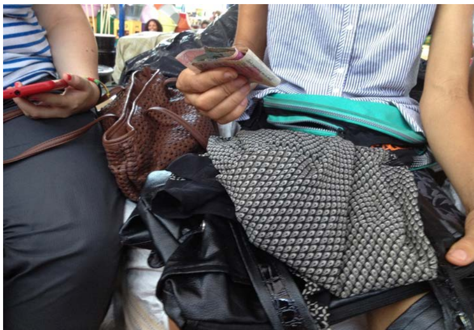
Vitalina cobra el dinero de la amiga que le ayuda a diversificar la venta, habiendo ganado su parte en la reventa. Sucupira, isla de Santiago, 2012.

Nu ta compra bidon di Merca, 55.000.00 escudos, ten ki cumpra dos o tres cuatro, o kis bidosn ta chiga di Merca, ten arguén ki ta compra tudo, si mi ka ten min ka ta acha kel nagócio bom, kel ki tene dinheiro es ta guarda; si mi ten kel dinheiro mi ta compra dos o tres bidons. barco ta vai Merca el ta carrega to ki el ben mi ten nagócio, si mi ka ten dinheiro mi ten ki fika paradu ta spera sin nagócio pa fazi. Si mi ten kel dinheiro mi ta invisti na nagócio; mi ta djoga na Totocaixa, lotaría. Pa djoga, nu ta junta colega tudu semana, ta djunta tudo dinheiro pa djuda compañero. Pa nos cumpra nos bidón.”