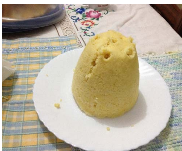
Cuscús de Cabo Verde

En Cabo Verde, el cuscús es un bizcocho tradicional, hecho con harina de maíz y cocido al vapor en un recipiente de arcilla especial ( bindi ), similar a una cuscuzeira . Se sirve acompañado de café con leche o té negro y mantequilla fresca para barrar mientras esté caliente. Merienda en casa de Vitalina.