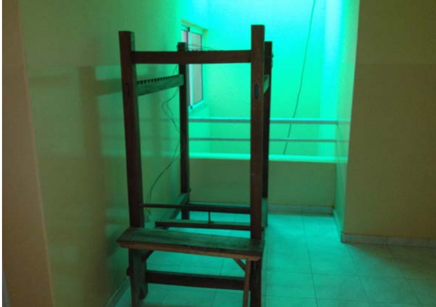
Telar tradicional instalado para trabajos de tejeduría de panu di terra tradicional.

Doña, Nha Tita y el resto de las mujeres de Brianda en particular, representan en el presente etnográfico el imaginario cultural , de un tiempo de las mujeres en Cabo Verde. Es decir son mujeres del pueblo humilde, cuyas vidas en este lugar apartado 15 km de la capital del país. saben que sus vidas reposan en su capacidad de resiliencia al medio agreste y árido donde habitan, con varios déficits de acceso a una vida buena y que sus valores societales , mantienen al grupo doméstico y vecinal extenso, a través de la institución perene del djuda (Évora, 2001), y el djuntamom [ayuda, apoyo mutuo]. Sus valores de dignidad, confianza, respeto y esperanza, cuidados y deuda moral , son inalienables. Y cuando se trata de interpretar lo que significa desarrollo , muestran voluntad de colocarse en la senda de lo que consideran que harán mejor que los hombres de su aldea. Las mujeres de Brianda creen que tienen más oportunidades de aprovechar la coyuntura; los hombres tienen poca participación, “ Es más probable que participemos en el desarrollo ”, remata Nha Tita . Estas mujeres no migrantes saben valorar que es positivo en la migración hasta un límite. Saben igualmente que lo local también tiene su lugar en su vidas como mujeres y madres, jefas de hogar.