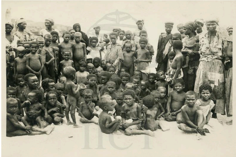
Imágenes de la hambruna del año 1917.

Esta foto muestra la memoria más funesta de la nación caboverdiana, las existencias diezmadas de miles de personas que padecieran hambrunas históricas (Carreira, 1984), y que fueron abandonadas por el poder colonial luso en el archipiélago atlántico. Estas historias particulares cuentan la historia adversa de la construcción de la nación caboverdiana, el fermento de las revueltas esclavas y después campesinas. Estaban en juego la lucha política por el libre acceso a la tierra cultivable, constituía como había ocurrido ya en otros momentos con la Revolta dos Engenhos (1822), y la Revolta de Achada Falcão (1841) en el interior de la isla de Santiago, que el historiador Adilson Pereira ofrece en su libro “ As Revoltas: Engenhos (1822), Achada Falcão (1841), Ribeirão Manuel (1910) ”, de 2015, una movilización política contra las “ escravizantes ” [esclavistas] condiciones de trabajo y pago abusivo de rentas de las tierras y venta del ganado a bajos precios para honrar sus deudas como arrendatarios. Y aquí el fenotipo coincide con las familias de origen africano negro, descendientes directas de la esclavitud traída a estas islas ex novo .