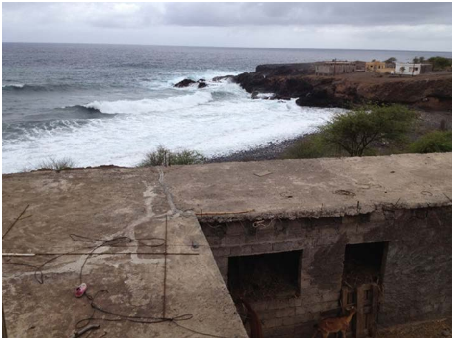
Los corrales de gado porcino y caprino y la playa donde las mujeres apañaban arena del fondo del mar, quedando hoy un lecho pedregoso. Brianda agosto de 2012.

La estructura familiar en el medio rural se corresponde al tipo de familias monomarentales cuya proporción es menor (30,9%) que en el medio urbano (69,1%) en 2018 (INE-CV, 2019) y la tasa de feminidad es más alta (29,2%) frente a los hombres jefes de hogar (4,4%) (Ibidem: Infografía INE-CV, 2019). Son grupos domésticos cuyas jefaturas son en su mayoría femeninas y matrifocales . Familias con ausencia del padre d'fidju (padre biológico) cohabitando en la misma casa, y la figura de la madre es central