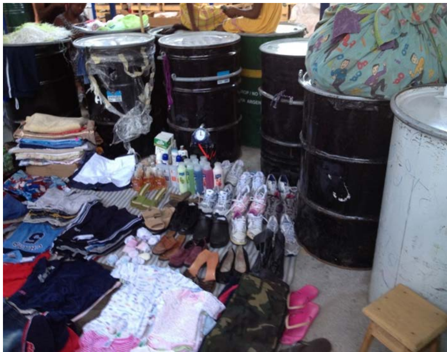
Bidones con artículos de segunda mano para reventa en Sucupira, julio/agosto de 2012. Atlantic Shipping Co Ltd .

Según Sonia Frías (2014), existen varios retos que surgen para comprender la complejidad de los problemas que existen dentro del alcance de las prácticas informales. La antropóloga lusa considera que las dificultades de interpretación surgen no solo para los investigadores, sino también en el contexto de las propias teorías explicativas . Aduce que los temas relacionados con el desarrollo del sector informal plantean desafíos en la