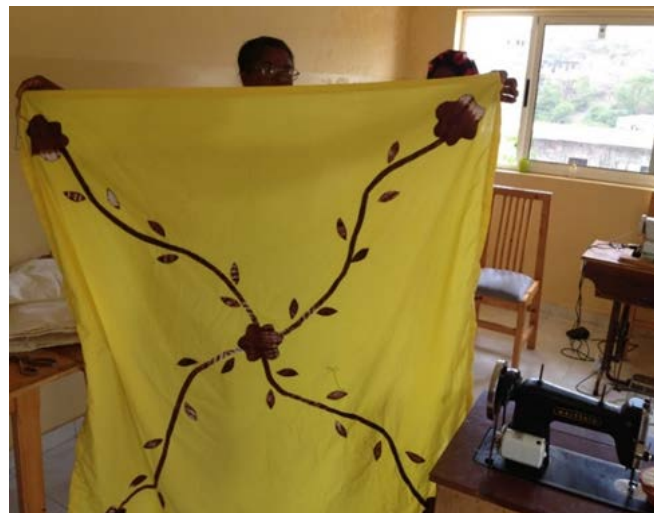
Sala de trabajo de la Cooperativa de Mujeres de Brianda y trabajos de mantelería y accesorios de casa.