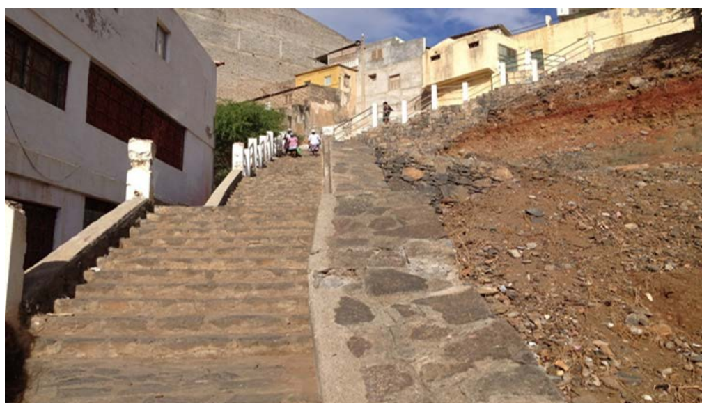
Escalera de bajada de la ciudad alta, Plató al Mercado de Sukupira, Agosto de 2012.