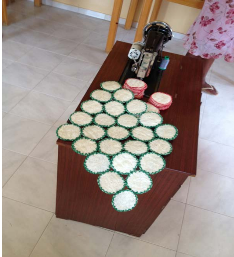
La sala de costura de la Asociación Cooperativa de Mujeres, y trabajo artesanal de centro de mesa en cuerda de sisal. Brianda. 2012.