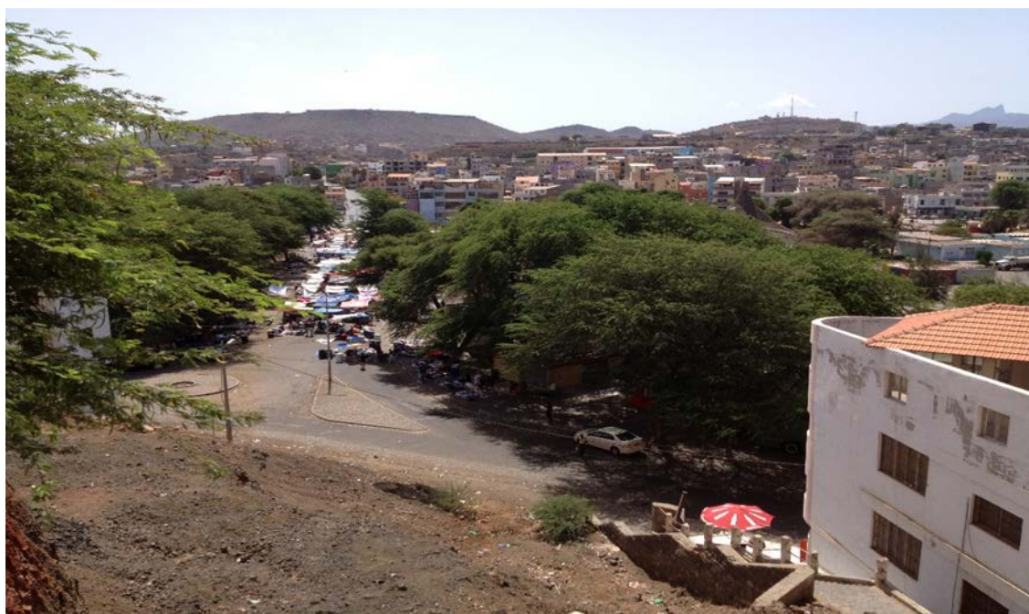
Vistas desde el Plató del Mercado de Sucupira o Sukupira, Praia, Santiago, 2012.