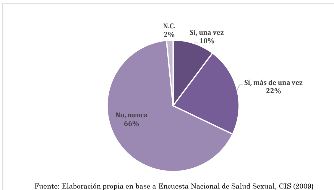
Figura 1: Hombres que han pagado por relaciones sexuales según CIS (2009)

Por otro lado, unos años antes la Encuesta Nacional sobre Salud y Hábitos Sexuales realizada en 2003 (INE, 2003), ofrecía el siguiente resultado: entre los varones encuestados que tenían relaciones sexuales, un 27,3% respondió afirmativamente al