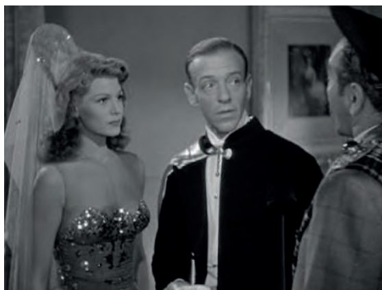
Figura 9. Fotograma de Bailando nace el amor .

La secuencia que tal vez mejor sirva a este propósito es la que entra en su dormitorio para desvestirse. Se quita el abrigo y deja ver un vestido con la espalda al aire, mientras se mueve de un modo sensual por la habitación. Luego se dirige al vestidor que hay al fondo, y sale de campo para reaparecer con un salto de cama con transparencias, muy sugestivo. Toda la acción la realiza mientras canta, con aire soñador, imaginando quién será ese enamorado desconocido que le envía flores sin remitente en la tarjeta. No menos llamativo es el elegante vestido que porta en la fiesta de disfraces celebrada en la mansión familiar: un traje de noche blanco, brillante, muy escotado y ajustado, con un tocado que recuerda a la teja y mantilla española.