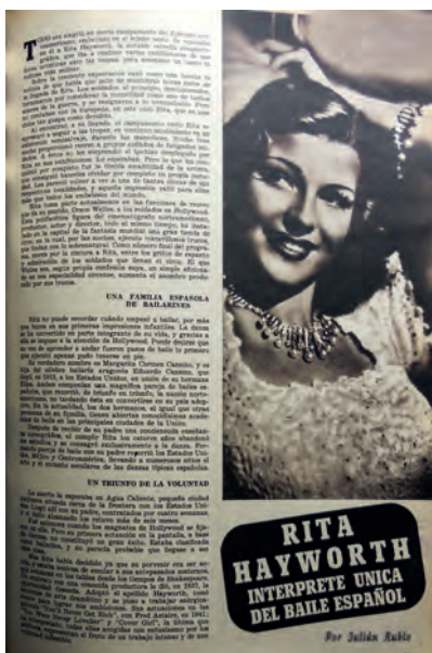
Figura 6. Cámara n.º 53, 15 de marzo de 1945.

Pero ya hemos visto que «Cinelandia» despertaba tanta fascinación como reparos morales. Así cuando se publica la noticia sobre la indemnización por el divorcio reclamada por Eddie Judson, se cuela un sibilino «Rita Haywort (sic) –antes Rita Cansino–, la famosa e insinuante doña Sol de Sangre y arena , que a sí misma se titulaba descendiente directa de españoles...», que accede a establecer cierto alejamiento con aquellas actitudes no propias de nuestra tradición 144 . Pero estas apreciaciones son una excepción, y se asegura que es una «intérprete única del baile español». Comenzó su carrera artística a los catorce años junto a su padre, «un célebre bailarín aragonés», con el que recorrió los Estados Unidos, México y Centroamérica, «llevando a numerosos sitios el arte y el encanto seculares de las danzas típicas españolas». Sus éxitos actuales «representan el fruto de un trabajo intenso y de una voluntad inflexible» 145 .