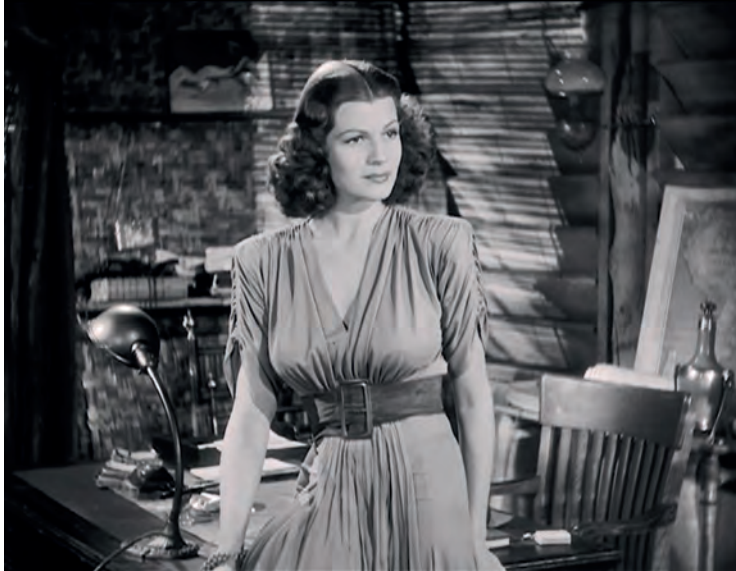
Figura 3. Fotograma de Solo los ángeles tienen alas .

Bonnie y Judy amenazan ese universo de masculinidad de una manera diferente. Bonnie ansía dejar su vida atrás y ofrece a Geoff una oportunidad de futuro. Está dispuesta a sufrir la incertidumbre que entraña el modo de vida de Geoff a cambio de su amor. Tan solo exige que él se lo pida, quien finalmente, incapaz de verbalizarlo, tiene que recurrir a un subterfugio para comunicárselo.