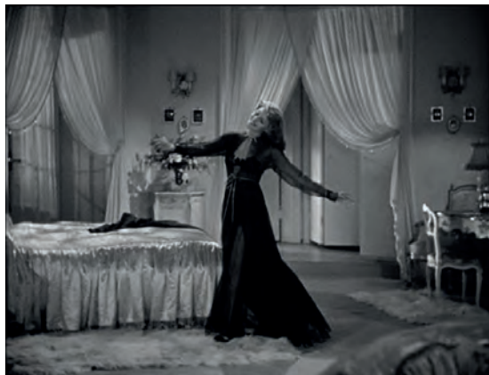
Figura 8. Fotograma de Bailando nace el amor .

La secuencia que tal vez mejor sirva a este propósito es la que entra en su dormitorio para desvestirse. Se quita el abrigo y deja ver un vestido con la espalda al aire, mientras se mueve de un modo sensual por la habitación. Luego se dirige al vestidor que hay al fondo, y sale de campo para reaparecer con un salto de cama con transparencias, muy sugestivo. Toda la acción la realiza mientras canta, con aire soñador, imaginando quién será ese enamorado desconocido que le envía flores sin remitente en la tarjeta. No menos llamativo es el elegante vestido que porta en la fiesta de disfraces celebrada en la mansión familiar: un traje de noche blanco, brillante, muy escotado y ajustado, con un tocado que recuerda a la teja y mantilla española.