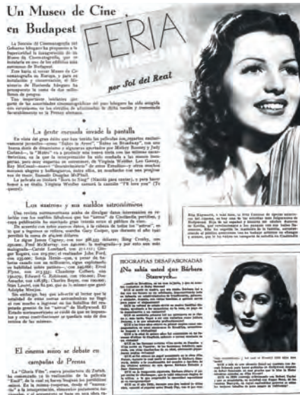
Figura 5. Primer plano n.º 70, 15 de febrero de 1942.

El estreno en los Estados Unidos de la adaptación de Sangre y arena dio pie a notificar al lector su verdadero nombre, mientras se recordaba que su abuelo Antonio ya había entusiasmado al público norteamericano con sus bailes flamencos 141 . También la prensa generalista como el diario ABC sumaba parabienes a este hallazgo, pero lo hacía con un desapasionamiento que más adelante transmutará en fervor patriótico. Pero todavía no. Ahora, el autor se conforma con criticar que en Hollywood los artistas se cambien el nombre y elude que en España, en esos mismos momentos, algunos de los más afamados intérpretes, como por ejemplo Alfredo Mayo, Imperio Argentina, Conchita Montes o Ana Mariscal, habían adoptado seudónimos. Y añade: «No seré yo quien riña aquí una batalla para reivindicar el españolismo de esta joven artista, pero, de todos modos, me parece interesante establecer su filiación» 142 .