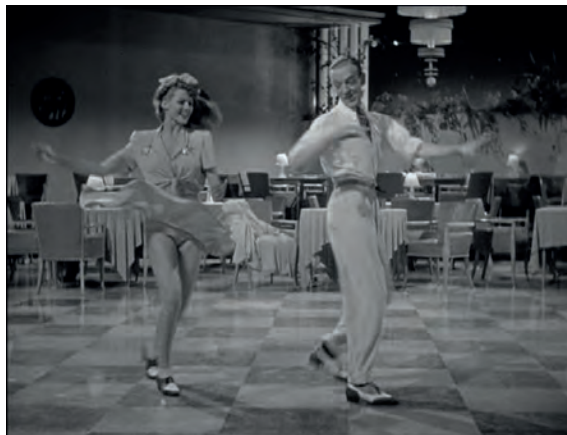
Figura 10. Fotograma de Bailando nace el amor .

Pero, al mismo tiempo, tanto en estas como en otras escenas, también las mujeres podrían sentirse cautivadas por su imagen, más allá de un posible atractivo homoerótico. Su belleza y sofisticación les resultaría fascinante, así como la naturalidad con que ejerce su capacidad de seducción.