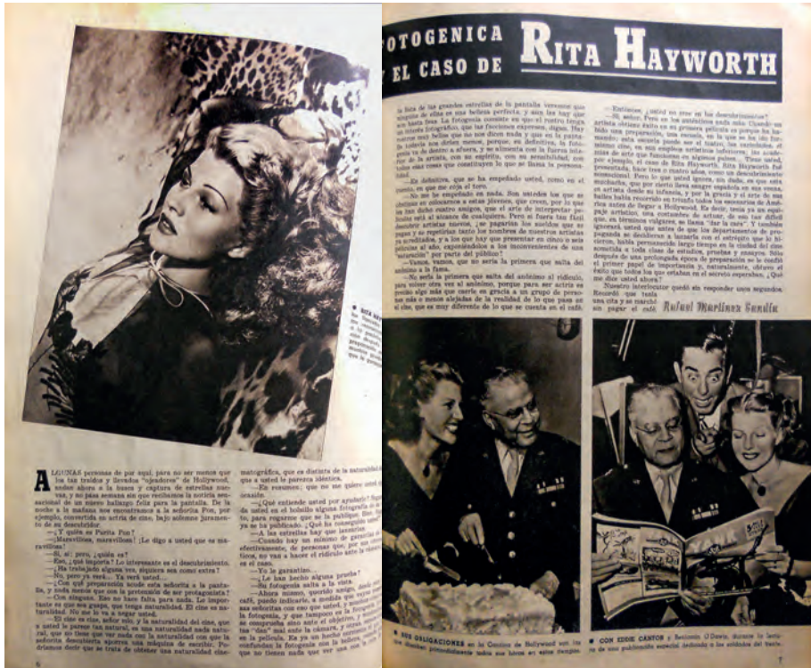
Figura 4. Cámara n.º 50, 1 de febrero de 1945.

sonaje, no sucedería igual con la belleza y la elegancia de su protagonista, que su director sabe exprimir a través de los encuadres y la iluminación. Además, acierta con la puesta en escena en la que se suceden las réplicas y contrarréplicas entre los intérpretes, en un juego en el que la esposa adúltera se debate entre mantener la farsa del amor por su marido o la huida con su amante.