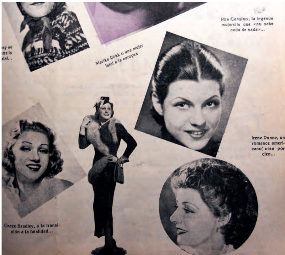
Figura 1. Radiocinema n.º 24, 15 de marzo de 1939.

del mercado editorial español. Se refiere a ella como Rita Cansino, con una foto de antes de su transformación física. Se trata de una doble plana en la que se destacan diversas actrices que están despuntando en ese momento. Aparece su fotografía junto a una pequeña apostilla: «La ingenua mujercita que no sabe nada de nada» 101 . Hace referencia a la clasificación de papeles cinematográficos primitivos entre la ingenua y la vampiresa. Una dualidad que, desde un patrón androcéntrico, oponía a la chica virtuosa, normalmente interpretada por actrices blancas norteamericanas, y a la mujer destroza-hogares, a menudo encarnada por latinas u orientales 102 . Aquí resulta paradójico que a ella se la coloque entre las primeras, mientras que acabará siendo uno de los exponentes de las segundas.