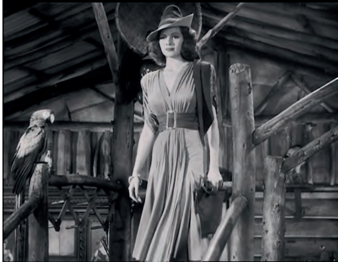
Figura 2. Fotograma de Solo los ángeles tienen alas .

la resistencia del varón a ser domesticado, a la renuncia de la libertad, y de ahí su incapacidad para comprometerse con una relación sentimental que le inste a abandonar su pasión por volar. La metáfora de la amenaza de una mujer que le corta las alas resulta apropiada. Según Pravadelli, lo que se plantea es cómo el deseo masculino desviado debe ser reconducido hacia la heterosexualidad, al sustituir Geoff a su mejor amigo por la mujer de la que se ha enamorado 137 .