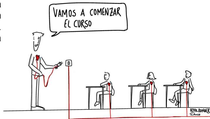
Figura 3. La tutoría es una pieza fundamental en la detección y prevención del acoso escolar.