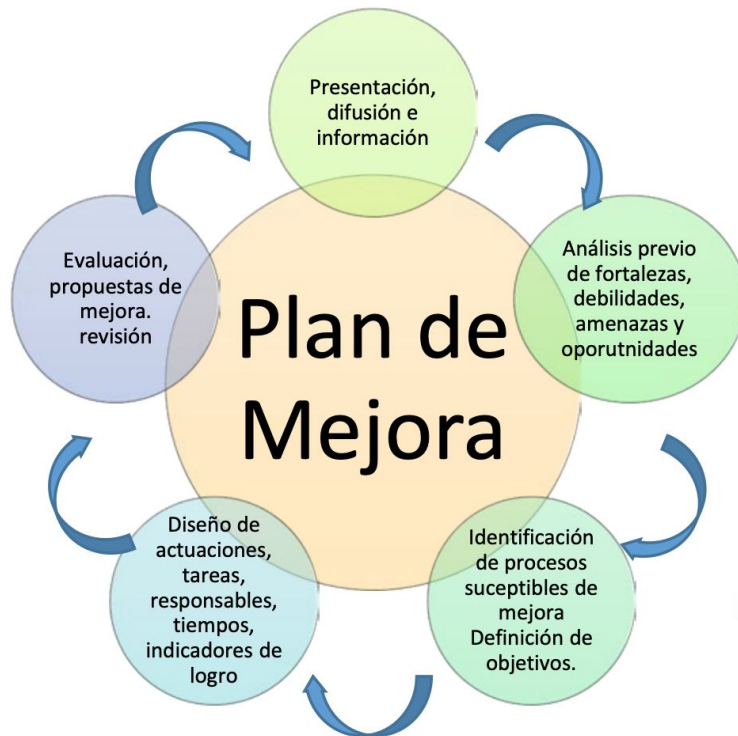
Figura 3. Fases para la elaboración del Plan de Mejora