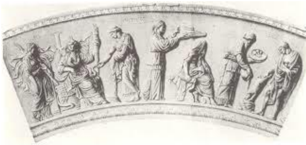
Fig. 2 Dibujo del relieve de la Urna Lovatelli . s. I a.C. – I d.C. Museo Nacional de Roma.

En una segunda versión más tardía, hay mayor importancia del personaje de Triptólemo, pues tiene que ver con el papel de Atenas y ese control que ejercía en el culto, pues en esta segunda versión Deméter dota a Triptólemo la agricultura colocando así a Atenas y su contexto como la cuna de la civilización 18 . Gracias a todas estas fuentes, donde también se introduce la iconografía 19 , podemos interpretar cual era el desarrollo ritual del culto, donde se presentan los espacios utilizados en tal proceso como por ejemplo la Urna Lovatelli (Fig.2)