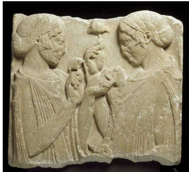
Fig. 1 La exaltación de la flor o Deméter y Perséfone. 470-460 a.C. Museo del Louvre.

Los Misterios Eleusinos poseen unas características que lo diferencian con el resto de religiones místicas que son más místicas, como el caso del culto Dionisiaco