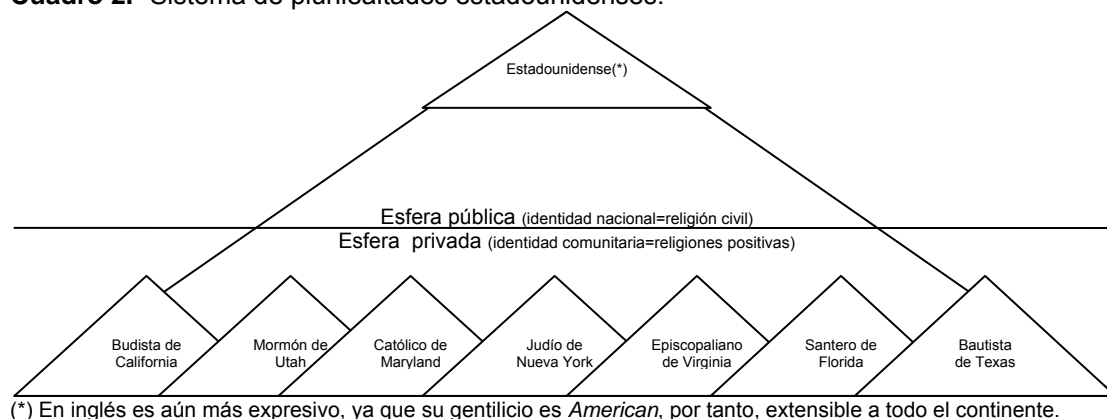
Cuadro 2.- Sistema de plurilealtades estadounidenses.

En consecuencia, el neoconservadurismo es la ideología que protege los intereses de los occidentales, bajo discursos disonantes de progreso y tradición (la ciencia y técnica modernas combinadas con el pensamiento clásico grecolatino y judeocristiano), así como, de individualismo y solidaridad (la realización personal combinada con la noción de interdependencia). De tal modo se proyecta el neoconservadurismo en materia de democracia y derechos humanos, por considerarse sendas cuestiones fruto del progreso de la tradición judeocristiana y del individualismo garante del American way of life . Así se revitaliza la autopercepción estadounidense de nación homogénea con un destino manifiesto, consistente en la promoción internacional de sus logros domésticos, como son la democracia y los derechos humanos –lo cual, por algo se tildó antes de falaz, ya que nunca existió un único EE.UU., pues fueron necesarias las políticas federales integradoras del New deal en 1930's y los últimos Estados de la Unión se integran en 1950's; además, pese a que la democracia y los derechos humanos fueron una realidad desde los comienzos de los EE.UU., lo fueron de forma imperfecta, con categorías discriminantes de facto 28 .