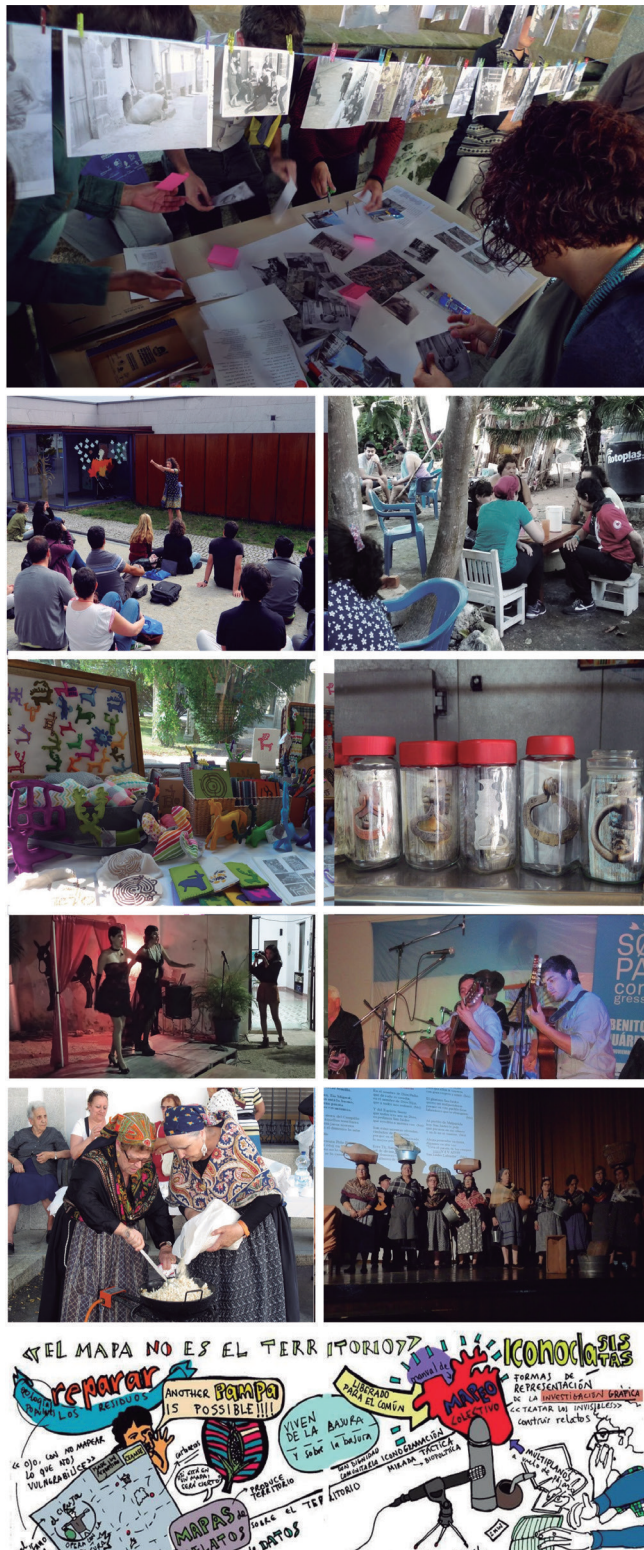
Figura 6. Uso de nuevos lenguajes en la transmisión de conocimiento patrimonial que se han ido adoptando en las diferentes ediciones del SOPA.

mercados, centros de interpretación,... Esta forma de hacer nos permite, por una parte, reflexionar sobre el uso de los espacios públicos generando dinámicas de reapropiación de los mismos, y por otra, incorporar a diferentes sectores de la sociedad en sus zonas de confort.