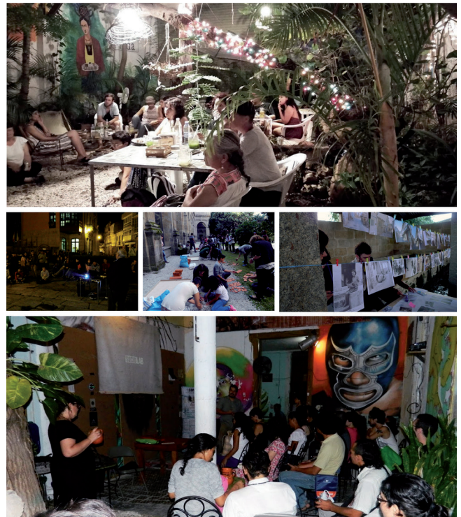
Figura 5. Diferentes usos del espacio público en el SOPA.

el rural como ese entorno idílico donde la gente “vive mejor”. Además, son territorios de revalorización y visibilización de los bienes comunes, que han estado dominados por una desintegración vinculada a los diferentes procesos de monetización, convirtiéndose en plazas de lucha en las que recrear ese espacio que tenían los comunes entre el binomio público/privado (Quiroga 2013: 163) y romper las prácticas de fosilización de la cultura (Ariño 2012:20), desde la perspectiva de uso o reúso de los espacios y memorias patrimoniales como forma de romper con las dinámicas de resignificación del patrimonio. El rural supuso, y supone, para la Comunidad SOPA un territorio en el que practicar lo que Felipe Criado llama “ciencia de guerrilla” (Criado-Boado, 2016:81-82).