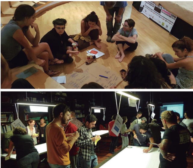
Figura 3. Mesas de trabajo del SOPA16 (Zalamea de la Serena) y del SOPA14 (Celanova).

Otro de los ejes que definen el SOPA es su vocación rural [figura 4]. Esto se debe a varias causas. Una de ellas es porque en las comunidades rurales todavía se practica la autogestión y el trabajo colaborativo, ejemplo de esto lo tenemos en los montes vecinales, las dehesas boyales o los auzolan. También tuvimos en cuenta la falta de interés en incorporar las realidades de las personas que habitan el rural en las prácticas de gestión participativa que se producen en ámbitos urbanos, que en la mayoría de los casos se limita a ver