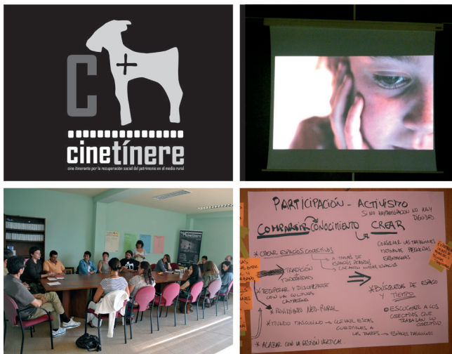
Figura 1. Imágenes del proyecto Cinetínere.