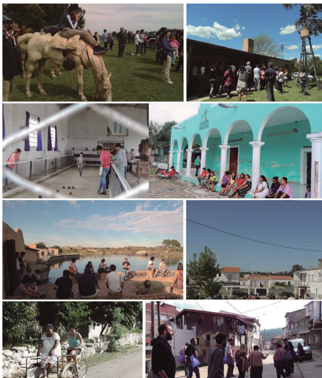
Figura 4. Espacios rurales que han sido sede del SOPA.

Otro de los ejes que definen el SOPA es su vocación rural [figura 4]. Esto se debe a varias causas. Una de ellas es porque en las comunidades rurales todavía se practica la autogestión y el trabajo colaborativo, ejemplo de esto lo tenemos en los montes vecinales, las dehesas boyales o los auzolan. También tuvimos en cuenta la falta de interés en incorporar las realidades de las personas que habitan el rural en las prácticas de gestión participativa que se producen en ámbitos urbanos, que en la mayoría de los casos se limita a ver