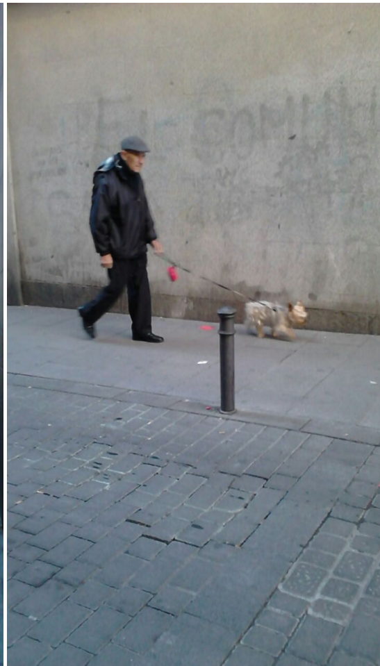
Población mayor del barrio