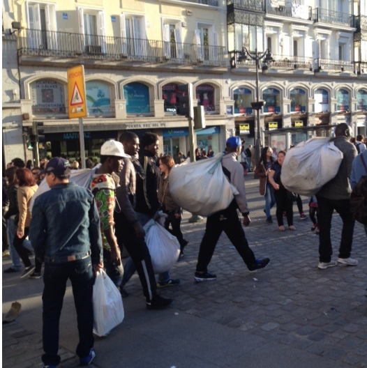
“Manteros” de Lavapiés

Actividad salida por barrio de Embajadores y fotografías de los alumnos para su trabajo de curso.