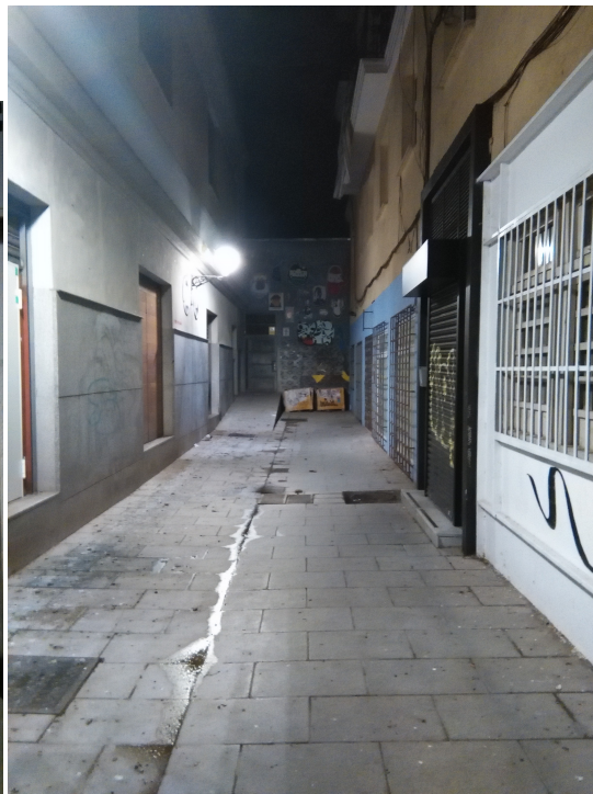
Callejón adyacente a la Calle analizada