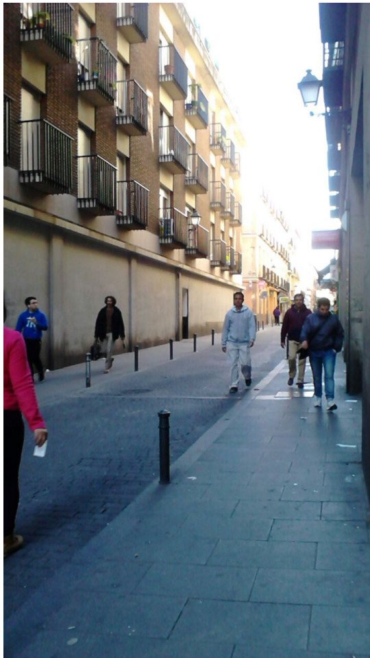
Viviendas nuevas. Población (mezcla)