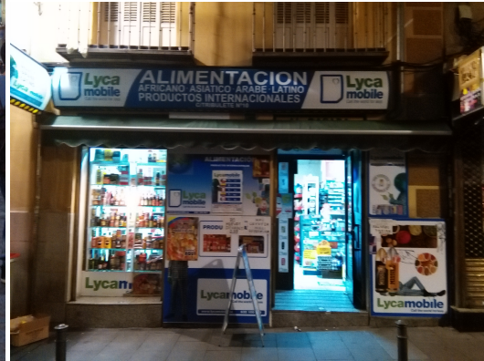
Comercio étnico Lavapiés