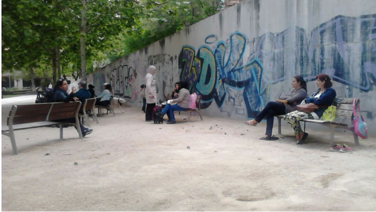
Diversidad de grupos en los parques