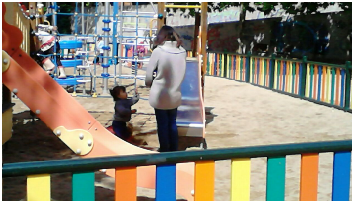
madres con niños en el barrio