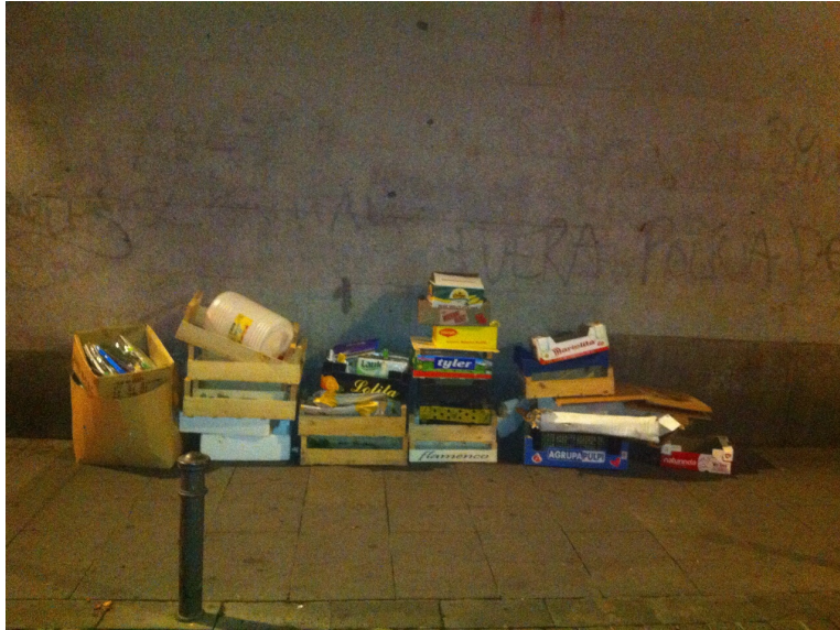
Deterioro del barrio (pintadas y cajas vacías en la calle)