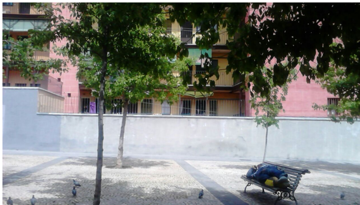
Homeless en los bancos del parque