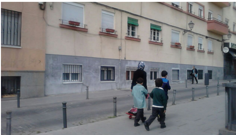
Diversidad étnica en el barrio