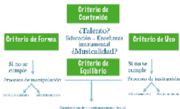
Figura 3. Red nomológica de educación musical (elaboración propia).

A partir de estas coordenadas contextuales ciertamente sería difícil aplicar el término “educación” y su red al ámbito musical, puesto que en numerosas ocasiones atentan de forma ostensible con los criterios de forma y equilibrio de Esteve (figura 3). Algunos de los procesos de manipulación e instrucción, que impiden el cumplimiento de varios criterios, son como acabamos de ver, característicos de la enseñanza musical formal, donde según acabamos de comprobar en la investigación etnográfica, el talento o la musicalidad son términos imprecisos entre los propios profesionales.