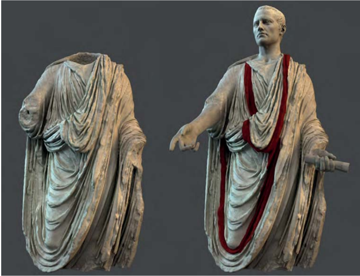
Figura 8. Fotogrametría y restitución virtual de una de las estatuas togadas halladas en las excavaciones en el foro.

Fuente: Balawat. Dirección del proyecto: R. Cebrián.