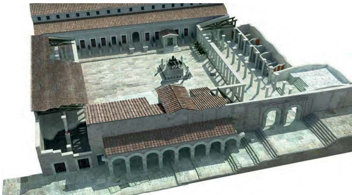
Figura 3. Reconstrucción virtual del foro de Segobriga .

Dirección del proyecto: J. M. Abascal y R. Cebrián.