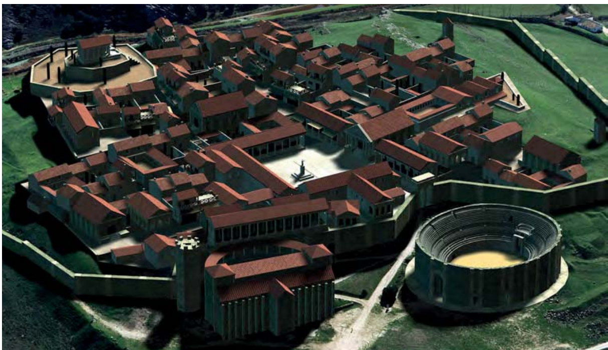
Figura 2. Primera reconstrucción virtual de la ciudad de Segobriga .

Dirección del proyecto: J. M. Abascal.