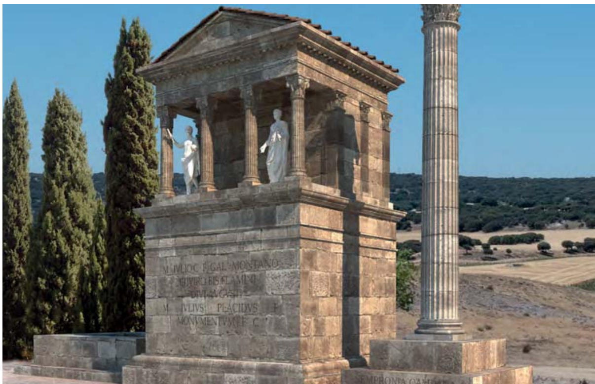
Figura 7. Integración 3D sobre paisaje real de dos de los monumentos funerarios excavados en la necrópolis septentrional.

Fuente: Balawat. Dirección del proyecto: R. Cebrián.