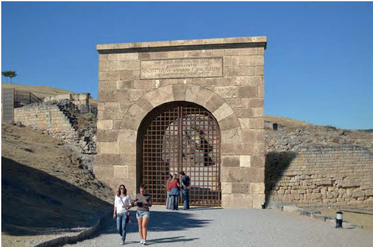
Figura 6. Integración 3D de la puerta principal de acceso al anfiteatro sobre fotografía real.

Fuente: Balawat. Dirección del proyecto: R. Cebrián.