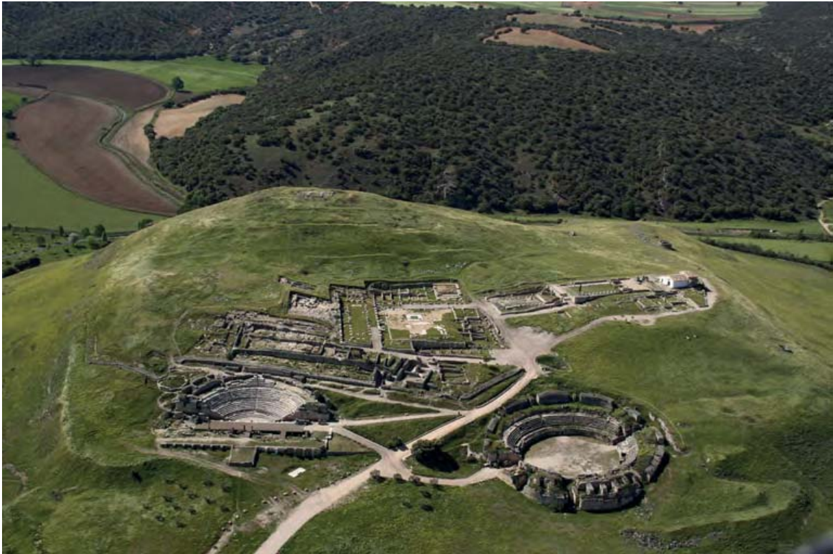
Figura 1. Vista aérea de Segobriga.