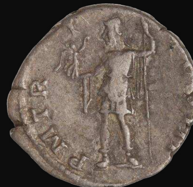
Roma. s. II d.C.