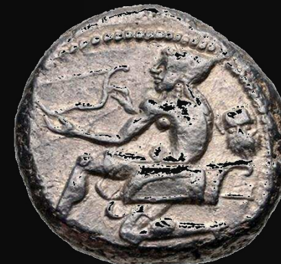
Soloi (Cilicia). s. V a.C.