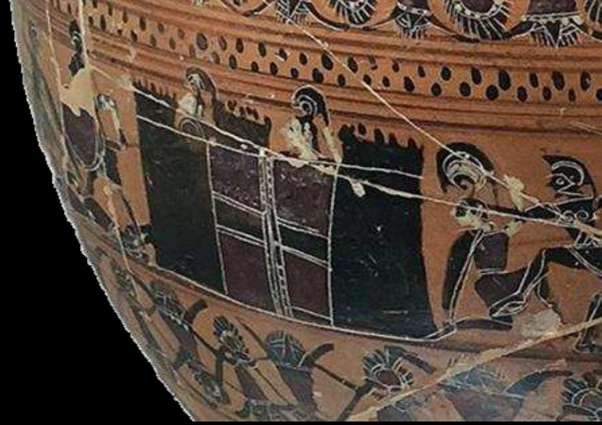
Ánfora de cuello de figuras negras. Tarquinia (575-525 a.C.)