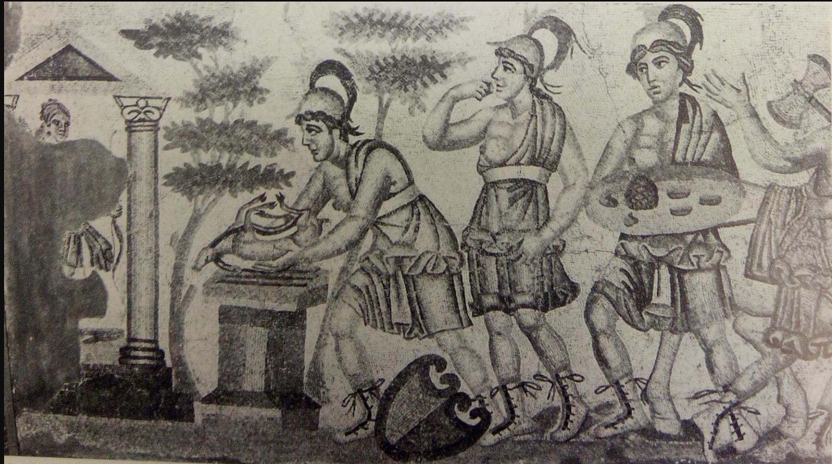
Mosaico de pavimento. Ofrenda a Ártemis. 300 d.C. Ouled Agla.