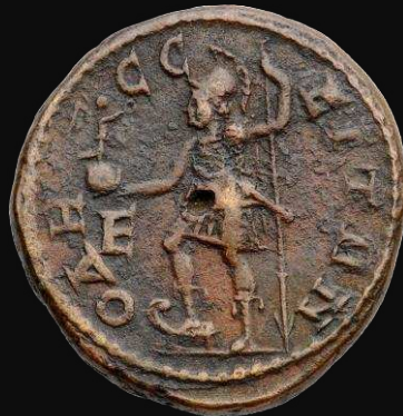
Odessos (Tracia). s. III d.C.