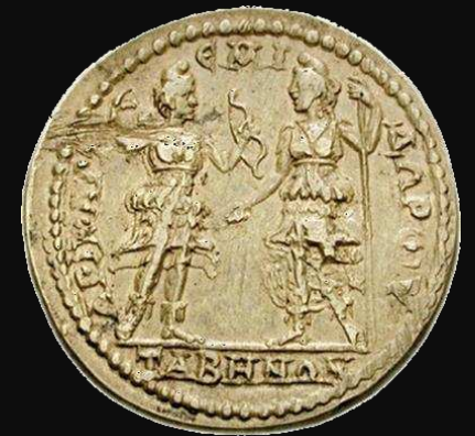
Tabae (Caria). 198-217 d.C.