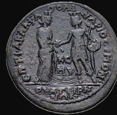
Tiatira (Lidia). 238-244 d.C.