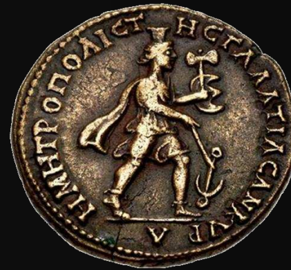
Ancira (Galatia). 138-161 d.C.