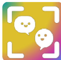
FIGURA 1. Imagotipo del proyecto FOTO-Edu

En este capítulo se describen los fundamentos teóricos y metodológicos del proyecto de investigación I+D+i PID2022-136865OA-I00 “La Foto-Elicitación como estrategia educativa inclusiva para afrontar el absentismo escolar: estudio de casos múltiples en centros de especial dificultad” con acrónimo FOTO-Edu. Ha sido concedido a la Universidad Complutense de Madrid (UCM) por el Ministerio de Ciencia e Innovación en la convocatoria 2022 en modalidad de jóvenes investigadores. Participan en el equipo investigadores de la UCM, de la Universidad de Lleida y de la Universidad de Oviedo (Fernández-Rodrigo et al., 2023).