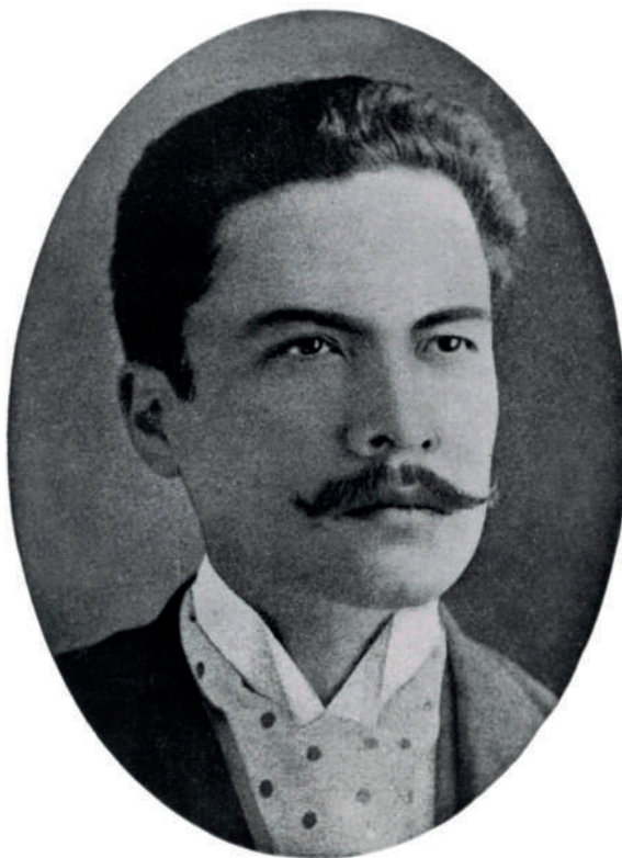
Fig. 1. Retrato de Rubén Darío a los 25 años de edad, 1892.