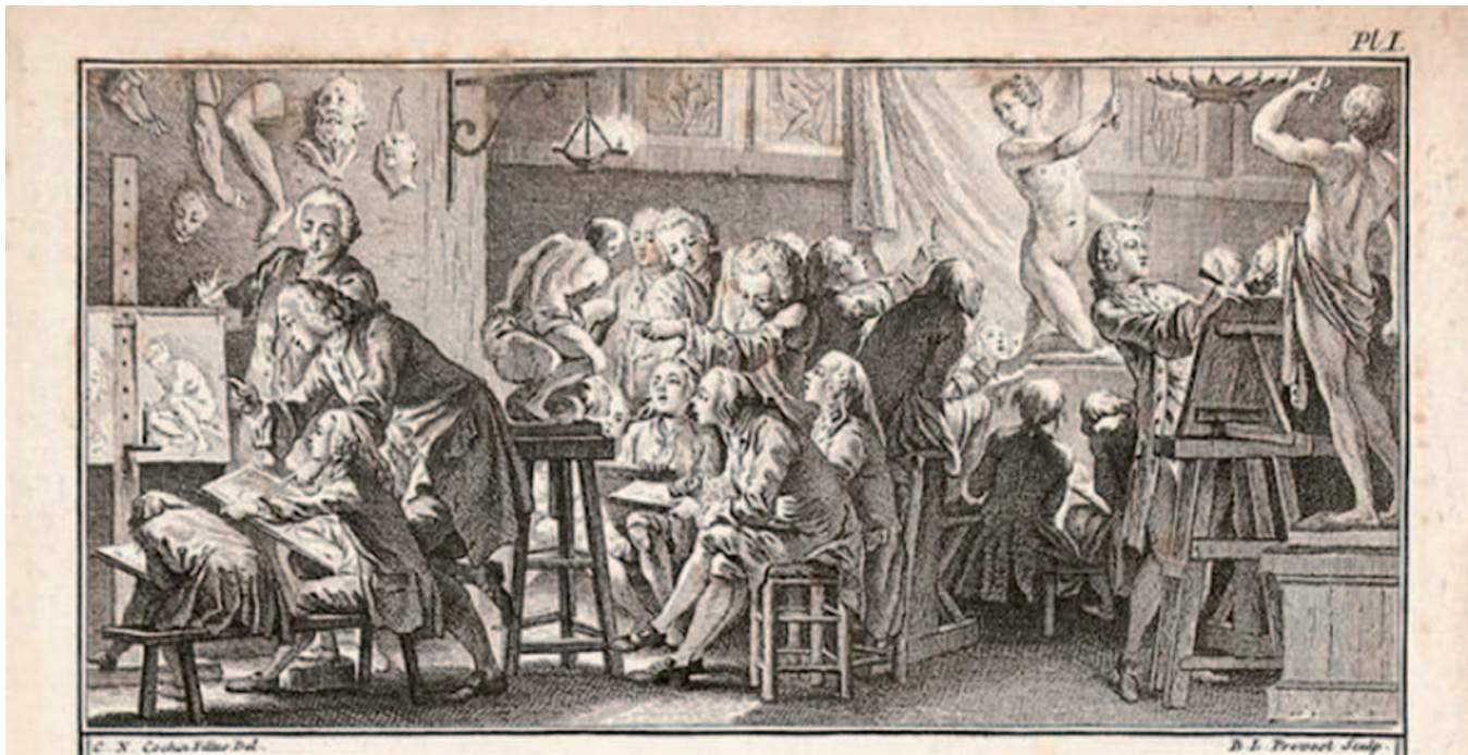
Imagen 5. Escuela de Dibujo. Grabado. En Diderot y d'Alembert (1713-1784). Encyclopédie ou Dictionnaire raisonné des sciences, des arts et des métiers .