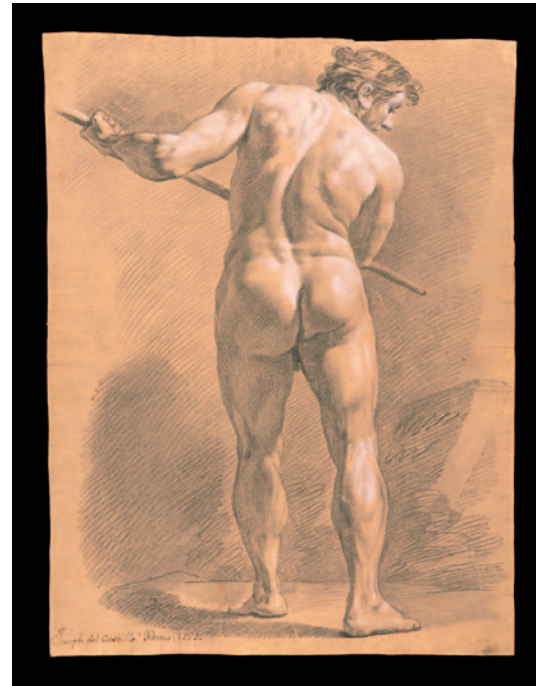
Imagen 6. Dibujo de Academia . José del Castillo (1759). Facultad de Bellas Artes de Madrid, UCM.

Durante todo el siglo XVI y XVII los artistas han viajado a Italia para estudiar a los grandes maestros —entre ellos Rubens