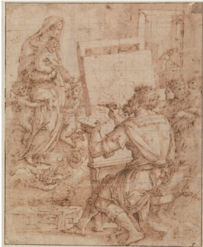
Imagen 1. San Lucas pintando a la Virgen . Giorgio Vasari (1567-1572). Lápiz, pluma, aguada y tinta parda, 264 x 214 mm. Museo Nacional del Prado, Madrid.