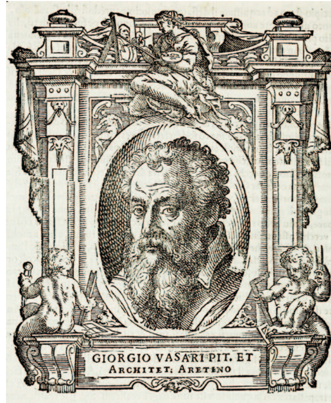
Imagen 2. Retrato de Giorgio Vasari . Cristóforo Coriolano. (1568). Xilografía. En Delle vite de più eccellenti pittori, scultori et architetti , Florencia.