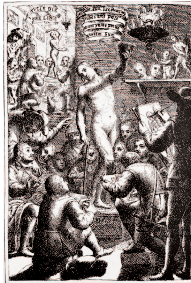
Imagen 4. Academia . Grabado. En José García Hidalgo (1693). Principios para estudiar el nobilísimo y real arte de la pintura .

Estas academias, creadas fundamentalmente en los talleres de los pintores, no tuvieron apoyo institucional, con lo cual, sin ninguna vinculación académica legal fracasaron en sus esfuerzos por establecerse formal y perdurablemente.