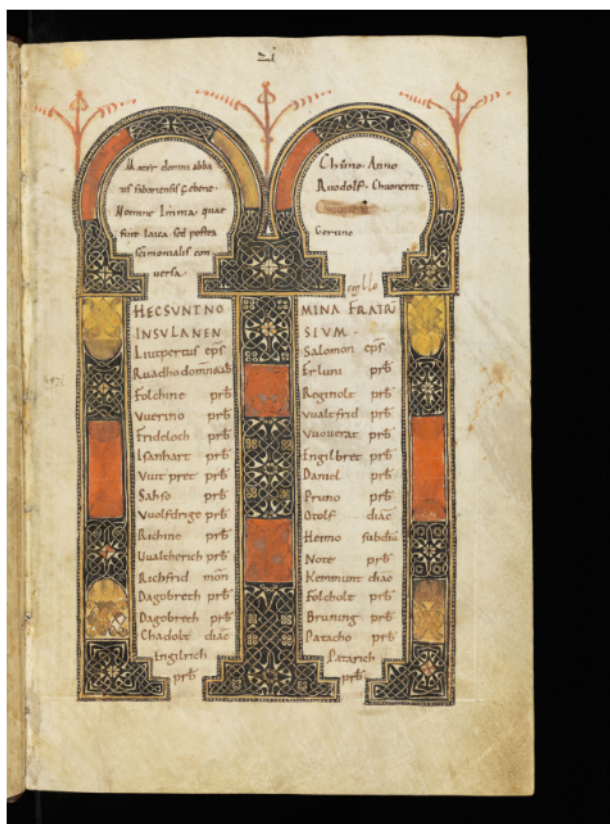
Fig. 1. Liber Viventium de Pfäfers. Primera lista, tras el Evangelio de San Mateo.

largitate fundaverunt , entre los que se destaca Carlos Martel. En el siglo X se le añadió un cuaternión (es decir, un cuadernillo de ocho hojas) con profesiones monásticas y algún otro material suelto. El contenido del libro de Reichenau está organizado básicamente por comunidades, comenzando por los vivos y difuntos del propio Reichenau, seguidos por los de San Gal, pero en el resto de las comunidades no se hace distinción entre vivos y muertos. Las más de cien comunidades están distribuidas por prácticamente todo el reino franco e Italia, incluyendo, entre las más importantes, San Gal, Kempten, Wessobrun, Augsburgo, Ottobeuren, Frisinga, Niederaltaich, Chiemsee, Weissenburg, Münster-im-Gregoriental, Prüm, Lorsch, Colonia, Constanza, Corvey, Werden, Bremen, Luxeuil, Saint Germain-des-Près, San Denis, Meaux, Rouen, Jumièges, San Bertin, Flavigny, Lyons, Vienne, Novalesa, Nonantola, Brescia y Benevento. También hay muchos obispos y laicos, incluyendo 25 miembros de la familia real carolingia.