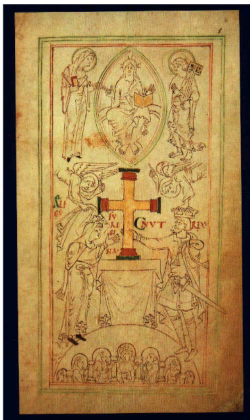
Fig. 2. Ilustración inicial del Liber Vitae de New Minster, Winchester. Arriba, Cristo sosteniendo el Libro de la Vida celeste. Abajo, la comunidad de New Minster, con su propio Liber vitae .

Liber memorialis de San Salvador y Santa Julia de Brescia (Brescia, Biblioteca Civica Queriniana, MS G VI.7) 62 . Compilado en el año 865, consta de una sección memorial y una sección litúrgica. La parte litúrgica contiene numerosas fórmulas de misas votivas y bendiciones, junto con textos del Evangelio y una letanía. La conmemorativa contiene 7.002 nombres, de los cuales 2.416 fueron copiados por la misma mano a partir de listas preexistentes. Las listas se agrupan por comunidades religiosas, pero también hay listas de laicos, además de una curiosa lista de niñas oblatas, que incluye además a las personas que las ofrecieron.