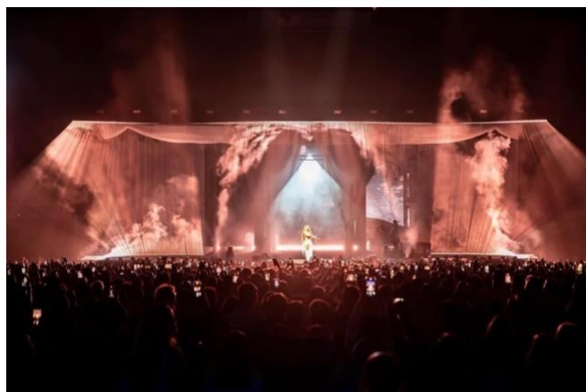
Figura 11: Diseño de iluminación del concierto Anela en el Movistar Arena.

El espectáculo también incorpora escenas dominadas por gamas cálidas protagonizadas por tonos rojos, ámbares y naranjas, que evocan sensaciones de fuego, energía primitiva o ritualidad. Estas configuraciones contrastan con los diseños fríos anteriores, aportando un tono más terrenal y visceral. La luz lateral superior que se abre hacia el público genera una sensación de expansión que integra al espectador en la atmósfera ritual del espectáculo. El humo también colabora con la luz, potenciando en su volumen.