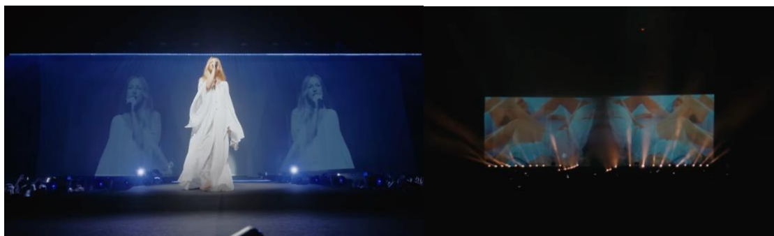
Figura 6 y 7: Composición visual del inicio del concierto Anela en el Movistar Arena.

Hay actuaciones en las que las pantallas laterales mostraban exclusivamente contenido del propio directo, mientras que en la pantalla frontal combinaba contenido del directo y creaciones digitales. Este juego reforzaba la sensación de estar viajando entre la realidad y lo mágico, en total sintonía con la estética del proyecto. Por otro lado, en contadas ocasiones el propio telón se utilizó como pantalla en la que se proyectaban imágenes, esta técnica se usó al inicio del concierto y en momentos de transición, mostrando vídeos de los ensayos, actuando literalmente como una pantalla de cine.