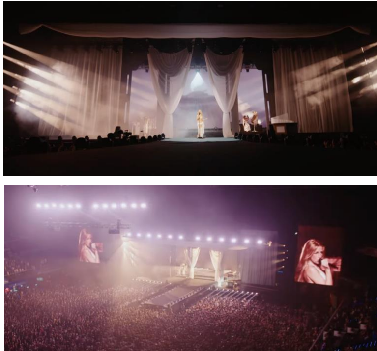
Figura 27 y 28: Vista general del escenario durante el concierto Anela en el Movistar Arena.

El escenario es completamente horizontal, ocupando toda la parte frontal del Movistar Arena, del centro sale una pasarela hacia al público. Esta amplitud lateral hace que la lectura del público sea mucho más panorámica de la normal recordando a un cine, cosa que se percibe también con el uso del telón como un proyector. Por otro lado, la simetría de las telas blancas evoca a la pureza, el mármol y las túnicas griegas características de la estética de las musas o las esculturas.