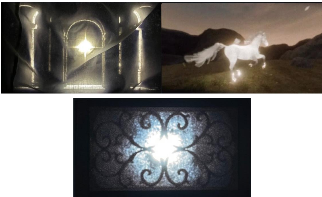
Figura 3,4 y 5: Capturas de imagen del diseño de los visuales del concierto Anela en el Movistar Arena.

colectivo de lugares encantados donde se realizaban rituales o esos universos fantásticos que aparecen en la iconografía de películas como El señor de los anillos o Narnia . Esto refuerza esa conexión del concierto con lo místico, lo irreal y lo sobrenatural. Estos visuales se proyectan siempre en la pantalla central del escenario, la más grande y única horizontal, por tanto, los visuales acaban formando parte de un fondo centrado recordando así la mecánica de una sala de cine, sirven como soporte visual que hace que el espectador entre de manera más rápida en la narrativa mística del concierto. Entre las figuras que vemos en la pantalla destacan aquellas que evocan una carga simbólica mayor como puede ser un caballo blanco que recuerda a un unicornio, es una figura escultórica muy recurrente para este tipo de narrativas porque recuerda a la mitología griega y representa la protección divina, la guía espiritual, la pureza o la fuerza. Además, esta figura aparece muy iluminada y corriendo hacia un lugar que parece tener claro, esto acompaña a esa idea del relato del concierto de estar buscando siempre el deseo de algo e ir a por ello.