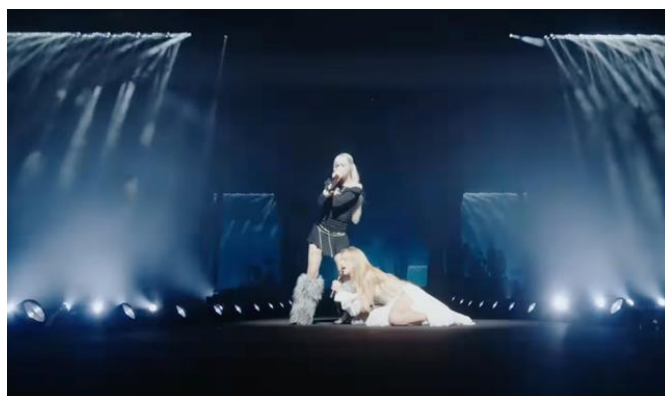
Figura 20: Composición corporal durante la actuación de Dama en apuros remix .

En la actuación junto a Métrika, la composición corporal evoca de manera directa la iconografía de La Piedad (1499), donde la artista adopta una posición arrodillada que reproduce la intención emocional y visual de esta escultura. Es un ejemplo concreto de esta búsqueda escultural, Belén quería generar una escena basada en la presencia de un ser mágico y potente (la invitada) que apareciera como una escultura viva, poderosa y monumental ( El Club de la Corchea , 2025). La escena subraya el carácter de entrega, sostén y duelo, integrando el cuerpo como elemento narrativo de alto contenido simbólico.