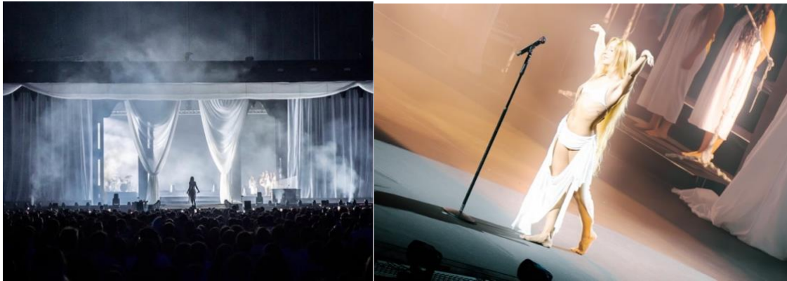
Figura 1: Vista general del escenario durante el concierto Anela en el Movistar Arena.

Las influencias de disciplinas como la ópera, el teatro, el arte performativo, la estética psicodélica y la consolidación del videoclip supusieron un cambio definitivo: los artistas pasaron a ser figuras visuales con identidades narrativas, y los conciertos adoptaron progresivamente recursos cinematográficos para configurarse como propuestas visuales coherentes y reconocibles. (Cultura Joven, 2024)