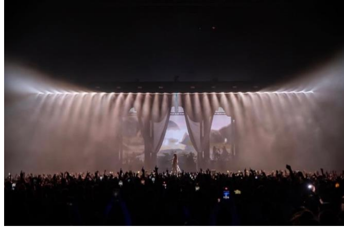
Figura 13: Diseño de iluminación del concierto Anela en el Movistar Arena.