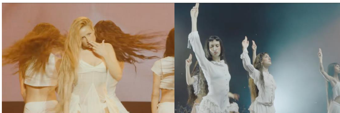
Figura 25 y 26: Composición corporal durante la actuación de El Laberinto .