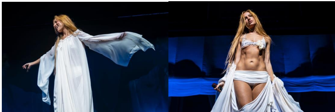
Figura 14: Diseño del primer vestuario del concierto Anela en el Movistar Arena.

Posteriormente, la artista reaparece con un nuevo vestuario compuesto por un vestido completo, acompañado de mangas independientes y un velo que contribuye a reforzar la solemnidad y el carácter ritual de una de las interpretaciones más intensas del concierto, Como una ola de Rocía Jurado. Tras esta actuación, el velo se retira, lo que transforma la percepción visual del conjunto sin modificar la base del diseño. Finalmente, la intérprete prescinde también de las mangas, quedando con un diseño más simple que simboliza una transición hacia la liberación emocional que representa el cierre narrativo del espectáculo. Tanto la artista como las bailarinas permanecen descalzas durante todo el concierto, reforzando así la naturalidad, el simbolismo ritual y la conexión con el imaginario místico propuesto.