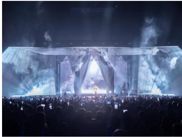
Figura 9: Diseño de iluminación del concierto Anela en el Movistar Arena.

del espectáculo, habituales en conciertos donde la música se integra con un relato escénico de carácter alegórico.