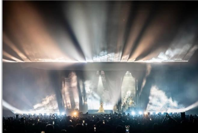
Figura 12: Diseño de iluminación del concierto Anela en el Movistar Arena.