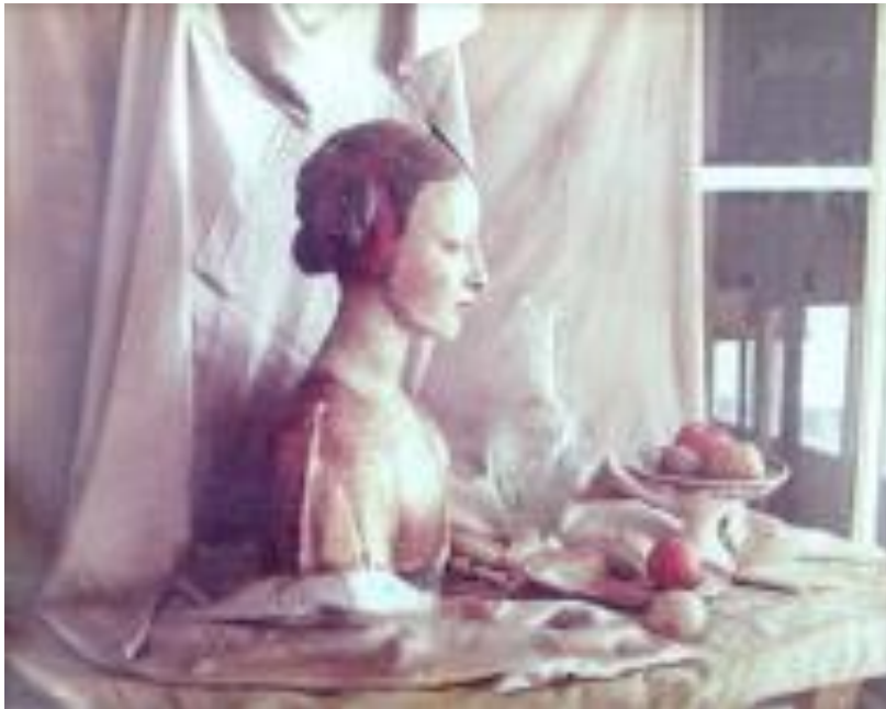
Imagen 3. Fotografía. Curso: 1976-77