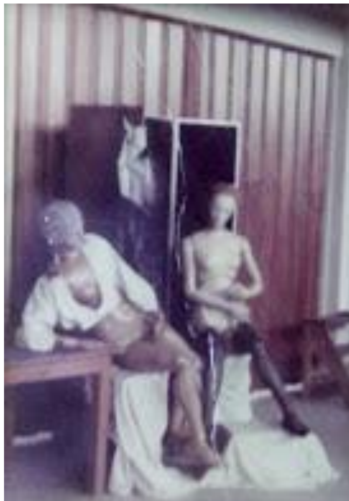
Imagen 4. Fotografía. Curso: 1976-77