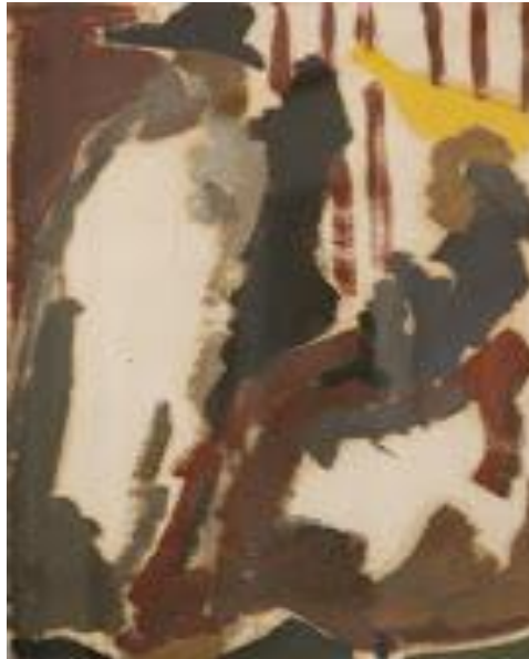
Imagen1. Boceto referente bodegón. Técnica: óleo. Medidas: 24x32 cm.