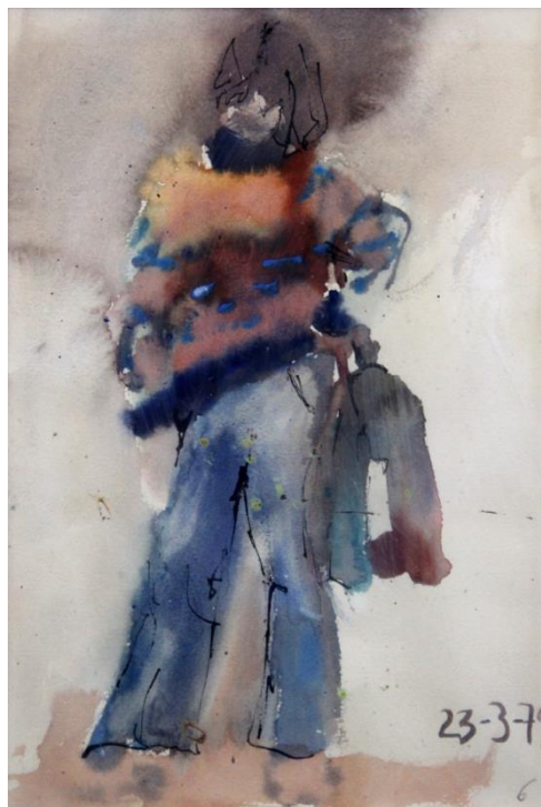
Imagen 2. Boceto referente modelo vivo. Técnica: acuarela y tinta. Medidas: Año: 24x32cm. 1979