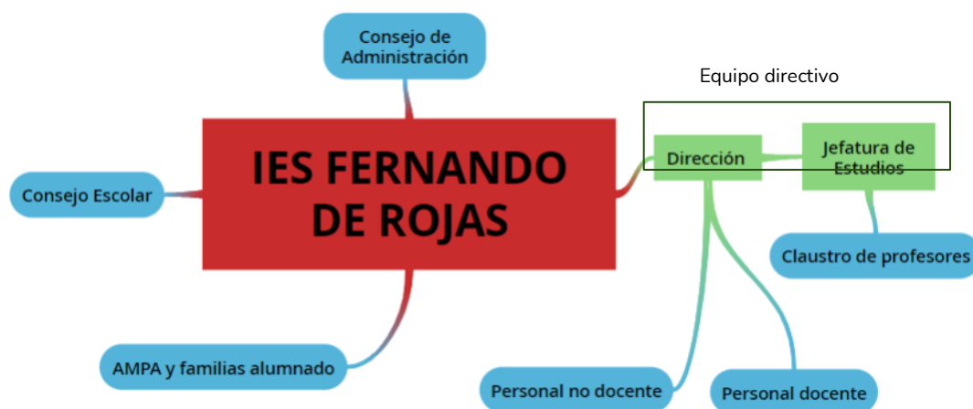
Figura 2. Cronograma del I.E.S. Fernando de Rojas.

A continuación os mostramos las titulaciones, la experiencia docente y formación de las personas que componen el consejo escolar y las personas que componen el equipo directivo.