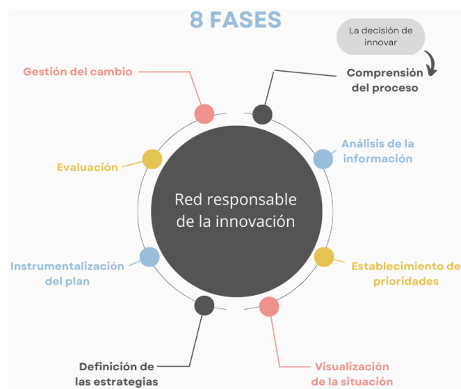
Figura 5. La decisión de innovar y las ocho fases del MIE del IPN. Ortega, P. et al. 2007

Tras está decisión, nos encontramos con 8 fases que acompañan el proceso de innovación: