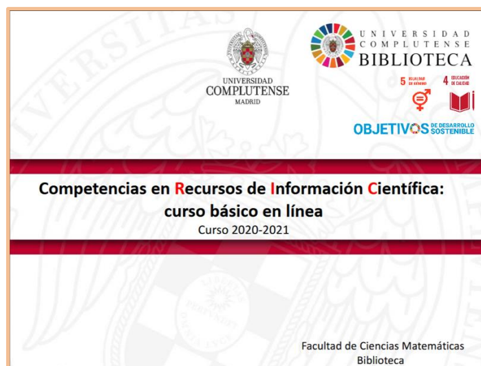
(ejemplo de caratula de curso, sin y con ODS)