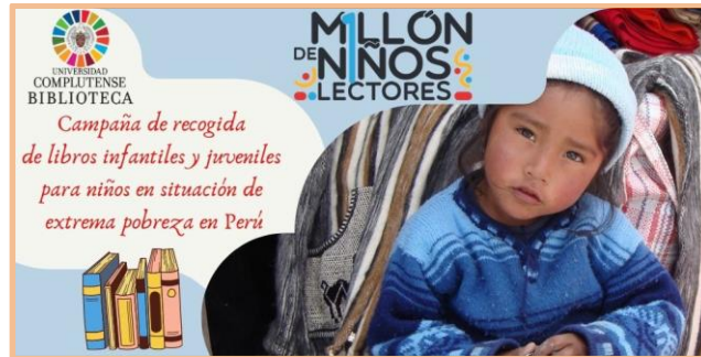
(campaña de recogida de libros infantiles y juveniles, BUC 2021)

Podemos observar que esta campaña se relaciona con el ODS 4, Educación de calidad. Si la ONG reparte esos libros o crea una biblioteca con ellos, se trabajaría en la línea de la meta 4.1 y 4.2.