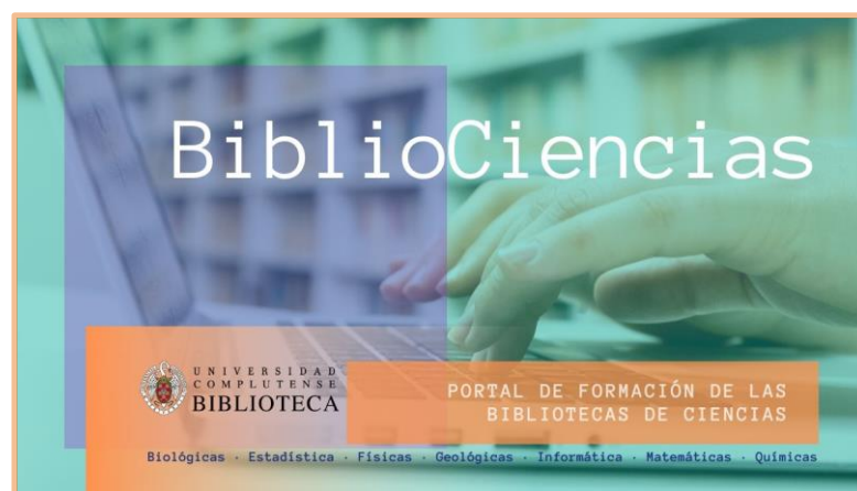
(cartel formación Bibliociencias, marzo 2021)

La alfabetización y las competencias digitales a todos los niveles mantienen una identificación con los ODS evidente (ODS 4, por ejemplo). En la portada del material formativo que con los cursos se distribuye (powerpoint, etc.), podemos introducir el icono correspondiente. La labor del formador y de la biblioteca como divulgadora de conocimiento debe quedar clara a los alumnos. No se trata de hablar monográficamente sobre los ODS, pero sí que se puede incorporar una pequeña e introductoria mención a estos.