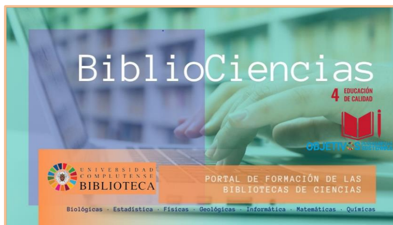
(cartel formación Bibliociencias con logo y ODS 4)