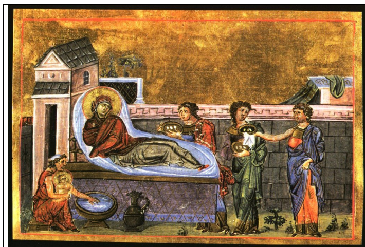
Natividad de María, miniatura de Menologio de Basilio II, h. 985

Hoy las puertas de la esterilidad [de Joaquín y Ana] se abren, y una puerta virginal y divina [María] se adelanta: a partir de ella, mediante ella, el Dios que está más allá de todos los seres, debe “venir al mundo” “corporalmente” (...) Hoy de la raíz de Jesé ha brotado un tallo, del que se elevará por el mundo una flor substancialmente unida a la divinidad. 65