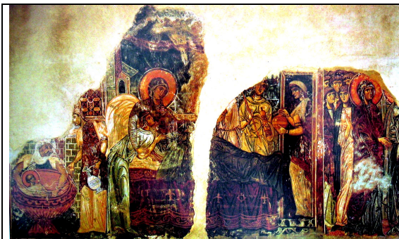
Natividad de la Virgen, fresco, 1164. Iglesia de S. Panteleimón, Nerezi, Skopje, República de Macedonia.

hace de una comadrona y una cuna, 56 durante la Edad Media los artistas y los diseñadores de los programas iconográficos interesados en este episodio mariano anadieron por su cuenta anécdotas fabulosas y pormenores de gran emotividad. Combinados los distintos detalles narrativos propuestos en ese tema iconográfico por los artistas bizantinos, las distintas representaciones de la Natividad de María suelen tener en común ciertos elementos esenciales, referentes a personajes, actitudes, acciones, situaciones, escenografía y accesorios.