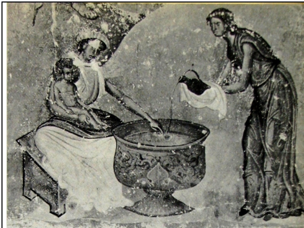
Natividad de la Virgen, fresco, c. 1265. Monasterio de Sopoçani, Serbia. Detalle del baño

Joaquín y Ana se hicieron « semillas de justicia » y recogieron « un fruto de vida ». ” 66 Reforzando, si cabe, la plausibilidad de la interpretación de esos huevos como sugerente metáfora de la Vida eterna que aseguraría Jesús a la Humanidad podríamos aportar estas afirmaciones del doctor de Damasco: “Mantente alegre, feliz Ana, por haber dado a luz una mujer. Pues esta mujer será Madre de Dios, puerta de la luz, manantial de vida.” 67