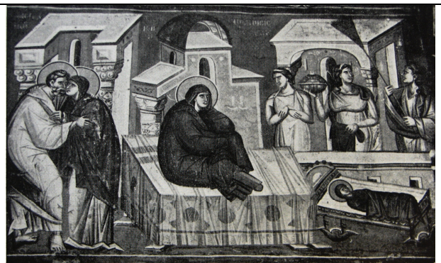
Natividad de la Virgen, fresco, 1295. Iglesia de la Peribleptos (hoy San Clemente), Ohrid, República de Macedonia

Respecto a los cuatro primeros elementos los artistas coinciden, por lo general, en las siguientes pautas: ocupando el sector principal del cuadro, vestida por completo con amplios ropajes, Ana permanece sentada o yacente sobre un lecho, para significar el parto recién producido o aún en proceso; la recién nacida aparece casi siempre desnuda o semidesnuda, en brazos de una comadrona que se prepara para bañarla, si bien a veces se halla vestida o cubierta con fajas (en ocasiones, se la representa dos veces, en el momento del baño, y durmiendo en su cuna o siendo depositada en brazos de su madre); 57 a su vera, en los primeros planos, una o varias comadronas agachadas o en cuclillas lavan a la niña en una tina o pila, mientras otras parteras, de pie, pueden a veces ayudar a Ana, sosteniéndola, durante o después del parto; algunas sirvientas se acercan a la parturienta para ofrecerle alimento y bebida; muy raras veces aparece Joaquín, quien, en ese caso, lo hace de manera muy discreta en algún rincón del cuadro.