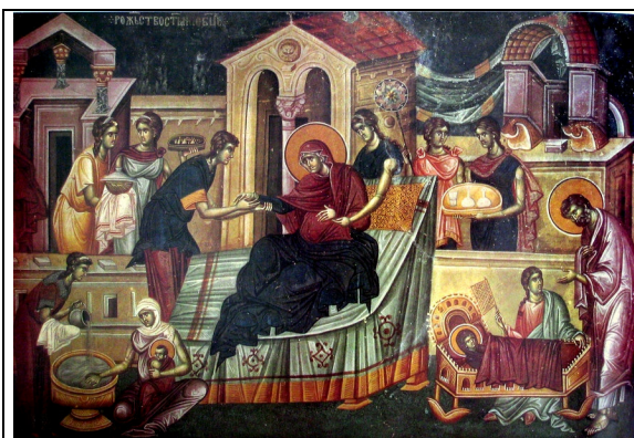
Natividad de la Virgen, fresco, 1313-1314. Monasterio de Studenica, iglesia del rey, Studenica, Serbia