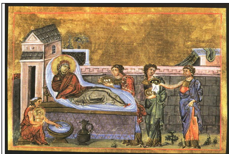
Natividad de María, miniatura del Menologio de Basilio II , h. 985. Biblioteca Vaticana, Roma

Con el propósito de ver si las imágenes bizantinas que representan el tema del nacimiento de la Virgen recogen en alguna medida los pensamientos de San Juan Damasceno, analizaremos ahora algunos cuadros bizantinos sobre la Natividad de María : la miniatura del Menologio de Basilio II (c. 985), 49 el mosaico en el monasterio griego de Dafni (2ª mitad del siglo XI), 50 los frescos en las iglesias de Hagia Sofia en Kiev, Ucrania (mediados s. XI), 51 de San Panteleimón en Nerezi, República de Macedonia (1164), 52 de Sopoçani, en Serbia (c. 1265), de la Panagia Peribleptos en Ohrid, República de Macedonia (1295), 53 de la iglesia del rey en el monasterio de Studenica, Serbia (1313-1314), 54 y el mosaico del monasterio de San Salvador de Chora (Kariye Djami) en Estambul (1320-1321). 55