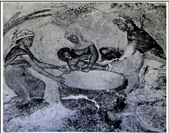
Natividad de la Virgen, fresco, fines s. XIII, Iglesia de Gradac, Dalmacia, Croacia, Detalle del baño

Plenos de simbolismo resultan asimismo la pila o cubeta en la que lavan a la neonata y el acto mismo de la ablución. No pocos comentaristas, en efecto, ven en tales elementos un símbolo del bautismo, como sacramento purificador del pecado original, razón por la cual la mayoría de esas cubetas o bañeras tienen en los cuadros analizados forma de pila bautismal (Menologio de Basilio II, Dafni, Kiev, Nerezi, Sopoçani, Karije Djami). Asimismo –y esta nuestra interpretación no anula la anterior, sino que la completa y perfecciona— otros expertos interpretan la pila con su agua purificadora como una analogía de Cristo, quien se autodefinió como el agua viva capaz de saciar de modo definitivo la sed del sediento, o incluso como un símbolo de la propia Virgen María, asumida como Fons Vitae , como el manantial puro y virginal del que brota el Agua de Vida (Jesucristo). Quizá eran esas mismas ideas las que el Damasceno intuía al comparar a la Virgen María con el “Pórtico de las Ovejas”, es decir, la Puerta adyacente a la Piscina Probática en Jerusalén, donde se lavaban las ovejas antes de ser sacrificadas