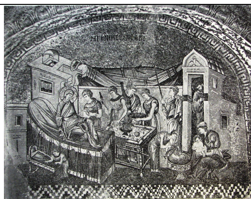
Natividad de la Virgen, mosaico, 1320-1321, Monasterio de San Salvador de Chora (Kariye Djami), Estambul

La escenografía suele estar constituida por el interior de una casa señorial, casi siempre puntuada por elementos arquitectónicos de relativo lustre. Los accesorios exhiben cierto lujo, apreciable en el espléndido mobiliario, ricos cortinajes, lecho suntuoso con ropa de cama bordada o recamada, bandejas con vituallas y bebidas que portan las criadas, una pila o cubeta donde lavan a la neonata, y, en ocasiones, una preciosa cuna, vacía o ya ocupada por la recién nacida.