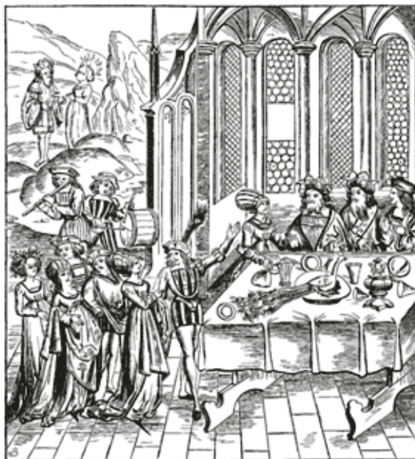
Escena convivial en una edición de Virgilio publicada en Lyon (Francia) en 1517.

regalos. Seguidamente, se narra la entrada en la cámara nupcial. Ello da pie a Ausonio a justificar un cambio de tono, ahora más picante, en honor a la antigua tradición de los fescennina . Termina el centón con una nueva justificación de Ausonio por el tono lascivo del poema, o cuanto menos, por su última sección.