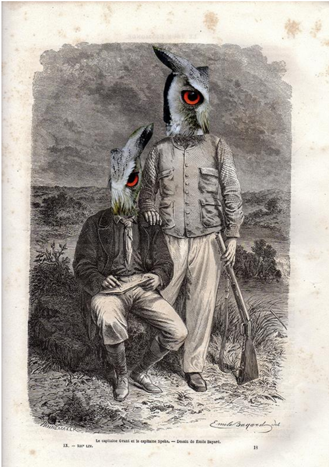
Le capitaine Grant et le capitaine Speke. — Dessin de Emile Bayard.