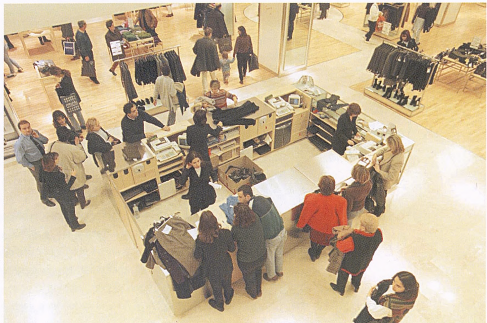
Actividad en un centro comercial de Alicante.

Ciudad y comercio son hechos ligados desde su origen: ambos suponen un desarrollo de la división del trabajo y, en verdad, sociológicamente, la génesis de la ciudad se remite a su definición como plaza de mercado permanente. Apenas sí podríamos comprender la historia de las grandes ciudades y la dinámica urbana actual ignorando su interdependencia. La actividad comercial en todas sus gamas, localizaciones y tipologías, responde a las necesidades y aspiraciones de la sociedad urbana al tiempo que la impulsa. Tanto más cierto en la actualidad en virtud de la mundialización de la nueva economía, la penetración de capitales externos para diversificar riesgos e inversiones. Además, la competencia internacional entre ciudades para captar inversiones ha llevado a conformar políticas urbanas de potenciación del terciario y cuaternario. El sueño de un gobernante cualquiera pasa hoy por un plan estratégico, grandes centros comerciales, un parque temático, un palacio de congresos y hoteles llenos. Más turistas y consumidores que ciudadanos.