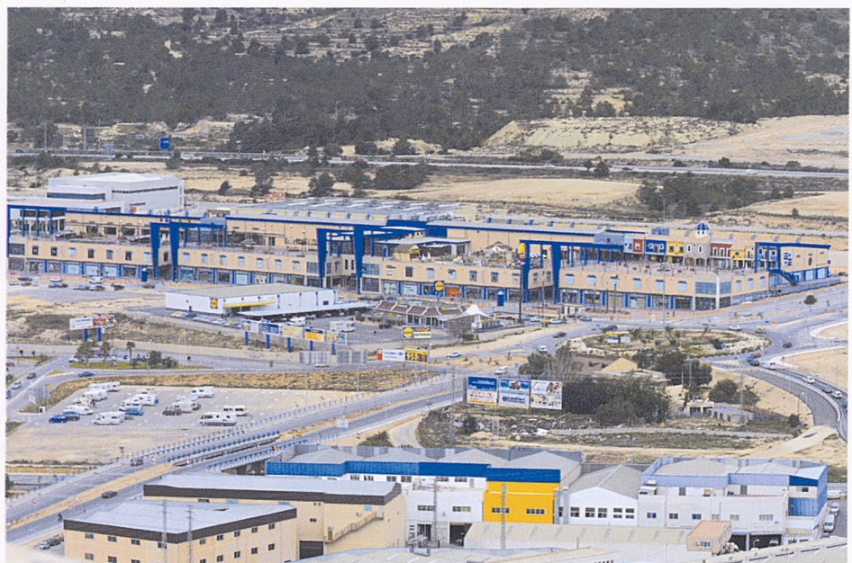
Nuevas dinámicas sociales y urbanas, nuevas estrategias comerciales.

Hacer del establecimiento una estancia donde el mirar y el paseo fueran posibles como actos previos a la adquisición de bienes simbólicos (Bourdieu) o mercancías-signos (Baudrillard) —comprar siempre es algo más— fue uno de los objetivos más claros de todos los grandes almacenes. Así, Macy's, Sears, Wanamaker, Le Coin du Rue, Au Bon Marché y otros tantos experimentaron