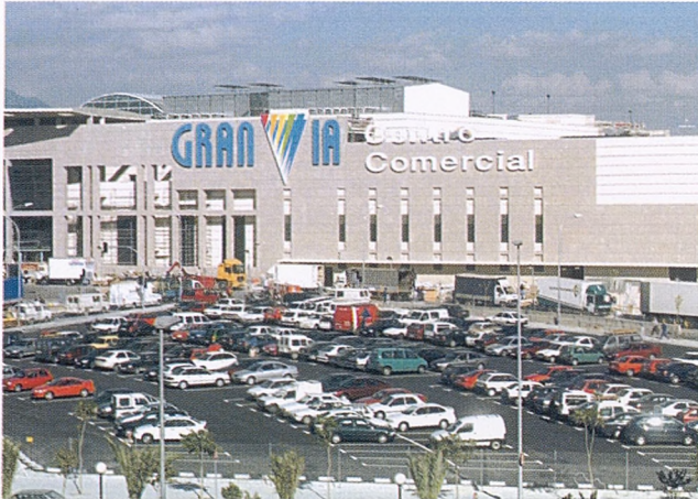
El mall periférico se postula como nueva ágora que alivia la carencia de equipamientos comerciales y ofrece un lugar para el encuentro social.

itectura de hierro y cristal pasando por el interiorismo) iban a facilitar la conversión del cliente en consumidor y una estrategia de mayor alcance por parte de los modernos magasins de nouveautés con objeto de seducir al visitante accidental.