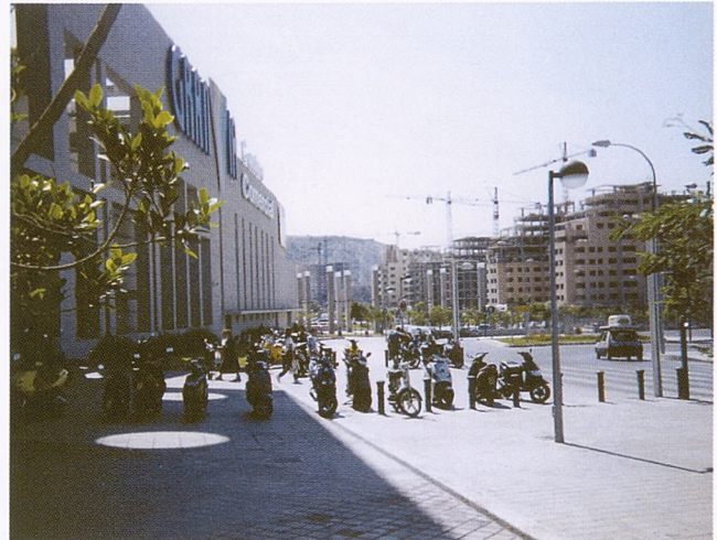
Crea en torno suyo a la aglomeración, surge en medio de la nada y se adelanta a la población.

Se trata, en consecuencia, de una operación más compleja de doble inversión: inversión en el orden urbano (el suelo como mercancía en definitiva) e inversión del orden urbano (de la ciudad como urbs et civitas , referencia real, historia y cultura). En el primer caso porque lejos de ser únicamente un desarrollo de la actividad comercial, el mall es una excrecencia del capital inmobiliario. Las grandes agencias (Vallehermoso, Urbis, etc.), privadas o mixtas, ligadas al poder financiero o al político, se sirven de estos equipamientos para dinamizar y revalorizar determinados sectores urbanos. Así van los PAUs del norte de Madrid o el sector Parque Avenidas de Alicante, en la Gran Vía. Todo en un paquete cuyo núcleo es el gran centro comercial y lúdico integrado. No hay que sorprenderse ante el hecho de que, por un lado, el paisaje en torno a él sea en la actualidad un conjunto de edificios en construcción, grúas pluma, terraplenados y un viario de vocación desconocida —pues no se sabe aún si de circulación o de poblamiento—; por otro, de que dentro del mall se vendan pisos y se financien créditos (ante lo que cabe preguntarse: ¿es la vivienda un error del consumidor compulsivo? ¿Es acaso un bien de inversión del consumidor perfecto o un capricho simbólico del consumidor imperfecto?).