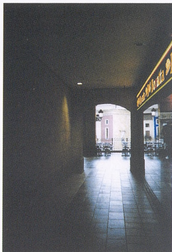
Especulación y juego especular, de referencias cruzadas, antojadizas, muy propio de la fragmentación postmoderna.