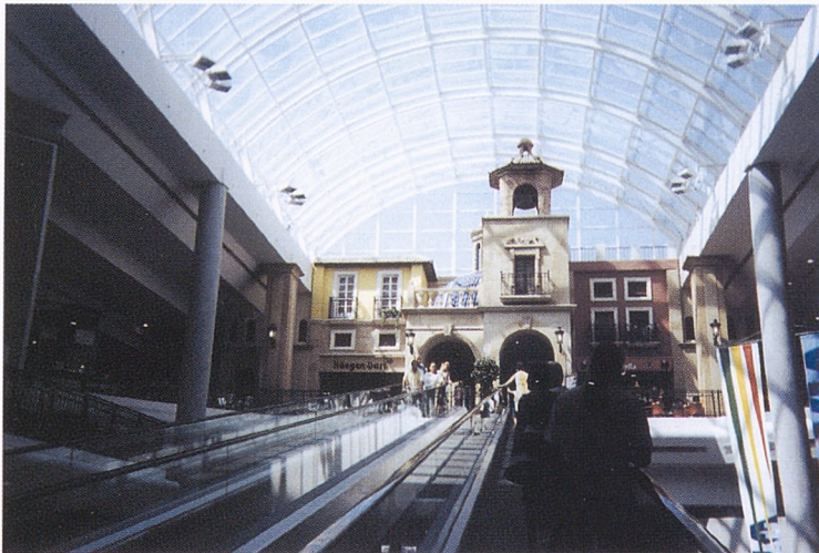
En las alturas, pero en pequeño, se remeda el centro que ya no lo es, el área estigmatizada y abandonada que encierra aún buena parte de la memoria del lugar.....

En segundo término hemos de considerar las consecuencias de la adopción de un modelo de crecimiento urbano difuso, en extensión, preferentemente con tipologías unifamiliares —bien aisladas, bien agrupadas en adosados—. El planeamiento urbano ha dado por bueno este crecimiento en saltos que resulta enormemente despilfarrador de tiempo, suelo, recursos naturales, costosas infraestructuras y requerimientos energéticos. Las últimas medidas de liberalización de suelo, que hasta la fecha se han mostrado por completo inútiles para reducir los precios inmobiliarios pero que han incrementado el campo de juego de su especulación, pueden llevar a medio y largo plazo a dañar más al comercio tradicional que la liberalización de los horarios. El modelo urbano en extensión se adorna en términos urbanísticos de un culturalismo importado y de un naturalismo grosero, como vulgar es la emulación del modo de vida que implica, pero sólo es comprensible a partir de la zonificación funcionalista.