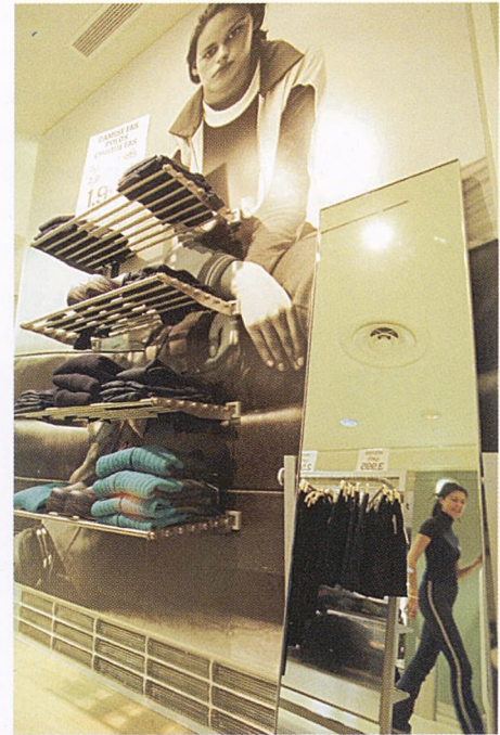
Rebajas en un centro comercial.

con la oferta de servicios complementarios (restaurantes, exposiciones de arte, salas de lectura, escritorios, etc.) que añadiesen minutos de permanencia en el lugar y lo convirtieran gradualmente en cita obligada. No obstante era preciso ir más allá. A la provisión de un espacio relacional se añadió el tratamiento de su decorado de tal modo que la retórica del lugar acompañase y potenciara la retórica de la mercancía, sustancialmente escasa por su producción industrial pero formalmente reconstruida y ampliada también mediante la naciente publicidad. Resultó esencial la puesta en escena, la manipulación del ambiente, recreando paisajes urbanos, para fomentar las prácticas deseadas. La compra quedaba así mediada por la simulación de una experiencia urbana y estética agradable. El sensualismo primitivo había proporcionado las claves para componer el envoltorio en que hacer coincidir las masas homogéneas de los objetos y sujetos de consumo. Las calles-galería, los pasajes de la burguesía decimonónica eran el ejemplo a seguir, pues habían sido el hogar del flâneur , del burgués vagabundo y observador, y concentraban la experiencia urbana cosmopolita, el baile de máscaras en que consiste aún hoy la vida social en la gran ciudad. Espectáculo y simulación.