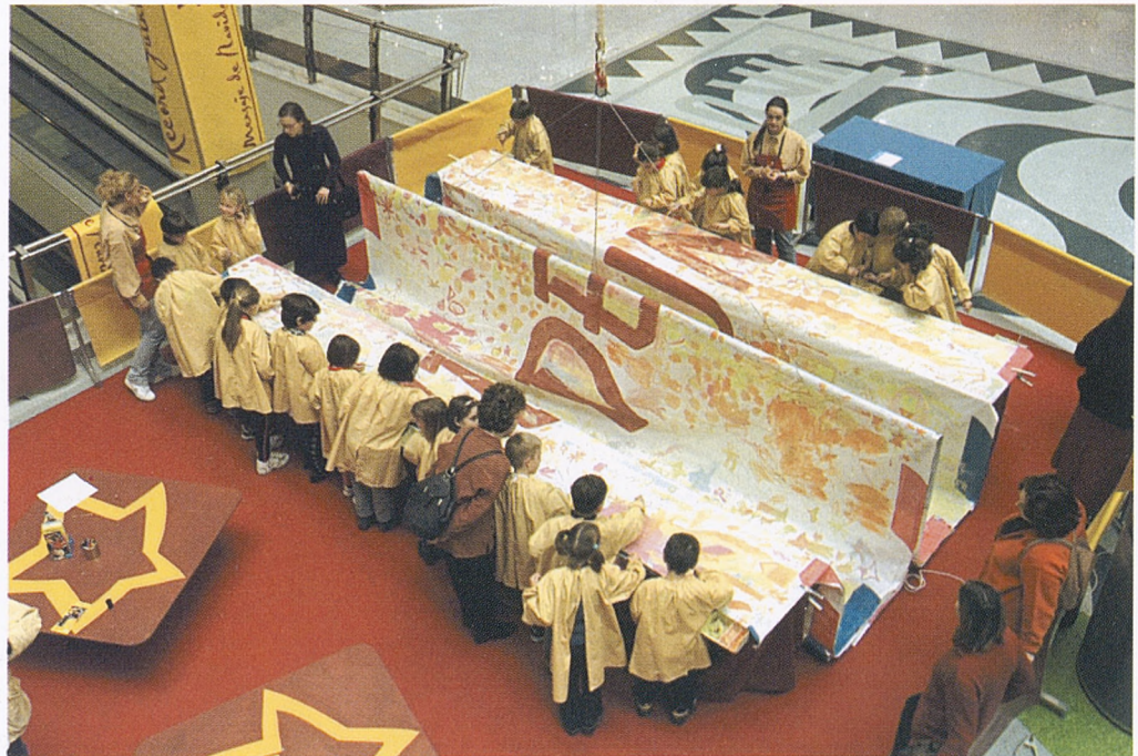
Niños jugando en un centro comercial.