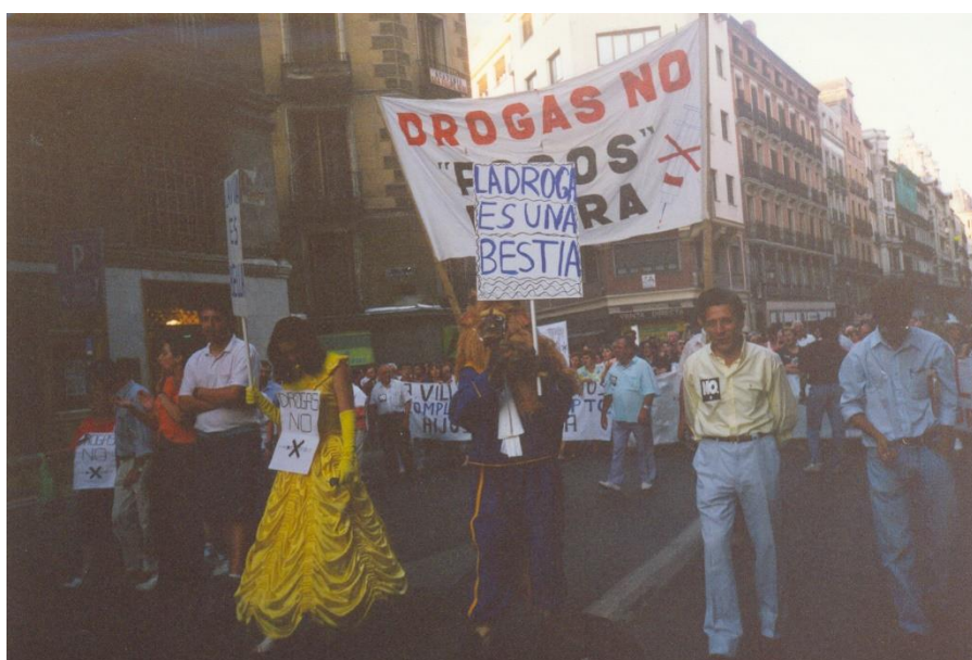
Ilustración 4: Manifestación solicitando el desalojo del asentamiento de Los Focos en San Blas. Años 90.

En el caso ya abordado de las movilizaciones sociales que tuvieron lugar en San Blas tanto en 1989 como en 1996 y 1997, los objetivos reformistas que perseguían y las tácticas no institucionales que emplearon fueron indispensables para que los medios de comunicación prestaran atención a las acciones llevadas a cabo. Entre ellas, destacan las manifestaciones que se organizaron en el propio barrio para pedir los desalojos de los poblados de Los Focos y Los Módulos. El recorrido de estas marchas, que normalmente se repetían durante varios días a la semana, solía terminar, si las condiciones lo permitían en los alrededores de los asentamientos en los que se denunciaba la compraventa de droga. Bajo el lema “DROGAS NO, «FOCOS» FUERA” y una representación dramatizada en la que, si la vida es Bella, la droga actúa como Bestia.