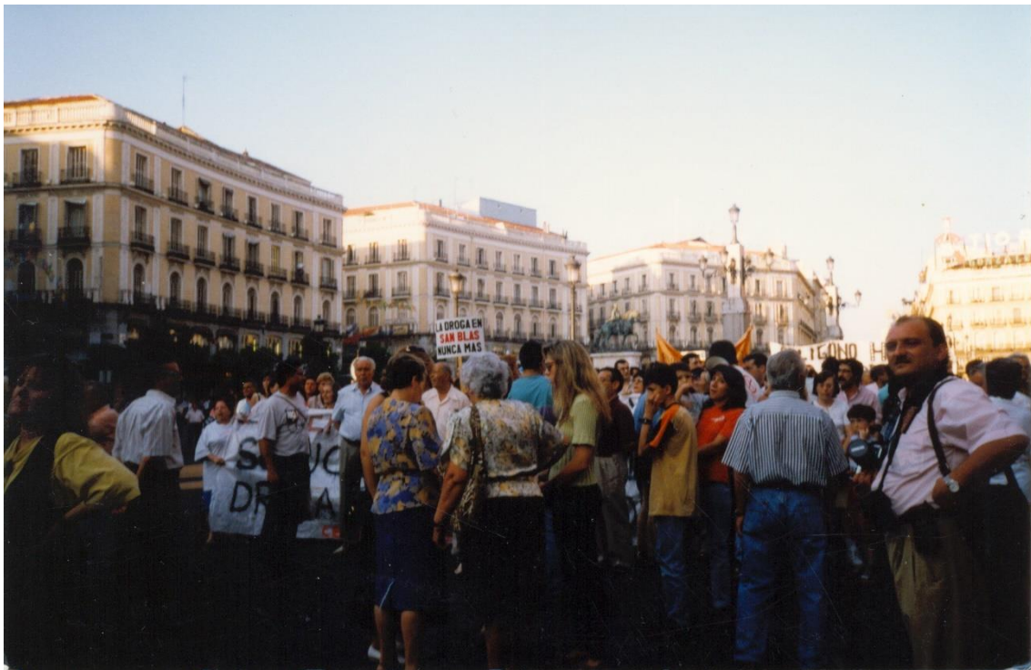
Ilustración 101. Manifestación contra la droga en la Puerta del Sol.