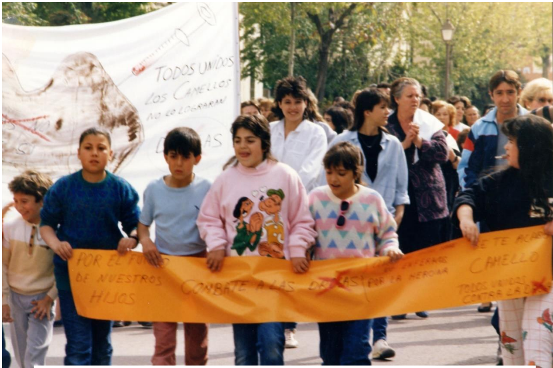
Ilustración 10. Manifestación contra la droga en San Fermín.