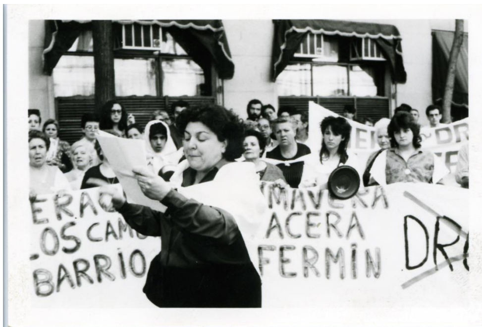
Ilustración 6. Manifestación de Madres Unidas contra la Droga en San Fermín