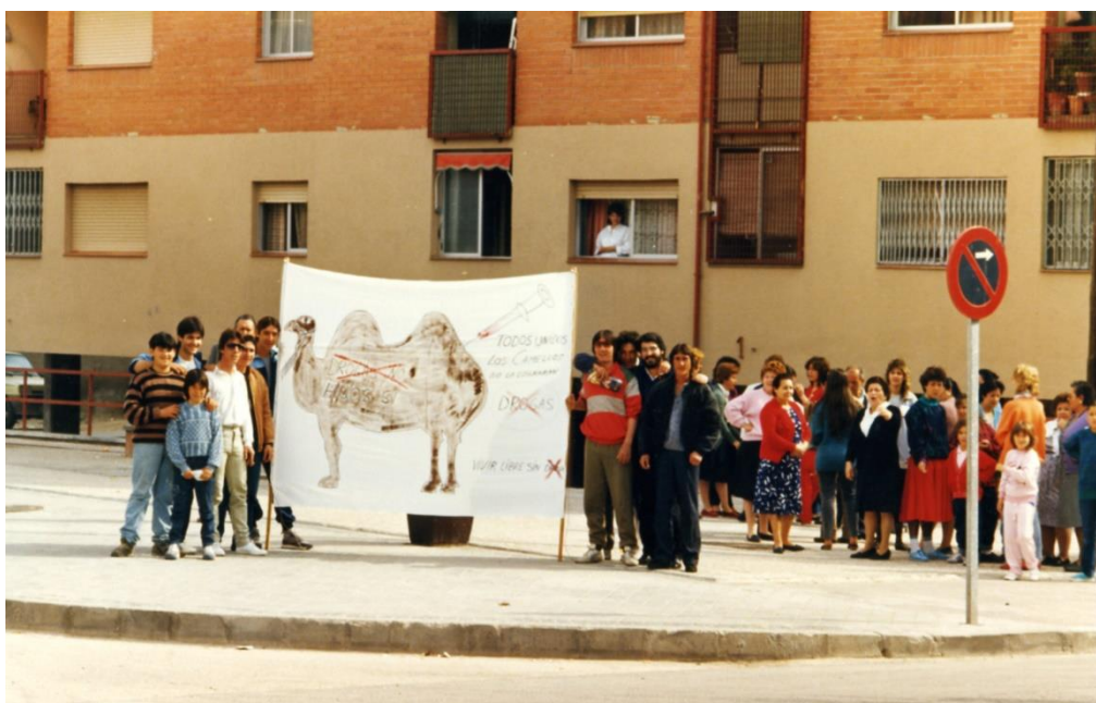
Ilustración 9. Manifestación contra la droga en San Fermín.