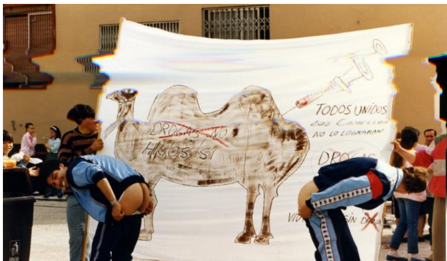
Ilustración 1: Manifestación contra los camellos en San Fermín. Años 80.

Como en todos los movimientos sociales, en la trayectoria vital de la organización fue fundamental el desarrollo que tuvo la definición de injusticia por parte de sus activistas. Ellas mismas fueron conscientes del cambio en su concepción del problema de la droga que pasó de estar centrada en el dolor por la pérdida de los jóvenes en los barrios de la periferia de Madrid, culpando a los camellos, para incorporar a la agenda de este colectivo nuevas preocupaciones. Convocadas como madres en un primer momento, asumieron el papel que los roles de género tradicionales asociaban a su condición: la responsabilidad sobre los hijos, el cuidado del hogar y la unidad de la familia. Fueron en la mayoría de los casos las mujeres quienes, desde un primer momento, se hicieron cargo de las labores asistenciales que tener un hijo drogodependiente conllevaba. Como ocurrió en el caso de ASPAFADES, estos grupos terminaron convirtiéndose, además, en una vía de escape para la situación familiar que muchas de estas mujeres aguantaban 135 . Así pues, se podría afirmar que, inicialmente, estas mujeres se movilizaron por la existencia de una “conciencia femenina”, es decir, por la creencia en una serie de valores atribuidos al rol