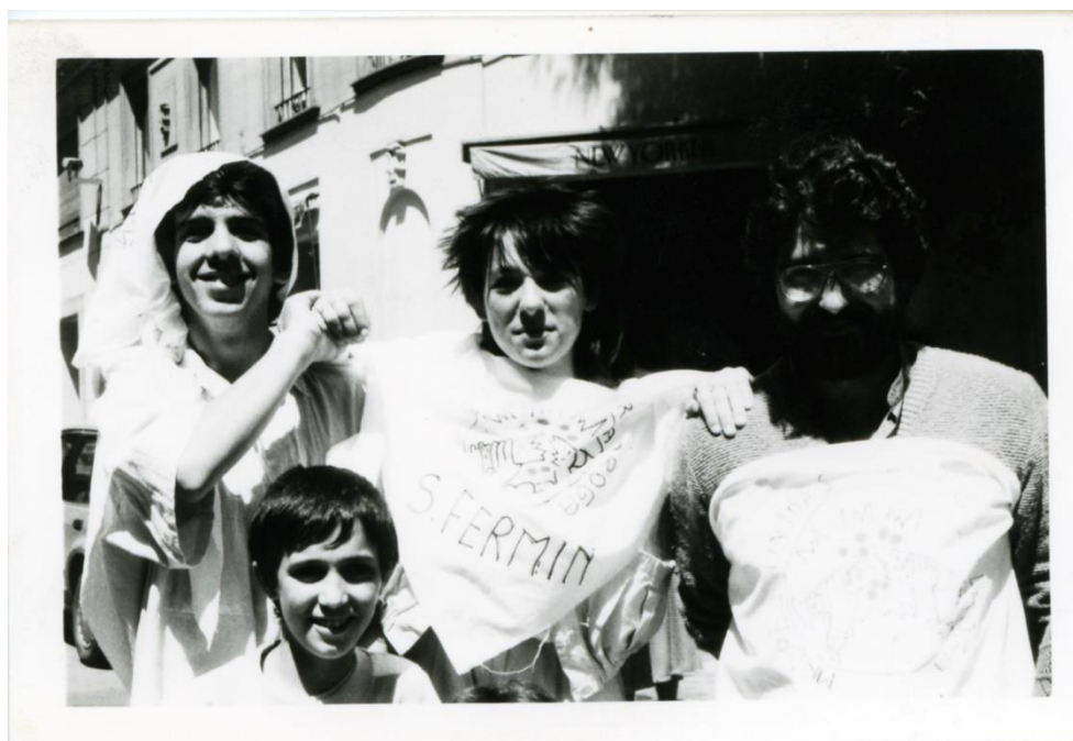
Ilustración 7. Manifestación de Madres Unidas contra la Droga en San Fermín