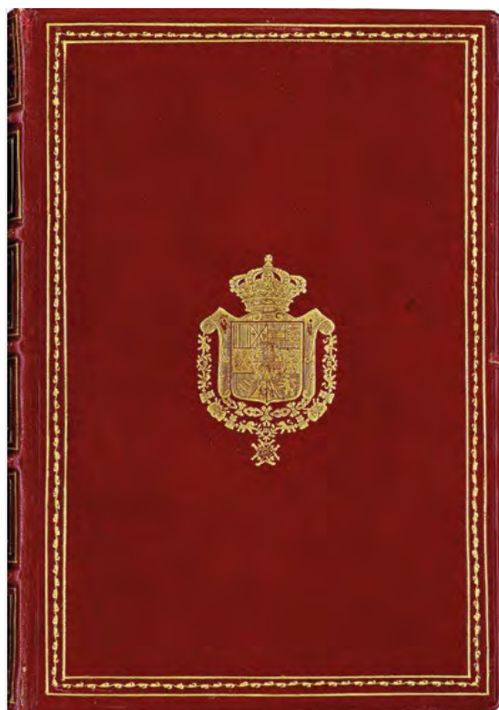
12. Pharmacopoeia matritensis. Regii, ac Supremi Hispaniarum Protomedicatus auctoritate, jussu atque auspiciis. Nunc primùm elaborata. Matriti: e Typographia Regia D. Michaelis Rodriguez, 1739. [36], 483, [1] p., [1] h.; 27 x 26 cm. Biblioteca RANF, MA 1740

sin duda favorables a los intereses de los boticarios madrileños, pero excesivamente arriesgados desde un aspecto económico. El Protomedicato exigió al Real Colegio la construcción del laboratorio químico previsto en sus Estatutos fundacionales; a cambio permitió la impresión de la nueva Pharmacopoeia Matritensis... y comprometió la promulgación de un Real Decreto por el que se impidiese la venta de medicamentos simples al por menor en