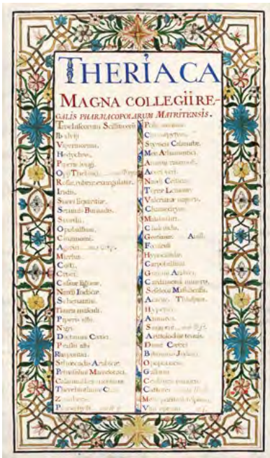
04. Theriaca Magna . [Madrid, s. xviii]. 1 h, 44 x 35,5 cm. Biblioteca RANF, MA 233

vezes acontece) nasce venus, jupiter, o mercurio, no puede engendrarse suavidad o fuerza de resuscitar los hombres mayor que la de questo liquor divino...” (Plinio vide Hernández, [c. 1568], fol. 268 r.)