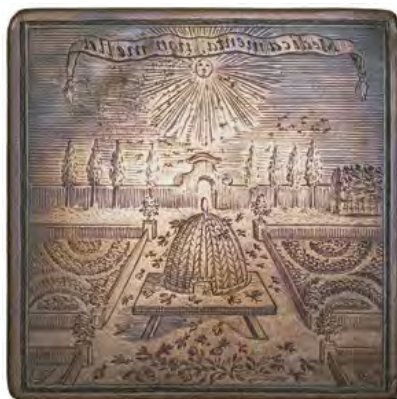
03. Sello del Real Colegio de Profesores Boticarios de Madrid. Plancha de cobre. 7 x 7 cm. Biblioteca RANF, MA 333

Los Estatutos... normalizan una estructura ya existente, que había permanecido larvada durante décadas, y que ahora se desarrolla al calor de las luces ilustradas; los propios boticarios reconocen la existencia de su corporación gremial, aun cuando esta no tenga cobertura legal hasta la proclamación de septiembre de 1737 a la que acabamos de referirnos. El Real Colegio de Profesores Boticarios de Madrid no nace ex novo ; es la estructura resultante