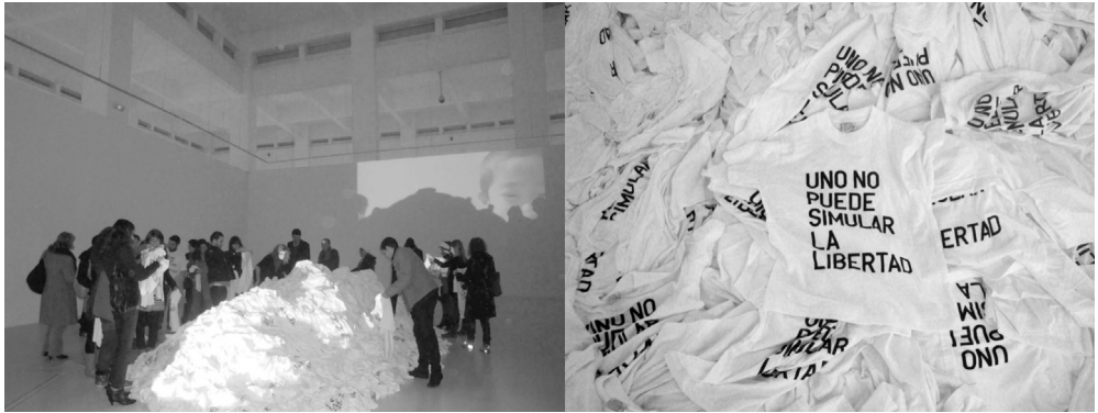
Figura 2. Rirkrit Tiravanija, Una larga marcha . Instalación en CAC Málaga 2009.