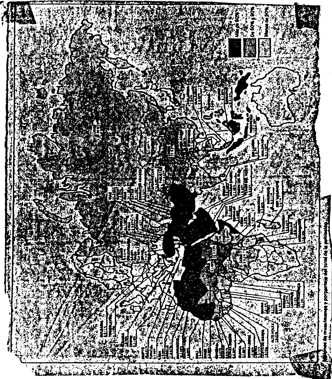
Mapas de musulmanes y porfiristas del total de la población.