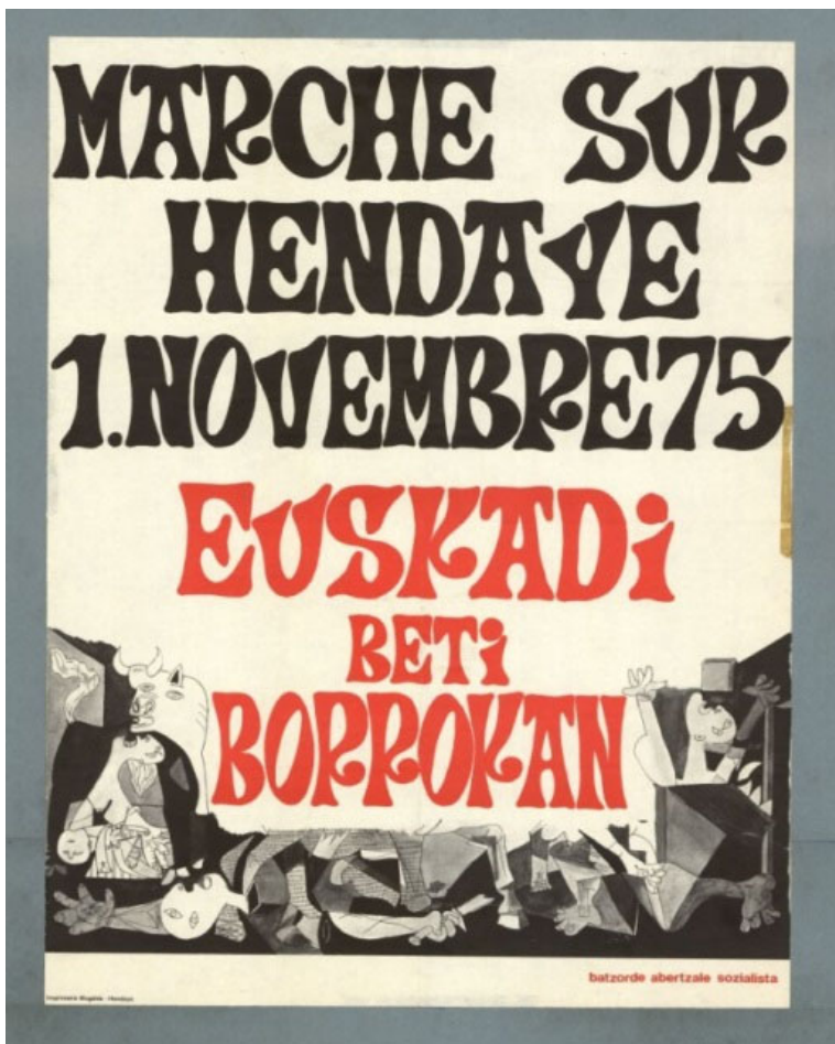
Figura 3 “Marche sur Hendaye”, Steef Davidson, 1975.

interpretación, que podría tener un regusto oficialista, de la gran obra de Picasso” (1981: 3), la publicación del Ministerio venía a purgar en sus páginas la deuda con el truncado y problemático pasado republicano.