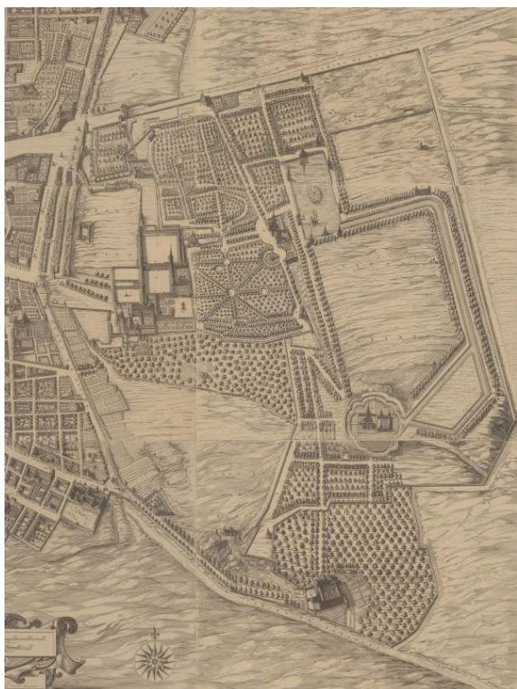
Pedro TEIXEIRA, Topographia de la Villa de Madrid , 1656, grabado, 180 x 285 cm en h. de 45 x 285 cm, pleg. en 56 x 39 cm, Anterpiæ, Ioannis et Iacobi van Veerle (detalle con el palacio del Buen Retiro).