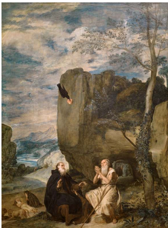
Diego VELÁZQUEZ, San Antonio Abad y san Pablo, primer ermitaño , ca. 1633-34, óleo sobre lienzo, 261 x 192,5 cm, Museo Nacional del Prado, Madrid.