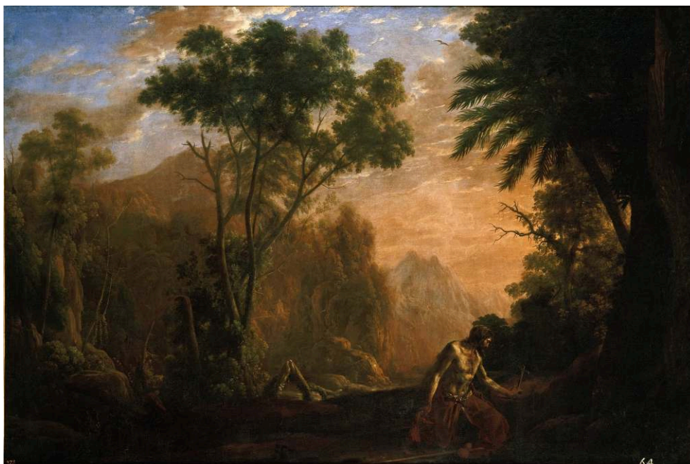
Claudio de LORENA, Paisaje con san Onofre , ca. 1638, óleo sobre lienzo, 158 x 237,1 cm, Museo Nacional del Prado, Madrid.