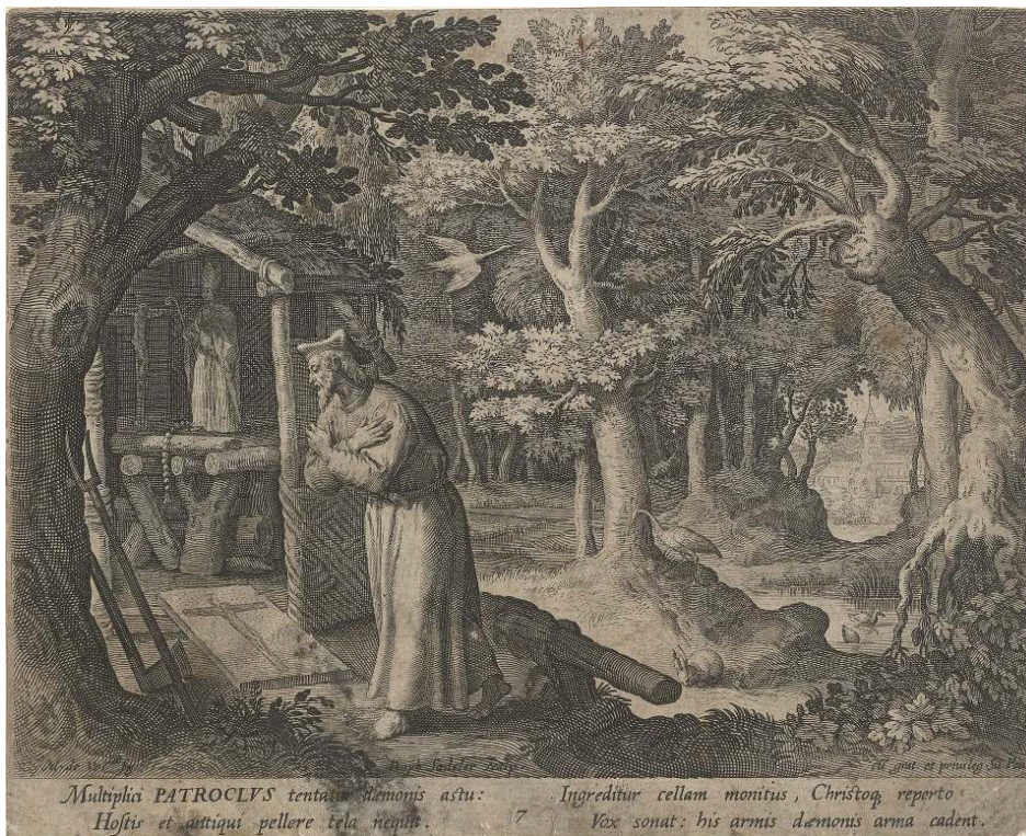
Raphael SADELER, "San Patroclo", Trophaeum Vitae Solitariae , 1598, grabado.