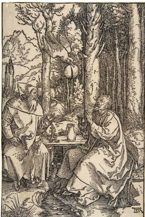
Alberto DURERO, San Antonio Abad y san Pablo ermitaño , 1504, xilografía a fibra, 214 x 144 mm, Biblioteca Nacional de España, Madrid.