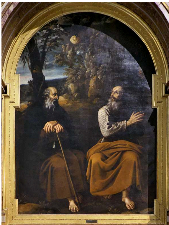
Juan van DER HAMEN (atr.), San Antonio Abad y san Pablo ermitaño , 1625, óleo sobre lienzo, 340 x 243 cm, Catedral de Burgos.