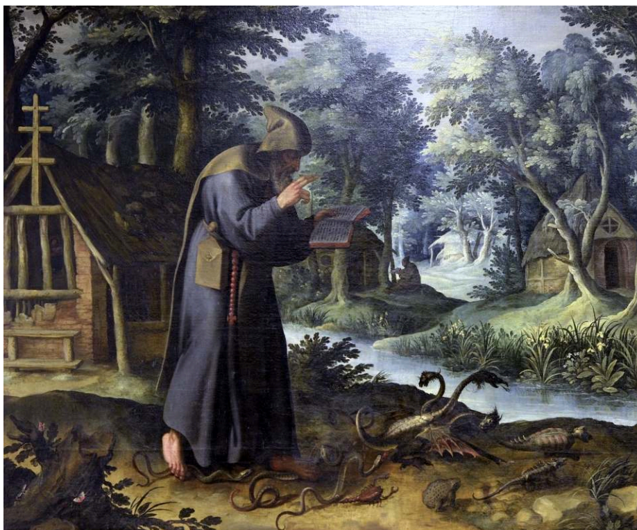
Paul BRIL (atr.), San Dídimo , ca. 1601-1611, óleo sobre lienzo, Convento de la Anunciada de Villafranca del Bierzo.