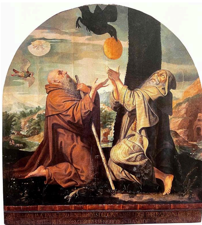
Pedro de CAMPAÑA, San Antonio Abad y san Pablo ermitaño , ca. 1545, óleo sobre tabla. 221 x 231 cm, Parroquia de San Isidoro, Sevilla.