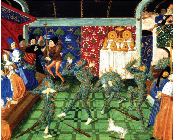
Fig. 4. “Baile de Salvajes”. Crónicas de Jean Froissart (c. 1470. British Library, Harley 4380, fol. 1r).

distribución de los estrados y la metamorfosis de la sala en un auditorio de representaciones teatrales, en este caso una danza de salvajes ardiendo ante Carlos VI (c. 1470. British Library, Harley 4380, fol. 1r) (Fig. 4). Todo con la música como marco de esparcimiento y los aparadores en pleno lucimiento de vajillas. Por último, apreciemos cómo conceptualmente esta dinámica pervive en las célebres ilustraciones alusivas a los regocijos con que María de Hungría homenajeó a su sobrino Felipe II en su palacio de Binche 32 .