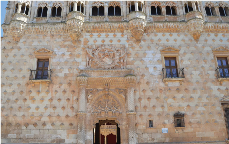
Fig. 2. Palacio del Infantado, Guadalajara.

A las circunstancias mencionadas, debemos añadir las deficiencias de las herramientas de análisis con las que contamos. Citemos un modelo significativo en ese sentido: las casas de la encomienda –auténticos palacios 10 – de la orden de Santiago. Gracias a los trabajos de Aurora Ruiz Mateos, basados en las descripciones periódicas contenidas en los llamados libros de visitas , se han podido levantar plantas, alzados e incluso axionometrías de edificios sensiblemente transformados. Así ocurre en el caso del palacio de Santos de Maimona (Badajoz), hoy convertido en ayuntamiento, o en el de Calzadilla de los Barros (Badajoz) donde la torre, único testigo de la otrora residencia comendataria, adquiere su plena dimensión al insertarse en un conjunto residencial de carácter representativo que visualizamos exclusivamente gracias a las fuentes documentales conservadas 11 . No obstante, estos documentos tienen sus pro-