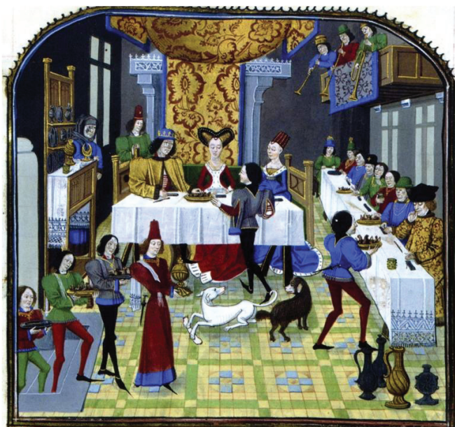
Fig. 7. “Banquete real” (BnF, Français 12574, fol 181v).

sencillas estructuras de madera que se presentaban cubiertas de tapicerías aunque, en ciertos casos, pudieron recibir decoración ornamental acomodada al gusto de la época.