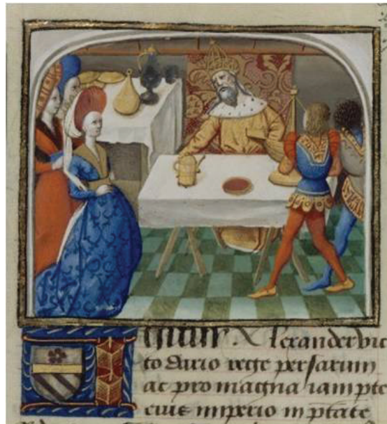
Fig. 6. “Alejandro y sus concubinas”. Mare Historiarum de Johannes de Columna (c. 1447-1455. BnF, Latin 4915, fol. 93v).

con la labor de “vnas coronas y... un cordón de seda blanca e negro” corroboran esta afirmación 46 .