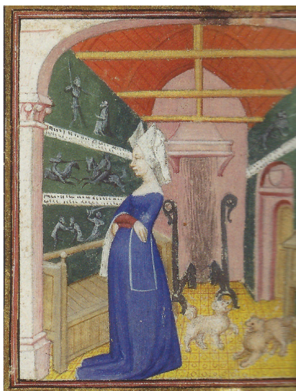
Fig. 1. “Cristina de Pizán observa la historia de una pintura mural”. El libre de Faits d’armes. Mutations de Fortune (c. 1410. BnF, Français 603, fol. 127v).

de carácter funcional y a la fortuna irregular de las familias propietarias causante, en muchos casos, de la dispersión y/o desaparición de su patrimonio mueble. Evocamos estas circunstancias genéricas en un ejemplo notable, el palacio del Infantado de Guadalajara, labrado en la segunda mitad del siglo XV por Juan Guas y ya intervenido en la centuria siguiente con la abertura de unos balcones-ventanas de frontones clásicos que, además de alterar la fisonomía del primitivo diseño 7 , ejemplarizan las diferentes interposiciones asumidas por la construcción tardo-gótica en su particular devenir temporal (Fig. 2). Tampoco podemos olvidar el bombardeo sufrido por Guadalajara el 6 de diciembre de 1936, durante la guerra civil española, causante de sensibles daños en la estructura palatina y la desaparición de las elogiadas techumbres policromas de sus habitaciones 8 . Tales circunstancias determinaron la nueva puesta en valor del edificio mediante una restauración no exenta de interrogantes, como constatamos al comparar su fisonomía actual con una antigua fotografía de 1879 9 .