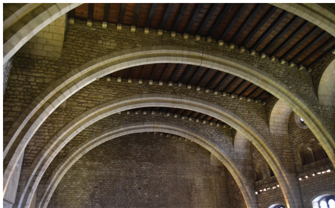
Fig. 12. Salon del Tinell, Barcelona.

“E todas estas tiendas que he dicho, de parte de dentro eran de carmesí e todas bordadas de la manera de los pabellones de las camas. Quando fueron dentro de aquella tienda vio un gran aparador puesto con mucha vaxilla de oro e de plata e muchas mesas aparejadas...” 97 .