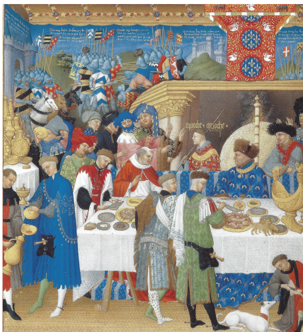
Fig. 3. “Mes de enero”. Muy Ricas Horas del duque de Berry , Hermanos Limbourg (c.1412-1416. Bibliothèque du Château de Chantilly, Ms. 65, fol. 1v).

Las miniaturas, asimismo, facilitan el seguimiento de ese discurso. En los relatos históricos e inclusive en textos de carácter devocional, no faltan escenas alusivas a la celebración de banquetes o al esparcimiento lúdico. Por citar imágenes suficientemente conocidas, anotemos los aguinaldos navideños del duque de Berry solemnizados en una sala entoldada con tapices alusivos a la guerra de Troya y aderezada con un soberbio aparador y la mesa con la vajilla más valiosa del noble (Hermanos Limbourg. “Mes de enero”, Muy Ricas Horas del duque de Berry , c.1412-1416. Bibliothèque du Château de Chantilly, Ms. 65, fol. 1v) (Fig. 3). Las Crónicas de Jean Froissart constatan el punto posterior de este rito: el alzado de las mesas, la nueva