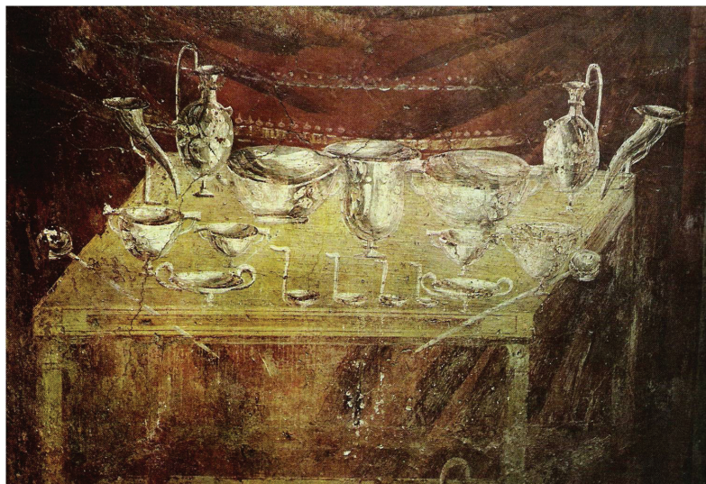
Fig. 10. “Cartibulum”. Tumba de Caius Vestorius Priscus (Pompeya).

regios 92 , el lujo de la vajilla y el barroquismo en su presentación, así como de la presencia de un magnífico expositor con las insignias regias llamado pentapyrgion 93