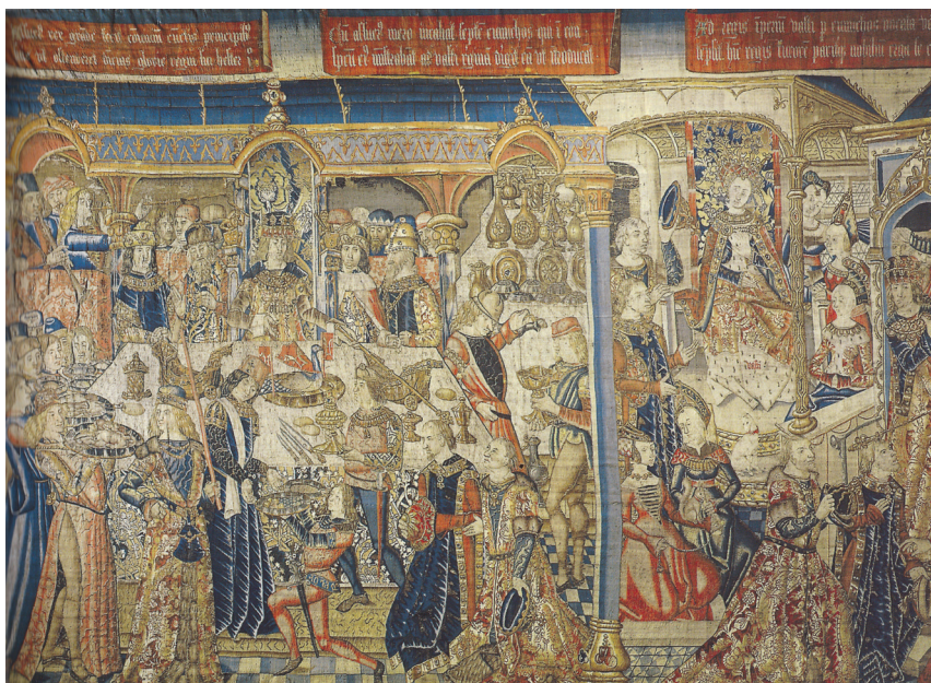
Fig. 9. “Banquete de Asuero”. Tapiz de la historia de Esther y Asuero (c. 1490. Museo de Tapices de la Seo, Zaragoza).

de Pedro García de Benabarre (c. 1470. Museo Nacional de Arte de Cataluña, Barcelona) con una soberbia exposición de vajilla dispuesta al fondo de la sala (Fig. 8).