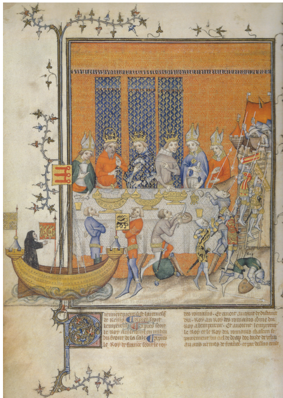
Fig. 5. “Banquete de Carlos V”. Grandes Crónicas de Francia (c. 1380. BnF, Français 2813, fol. 473 v).

Resulta difícil visualizar esas fábricas y, de momento, siempre acudimos a la miniatura de las Grandes Crónicas de Francia relativa al banquete de Carlos V donde augustos invitados –el emperador y Carlos V– contemplan un espectáculo sobre la primera cruzada, lo que da lugar a un curioso collage: la mesa del convite pospuesta a los iconos de una galera y una torre asediada como imágenes metonímicas de la llegada y conquista de Jerusalén ( Grandes Crónicas de Francia . c. 1380. BnF, Français 2813, fol. 473 v) (Fig. 5). Esperamos poder incorporar nuevas imágenes de esta carga evocativa que realcen el valor simbólico y escenográfico de los momos palatinos.