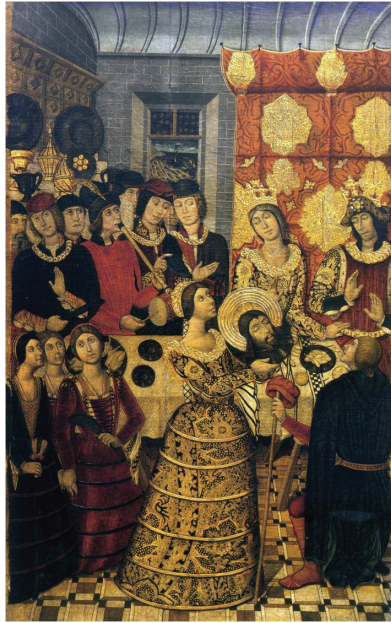
Fig. 8. Banquete de Herodes de Pedro García de Benabarre (c. 1470. Museo Nacional de Arte de Cataluña, Barcelona).

para hacer mayor ostentación. Esos aparadores, que estaban a la entrada de la sala, podían verlos todos los que estaban sentados en las mesas 49 .