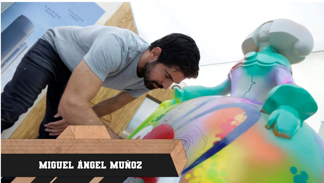
MIGUEL ÁNGEL MUÑOZ