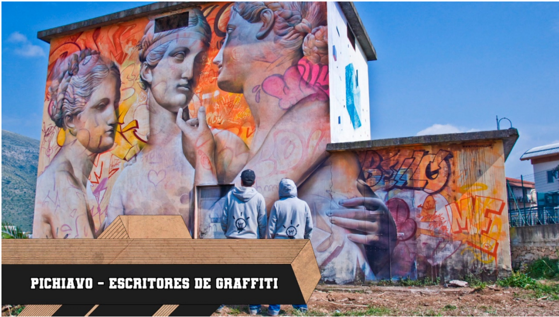
PICHIAVO - ESCRITORES DE GRAFFITI