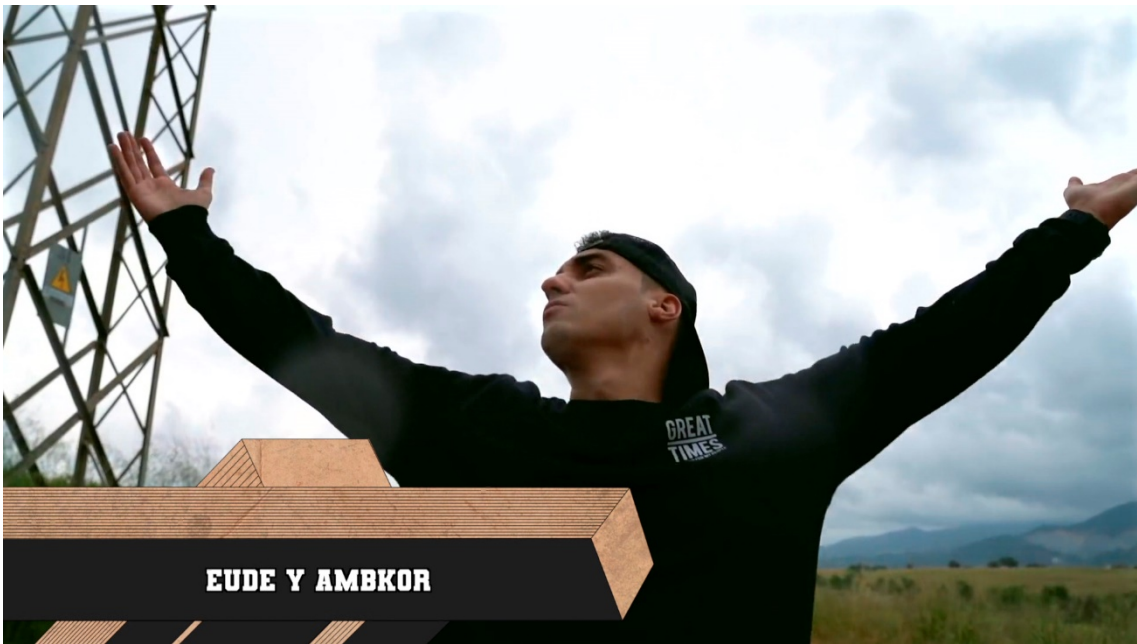
EUDE Y AMBKOR