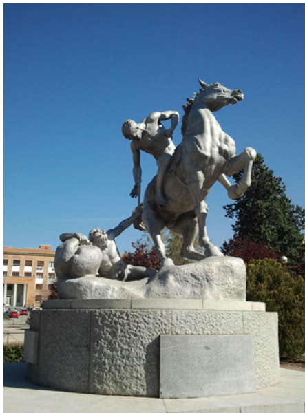
Figura 6. Aspecto final de la escultura.

Lo más adecuado para este proyecto hubiera sido terminarlo con la noticia de la colocación de la antorcha en su lugar; sin embargo, siete días después de haber fijado la antorcha a la escultura, ha sido arrancada y destrozada. Se prevé la realización de un nuevo vaciado en resina y se planteará si se coloca en su lugar o si, sencillamente, se reservará su reubicación para momentos de especial relevancia para la historia de la Universidad, con lo que podría plantearse que la antorcha fuera desmontable. Otra opción para este elemento podría ser realizar el vaciado en aluminio, ya que