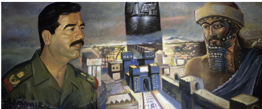
Fig. 4 Saddam Hussein y Hammurabi con la Puerta de Ishtar de fondo.

En Siria, la dinastía de los Asad también llevó a cabo un programa legitimador a través de la arqueología en los 70, aunque de diferente manera. Tanto Gillot 29 como Jones señalan que la identidad que buscaba construir el partido Baaz en Siria era ‘árabe y multicultural’, debido a la acusada fragmentación territorial y social característica del estado sirio. Las élites alauitas cercanas al poder sirio no usaron elementos étnicos o religiosos, sino símbolos de resistencia a poderes exteriores, especialmente reflejados en la figura de Zenobia. Zenobia de Palmira fue la mujer que encabezó la resistencia a la invasión romana, y se convirtió en el siglo XX en símbolo de resistencia colonial primero, y después de identidad nacional (Fig. 5). De la mano del partido Baaz este personaje pasó a representar la idea de la ‘Gran Siria’ (impulsada por el político libanés Antún Saade), una región territorial que comprendía Siria, Líbano, Iraq, Jordania y Palestina, y cuya defensa suponía un paso adelante en la búsqueda unidad Árabe. 30