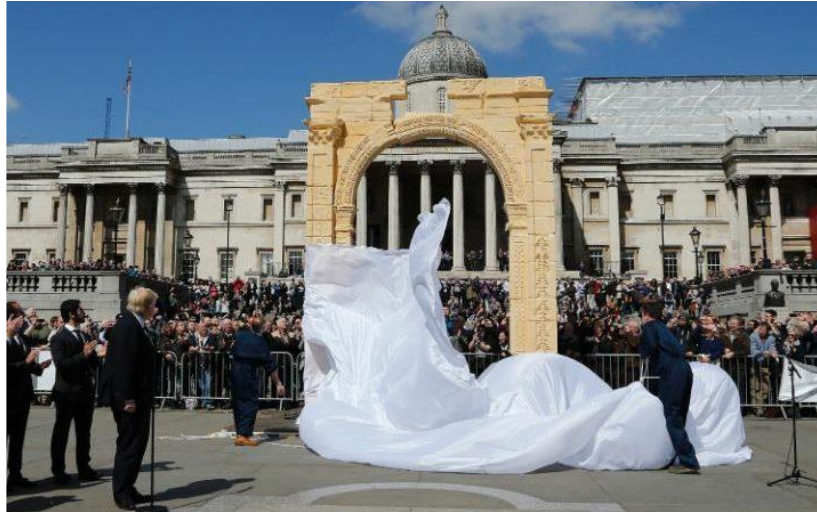
Fig. 9 Boris Johnson en la inauguración de la réplica del Arco del Triunfo de Palmira en la Plaza de Trafalgar en Londres.

Los planes de reconstrucción del patrimonio tras un conflicto, como argumentaremos más tarde, ofrecen una posibilidad para la transformación de las interpretaciones del patrimonio en favor de la construcción de nuevas narrativas políticas sobre la memoria nacional. 41 Es por esta razón que parece relevante señalar cómo el régimen de Bashar al-Asad, a medida que se aproximaba el fin del conflicto, iba adoptando ciertas posiciones con respecto a la reconstrucción, restauración o preservación del patrimonio.