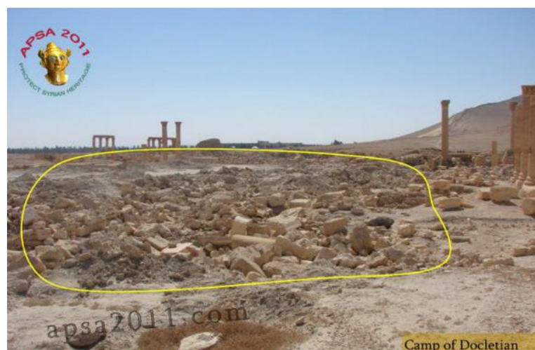
Fig. 2 Daños causados sobre material arqueológico por un buldozer en el área del campo de Diocleciano.

Estos ‘episodios’ nos pueden servir aquí para sintetizar los hechos. No obstante, debemos insistir en uno que no aparece en esta tabla, y que concierne al estado de la ciudad antes de la conocida llegada del ISIS en mayo de 2015. Tal y como ha sido señalado por los múltiples registros y análisis mencionados 9 el lugar había sufrido importantes daños antes del espectáculo destructivo de los extremistas. Concretamente, desde el 4 de febrero de 2012 hasta el 20 de mayo de 2015 se desplegaron estratégicamente unidades militares pertenecientes a la armada del régimen, tanto en la ciudad moderna de Tadmor como en la ciudad antigua. Para asegurar el control de la zona, estas unidades militares instalaron una serie de equipamientos que alteraron notoriamente el estado y estructura del lugar arqueológico (Fig.2) - construcción de carreteras, extracción de materiales arqueológicos, instalación de vehículos excavadores militares en área arqueológica o excavación de pequeñas trincheras, entre otros.