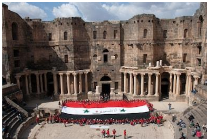
Fig. 6 y 7 A la izquierda, imagen de Bashar al Asad colgada sobre la parte central del teatro de Bosra. A la derecha, bandera de la Armada Libre Siria extendida a los pies del mismo lugar.