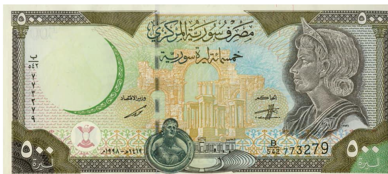
Fig. 5 Billeto de 500 libras sirias decorado con el busto de Zenobia y las ruinas de Palmira.

En Siria, la dinastía de los Asad también llevó a cabo un programa legitimador a través de la arqueología en los 70, aunque de diferente manera. Tanto Gillot 29 como Jones señalan que la identidad que buscaba construir el partido Baaz en Siria era ‘árabe y multicultural’, debido a la acusada fragmentación territorial y social característica del estado sirio. Las élites alauitas cercanas al poder sirio no usaron elementos étnicos o religiosos, sino símbolos de resistencia a poderes exteriores, especialmente reflejados en la figura de Zenobia. Zenobia de Palmira fue la mujer que encabezó la resistencia a la invasión romana, y se convirtió en el siglo XX en símbolo de resistencia colonial primero, y después de identidad nacional (Fig. 5). De la mano del partido Baaz este personaje pasó a representar la idea de la ‘Gran Siria’ (impulsada por el político libanés Antún Saade), una región territorial que comprendía Siria, Líbano, Iraq, Jordania y Palestina, y cuya defensa suponía un paso adelante en la búsqueda unidad Árabe. 30