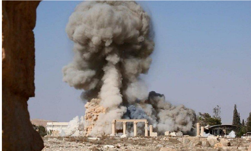
Fig. 3 Explosión del templo de Baalshamin.

Durante todo este tiempo, y a medida que los ataques del ISIS se multiplicaban en la zona, las tropas del régimen apoyadas por Rusia desplegaron fuerzas aéreas cuyos ataques propiciaron extensos daños materiales tanto en la ciudad antigua como en la moderna, afectando a la Ciudadela de Palmira, algunas partes del teatro romano, y numerosas mezquitas 15 . La ofensiva del régimen culminó en el mes de marzo de 2016 con la toma de la ciudad, que se produjo gracias a la coalición de las fuerzas militares rusas e iraníes. El 10 de marzo, el grupo de activistas locales ‘Palmyra Coordination’ emitió un mensaje en su página de Facebook en el que se llamaba la atención sobre el desastre que esta ofensiva aérea del régimen estaba causando en la ciudad moderna de Tadmor: la mayor parte de la infraestructura urbana –incluyendo áreas residenciales, hospitales, colegios y mezquitas 16 - fue destruida o altamente dañada en los primeros meses del año. Sólo quedaban, aproximadamente, 15 000 de los 50 000 habitantes de la ciudad.