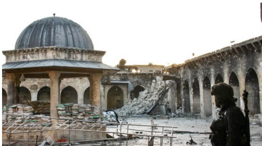
Fig. 11 El alminar de la Mezquita Omeya de Alepo derrumbado tras los ataques de 2013.

En 2014 David y Boissière 50 hicieron un breve análisis sobre las destrucciones que el patrimonio cultural alepino había sufrido en los dos años que entonces cumplía el conflicto en la ciudad. Dicho análisis partía de una revisión sobre el origen histórico y el valor del concepto de patrimonio en Siria, con el objetivo de “mieux comprendre les réactions parfois hostiles ou indifférents que l’on peut observer dans les deux camps, loyaliste et rebelle, vis à vis de ce patrimoine mondialement reconnu”. Creemos que este punto de vista es relevante, y nos puede ayudar a justificar la tesis mantenida en estas páginas: que tanto la destrucción como la reconstrucción del patrimonio cultural de un lugar a menudo están ligadas a un ideario político, económico y social, que es conveniente desentrañar desde una perspectiva crítica.