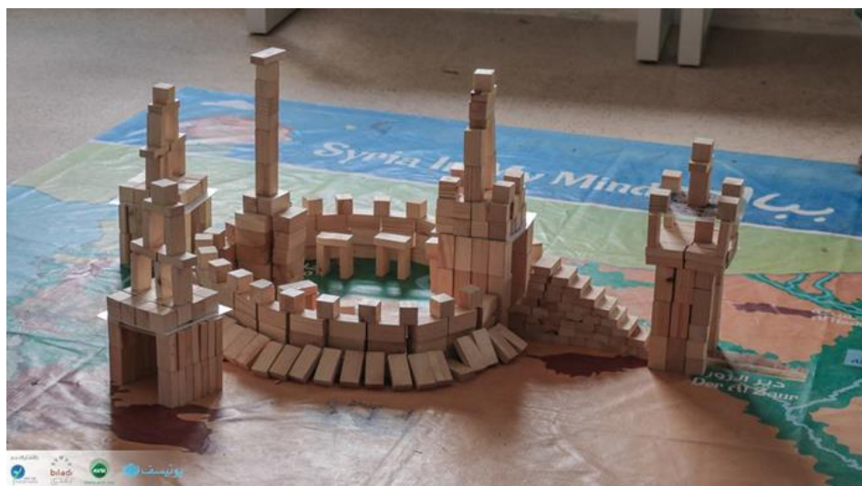
Fig. 12 Construcción con piezas de madera de la Ciudadela de Aleppo, en el contexto de las actividades para niños impulsadas por el proyecto ‘Syria in my mind’.

sede en Líbano, creado con el objetivo de familiarizar a los niños refugiados con nociones culturales de su país 63 (Fig. 12). En Berlín, el Museo de Pérgamo inició en 2016 un programa con esta misma ambición integrando a refugiados iraquíes y sirios como guías de las colecciones procedentes de Oriente Próximo. 64 A estas deberían sumarse las numerosas iniciativas de activistas y artistas contemporáneos, que desde diferentes rincones del mundo han colaborado en la preservación y re-significación de su patrimonio como parte del mantenimiento activo de su memoria.