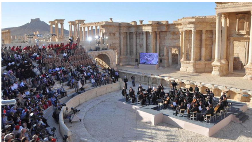
Fig. 8 Concierto de la ‘Oración por Palmira’ dirigido por Valeri Guérguiev en el anfiteatro de Palmira.

Otro de los indicios más claros de este proyecto propagandístico llegó en el mes de mayo, cuando se programó un concierto de música clásica dirigido por un célebre director de orquesta ruso junto con la proyección de un discurso del propio Vladimir Putin. La puesta en escena de este evento, en el teatro sobre el que habían sido degollados unos meses antes los prisioneros del ISIS (Fig. 8), no dejaba lugar a dudas sobre la intención del concierto: una reivindicación contra el enemigo sobre un espacio cargado de imágenes de violencia, ‘un tanto estratégico para mejorar su imagen internacional’ 37 . En cualquier caso, este espectáculo acabó siendo una provocación para los integrantes del ISIS, quienes dañaron notablemente el teatro romano durante su segunda ocupación de la ciudad en enero de 2017.