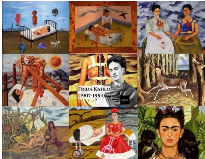
Fig. 2. Ejemplo de publicación relativo a una artista, Frida Kahlo (1907-1954).

Los resultados obtenidos hasta el momento son significativos tanto en la evolución de los contenidos como en la respuesta recibida de los estudiantes, así como de los seguidores obtenidos. El número total de movimientos publicados es de trece, siendo 61 el número de artistas incluidos, de los cuales se han publicado un total de 434 obras en 421 post. El número de seguidores a fecha de hoy es de 2966, una cifra que no dejará de aumentar, de seguir en la misma tendencia actual.