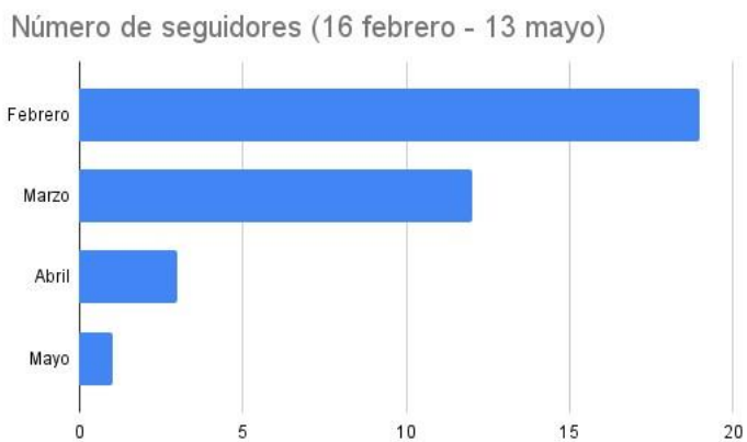
Fig. 4. Estadísticas (segundo semestre: 2024) del número de seguidores.