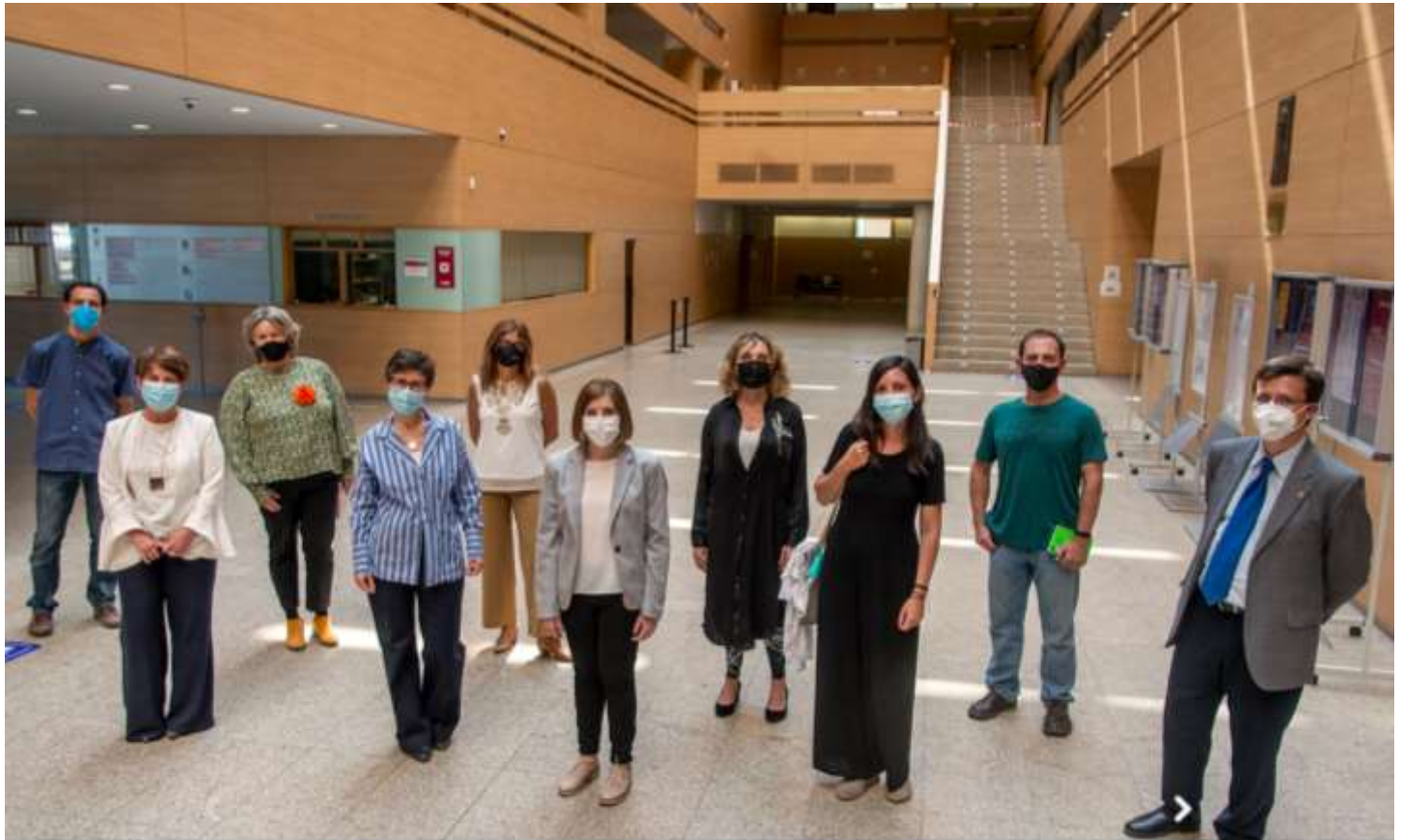
Autoridades de la UCM posan junto a los responsables de los ApS presentados en la jornada