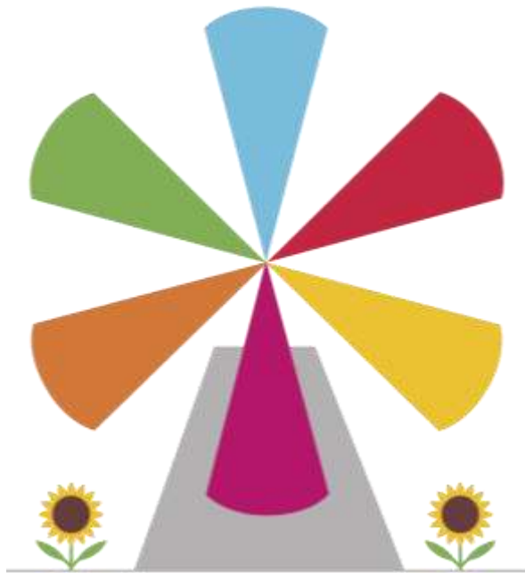
Figura 2 y 3

en diferentes salas de teatro, así como la colaboración de profesorado de la Facultad de Trabajo Social, y de profesionales.