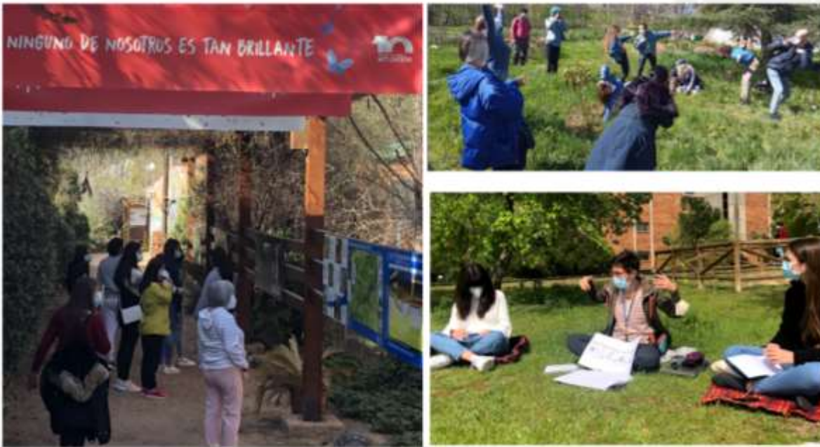
Figuras 5,6,7,8 y 9