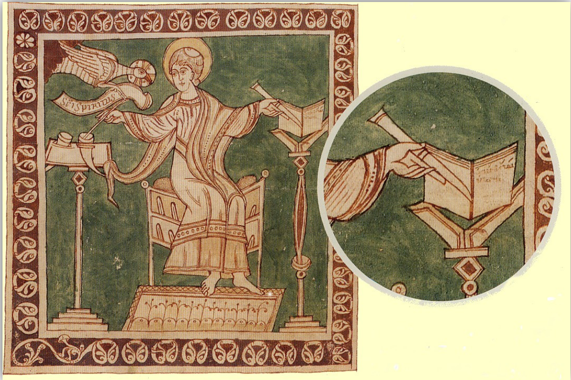
San Gregorio el Magno, siglo XII. Imagen para uso docente.

Anexo 6.1. Imagen utilizada para la “rutina de pensamiento” de la Actividad 1.