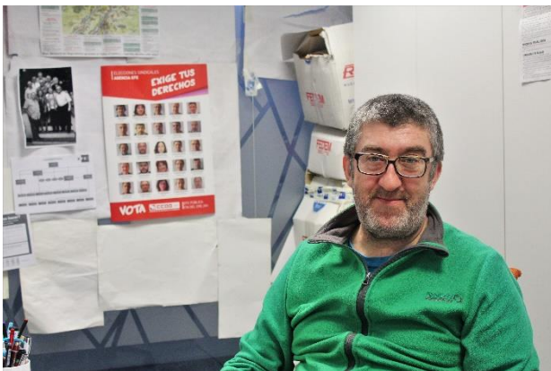
Secretario general de Comisiones Obreras: Yon Galocha