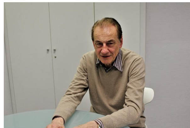
Director de Archivo, Documentación y Reportajes: Luis de León