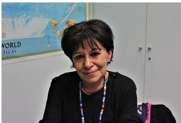
Directora de Gráfica: Esther Borrell