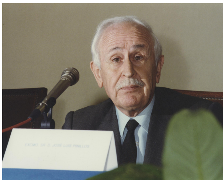
BH AP 17-128