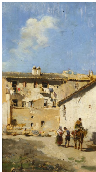
Fig. 7. Darío de Regoyos. Puerta del Sol , 1894. Colección particular, Madrid