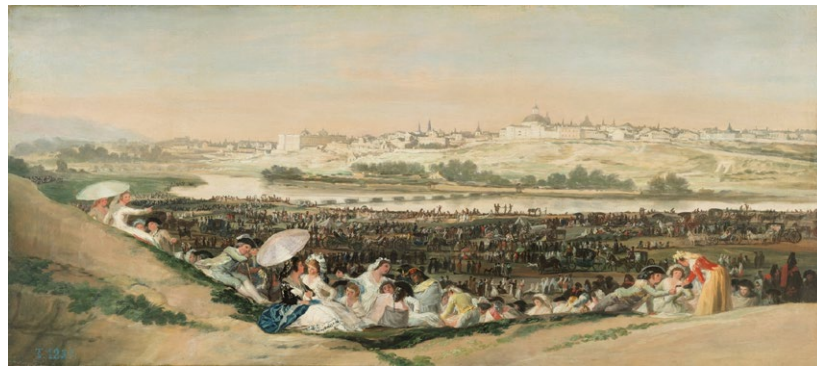
Fig. 6. Joaquín Sorolla. Caserío de los barrios bajos , 1883. Museo de la Ciudad de Madrid