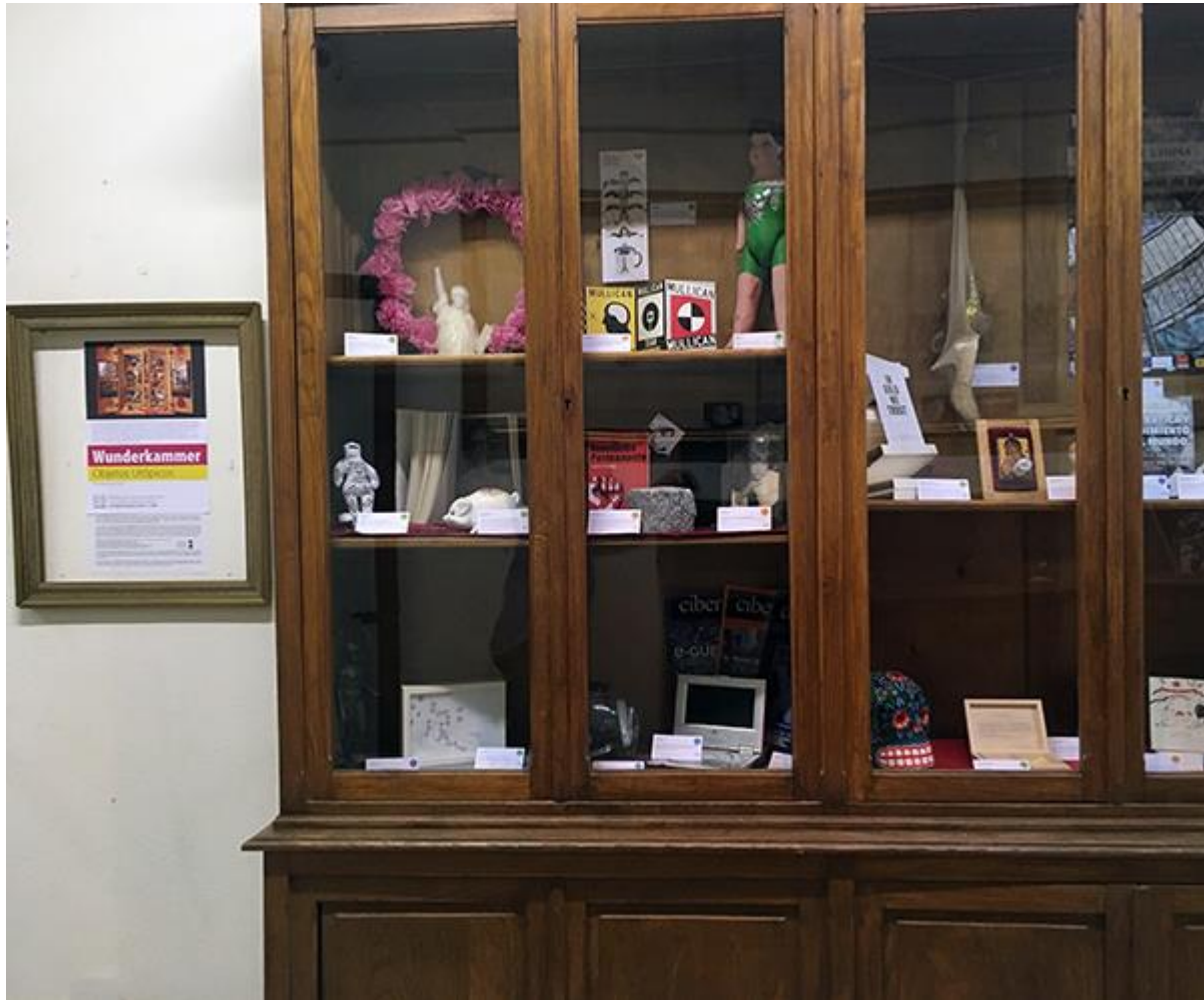
Vista general y Cartel de la Intervención, con presentación e información. La exposición está formada por más de cien objetos y ha participado más de 37 artistas de España y Latinoamérica.