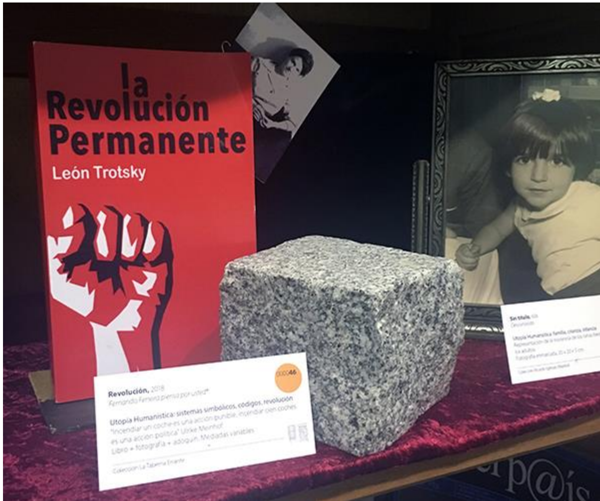
Detalle de la pieza "Revolución" de Fernando Ferreira piensa por usted® (Madrid).