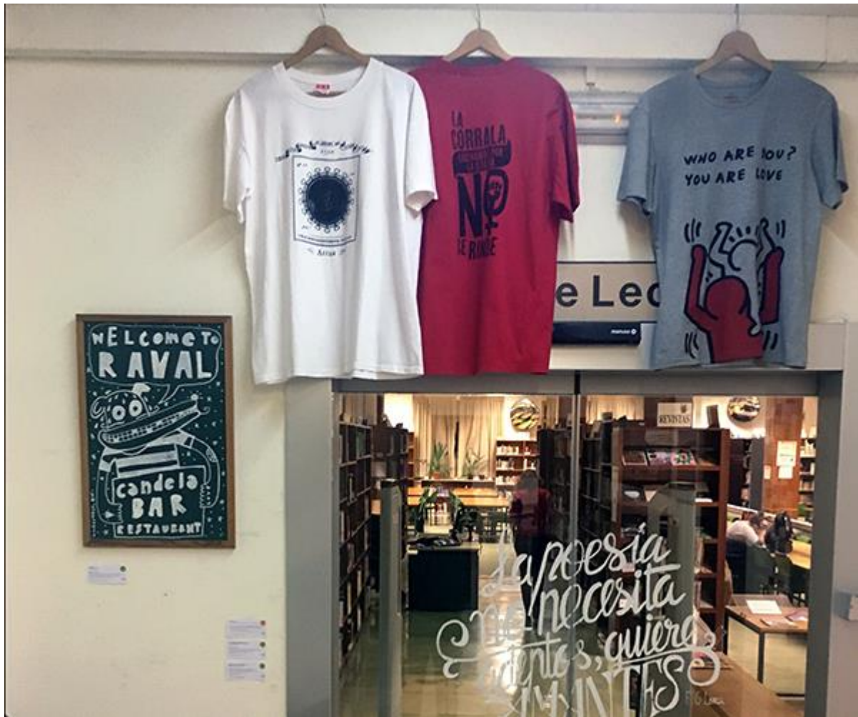
Detalle de las piezas-camisetas "La Corrala Utopía NO se rinde!" de Juan Pro (Madrid), "Sin título" de Guillermo Valverde (Barcelona), "Where are you, you are love" de Ricardo Iglesias y Cartel de "Welcome to Raval" del Restaurante La Candela (Barcelona)