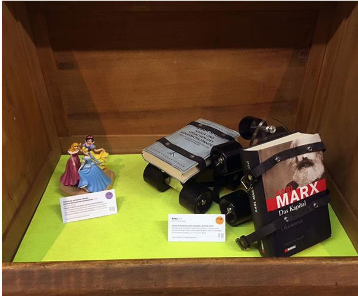
Detalle de las piezas "Cuando las compañías educan, los derechos humanos desaparecen" de Luminita Albisoru (Monterrey) y "Rollers" de Ramón Guimaraes (Barcelona).