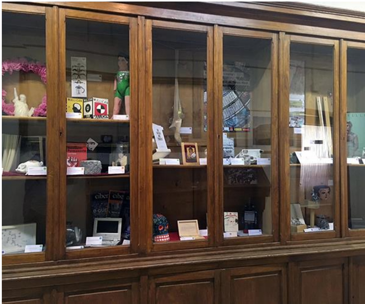
Vista general de la intervención expositiva.