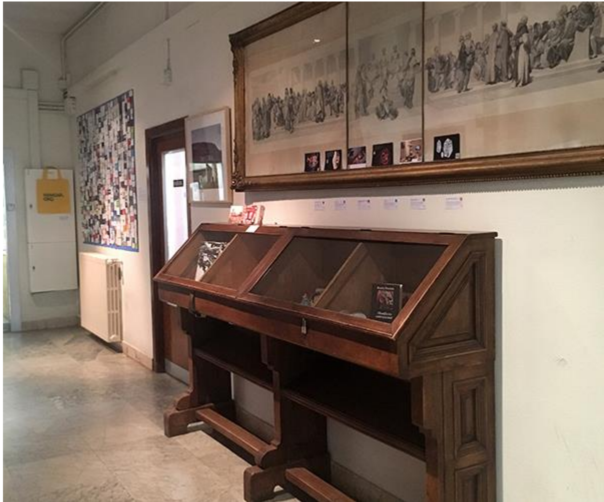
Vista general del quinto expositor y postales de QR.