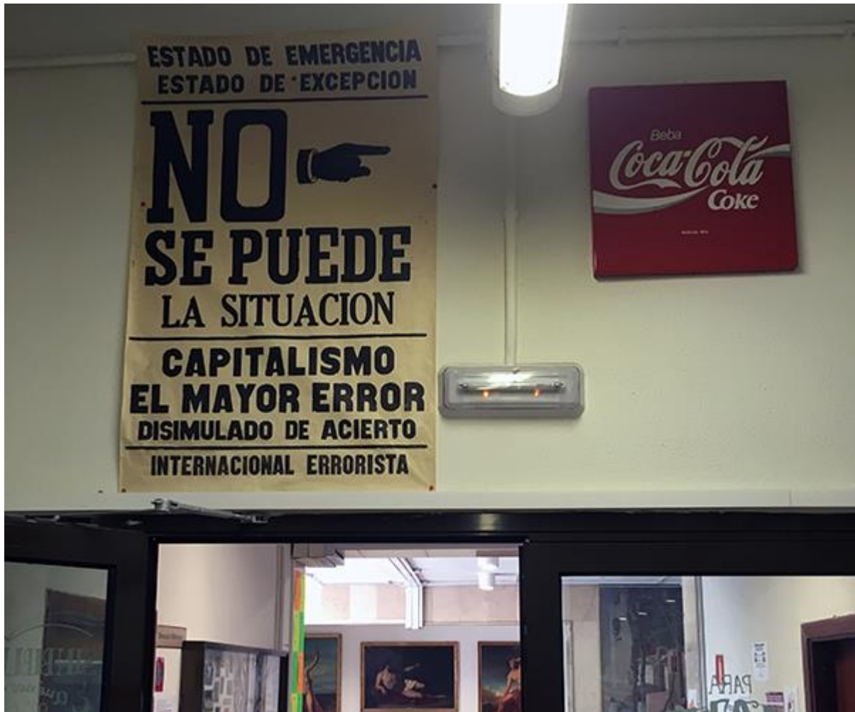
Vista detalle de la salida de la biblioteca con piezas de Javier Pérez Iglesias (Madrid)