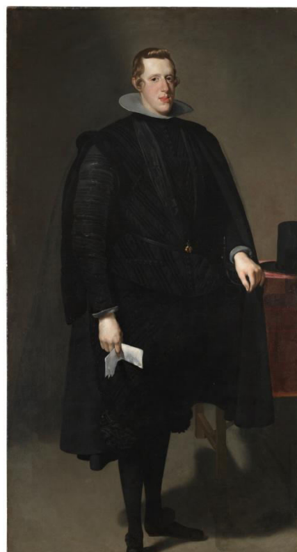
Fig. 4. VELÁZQUEZ, D., Felipe IV . 1623–28. Museo del Prado. Madrid.

Pese a la pragmática de la Junta de Reformación en la mayor parte de las ocasiones en las se describe a Felipe IV en esos años, se llama la atención sobre la riqueza de la vestimenta, y no sobre sus rasgos de austeridad de la misma 37 , pues es lógico pensar que cuando el rey aparece en un evento público mostrará ostentación y lujo pues para algo era el monarca y debía mostrar una apariencia que justificara su persona. Por eso, que este negro filipino pueda pasar a un ámbito más cotidiano, quizá, según qué evento. A poder ser, siempre mostrará una imagen acorde ya que en mascaradas o en juegos de toros y cañas aparecería con otro tipo de vestimenta más colorida. Un ejemplo puede ser la descripción que se tiene del vestido que utilizó para el carnaval de 1623 y que más adelante revelaremos y pondremos en tela de juicio con unos materiales que a día de hoy podríamos considerar demasiado modernos para el siglo XVII y que sorprendentemente en la época ya se vestían.