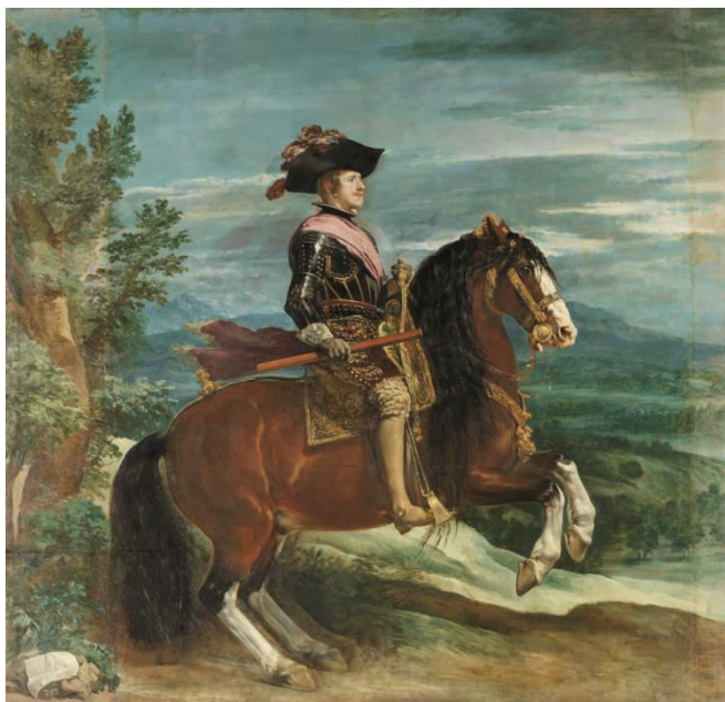
Fig. 6. VELÁZQUEZ, D., Felipe IV, a caballo , 1635, Museo del Prado de Madrid.

El momento en el que las obras son realizadas, vemos que viven su época dorada en la década de 1630 pero es este del rey ecuestre en el Buen Retiro el que mejor expresa la imagen de poder de la majestad habsbúrgica 5 . En todos los retratos aparece con los elementos simbólicos que debe contar un retrato ecuestre, y son el bastón de mando y la banda roja de general de los ejércitos que vemos que ha llegado hasta nuestros días.