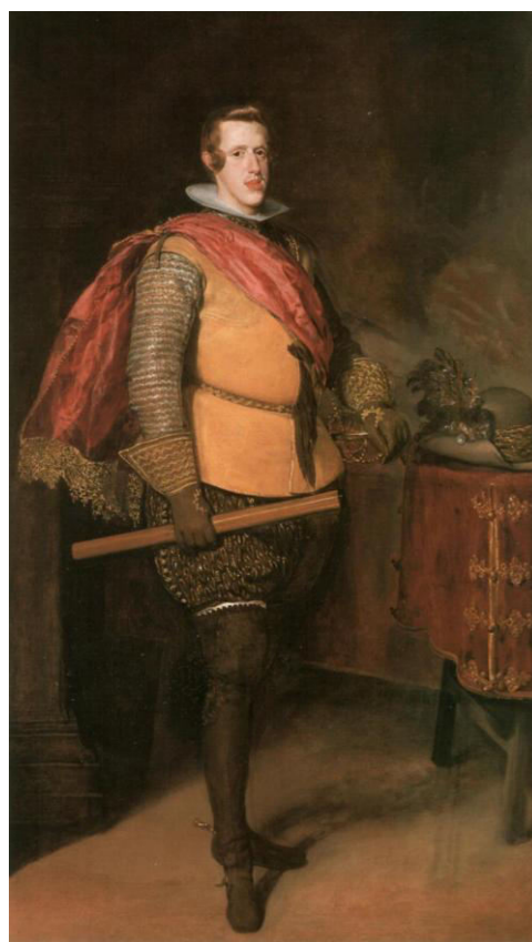
Fig. 7. VELÁZQUEZ, D., Felipe IV con jubón amarillo , 1628, Museo Ringling, Sarasota.

Con Felipe IV con jubón amarillo atendemos a uno de los ya conocidos retratos de aparato en donde el monarca aparece representado de manera canónica con sus regios atributos: su banda carmesí, su bastón de mando, la mano sobre la empuñadura de su espada... y si nos fijamos bien, con la Peregrina en la montera a modo de corona real 25 haciendo una muestra de su poder como militar, preparado para defender el reino en cualquier momento, pues su actitud es la de aquel dispuesto a cabalgar 26 . El colete que muestra rompe con lo que hasta el momento han sido las indumentarias del monarca con un color más cálido y con unas mangas bordadas estofadas bordadas en oro. El propio cuerpo de la prenda podría estar realizado de distintos materiales como piel de búfalo, ante, paño o seda 27 y se adobaba con ámbar 28 . Maribel Bandrés recoge que Quevedo lo bautizó como vientre de oca porque el pecho quedaba abultado y daba mucho empaque a la persona 29 . Las