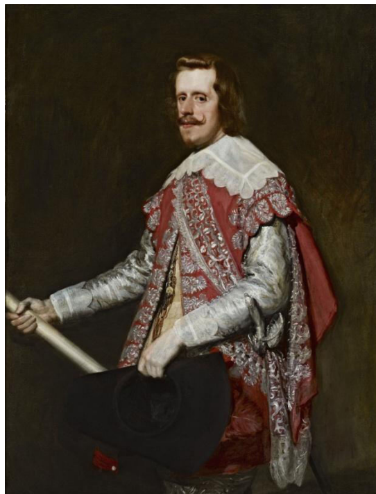
Fig. 8. VELÁZQUEZ, D., Felipe IV en Fraga , 1644, Colección Frick, Nueva York.

como un único conjunto sino como dos prendas distintas que más tarde quedarían unidas, pues se pagan doscientos treinta y ocho reales que se gastaron en Çaragoça para jubón pardo y un vestido a Su Mg. 40 lo que implica una obviedad que viene a ser que no conservemos el nombre de quien hizo ambas prendas ya que no se correspondería a nadie relacionado con el palacio, de quien en ese caso se conservaría el nombre del autor, y que se debió hacer en el Reino de Aragón mientras la estancia del monarca se producía en la región.