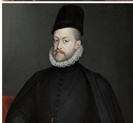
Fig. 3. DEBAJO. ANGUSSOLA, S. Felipe II . 1573. Museo del Prado de Madrid.