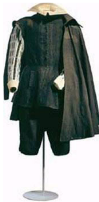
Fig. 5. Traje del conde sueco Nils Nilsson Brahe. 1654.

Si atendemos a los criterios estéticos en relación a la apariencia de Felipe IV en sus retratos, podemos ir indagando por la calidad del retrato el tipo de tejido que porta este. Por las gamas y los brillos de la pintura, se puede observar que la indumentaria real es muy rica y de una confección muy digna de ser portada por su majestad. En el Felipe IV del Meadows Museum vemos la diferencia entre los dos tejidos negros, pues vemos como las telas que cuelgan de su cuello son más brillantes y de una textura totalmente distinta y queda perfectamente reflejado con las pinceladas de Velázquez. Este reflejo, las luces de la tela que muestra el maestro sevillano, nos hace pensar que es una tela más fina, suave y liviana al tacto que la del supuesto jubón que lleva el rey, que se muestra como un tejido algo más trabajado. Atendiendo al cuadro de Velázquez vemos cómo las mangas tienen un tacto totalmente distinto al jubón y es que Bandrés Oto explica que las mangas eran de quita y pon e iban atadas a la sisa con agujetas para poderlas cambiar a menudo 50 . La historiografía no se ha preocupado apenas de explicar qué tipo de tejido lleva el monarca o quién se ha encargado de su realización, pues siempre se ha hecho más hincapié en la moda femenina que en la masculina y es por ello que con nuestro ojo debemos dar un primer juicio sobre el textil para sentar unas bases de estudio.