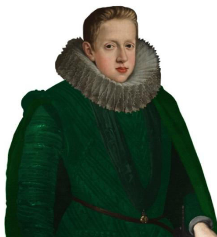
Fig. 10. RECONSTRUCCIÓN. Felipe IV a través de la descripción en la que acude a la representación de La Gloria de Niquea .

Uno de los grandes eventos en 1622, cuando apenas llevaba un año sobre la real silla fue Gloria de Niquea , obra de Juan de Tassis, segundo Conde de Villamediana. Se encarga una composición escénica como en las que en Italia se realizaban 11 Esta obra destila un aroma propagandístico que impregna a los asistentes en donde Felipe IV es asociado al personaje principal: Amadís. Teniendo claro el mensaje a transmitir en esta colosal puesta en escena preparada desde tres meses antes, el nuevo monarca aparece descrito así: Salíò en el carro con tantos atributos de Magestad y belleza, q bien pareciò venir triunfando de los mas celebrados rios [...]