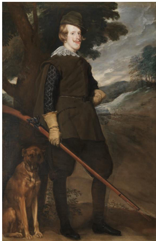
Fig. 9. VELÁZQUEZ, D., Felipe IV, cazador , Museo del Prado.

El traje con el que aparece representado Felipe IV es un traje compuesto por tabardo, jubón y calzas. Sin embargo, la prenda que nos debe llamar la atención aquí es esta primera. El tabardo es una prenda de abrigo con aberturas laterales y sin mangas y cerrada que era empleada para la caza 22 . Sobre este tabardo vestiría el rey una valona de fino cambrai demasiado elegante y poco práctica para moverse entre los árboles y matorrales 23 . Esta prenda verde que le serviría al monarca para camuflarse entre las hierbas debería ser de una hechura tosca y no del delicado trazo con el que puede ser realizado el cuello del rey. El tejido es un paño de textura apretada, aislante de la humedad,