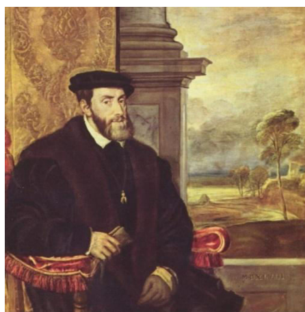
Fig. 2. ARRIBA. TIZIANO. Carlos V . 1548. Alte Pinakothek. Munich.

¿Cuál es la importancia de la indumentaria el monarca? La apariencia ante sus súbditos es algo estrictamente necesario, pues no es lícito que el monarca aparezca ante su pueblo sin un semblante ya que el único contacto que puede haber con el rey es, simplemente, por cómo se muestra en una pintura y debe ser respetado como si del propio monarca en persona se tratara. Quizá para comprender