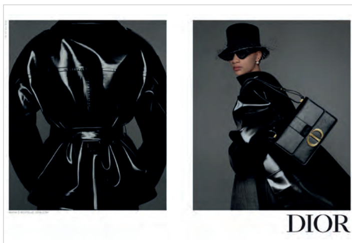
Figura 7. Mujer agresiva.