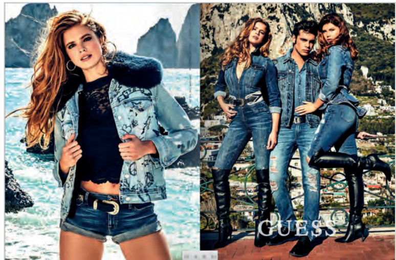
Figura 3. Mujer seductora.

(Martínez-Oña; Muñoz-Muñoz, 2015), para representar a las mujeres que protagonizan los anuncios de sus productos. Mujeres rubias, blancas, delgadas –en algunos casos extremadamente delgadas–, de apariencia juvenil y con un rostro perfecto, desde luego no se corresponden con gran parte de la población femenina española. Si es notable un aumento en la representación de mujeres negras y mujeres de origen asiático, así como la presencia casi igualada de mujeres rubias y morenas, también es cierto que la mayoría de estas figuras femeninas aún obedece a estereotipos de belleza que continúan inamovibles. Pero no solo estos estereotipos han experimentado pocos cambios. Los estereotipos relaciona-