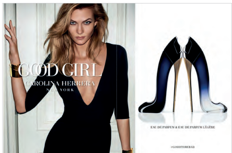
Figura 4. Mujer seductora.