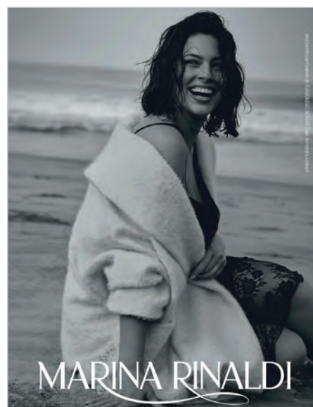
Figura 2. Mujer afectiva.