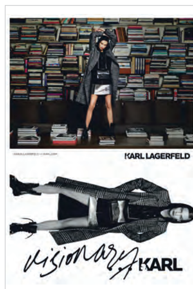
Figura 8. Mujer agresiva.

dos a las actitudes y/o comportamientos han sufrido alguna alteración (ahora son seis en lugar de cuatro); no obstante, en esencia siguen siendo los mismos salvo el nuevo estereotipo mujer agresiva, el que más inquieta.