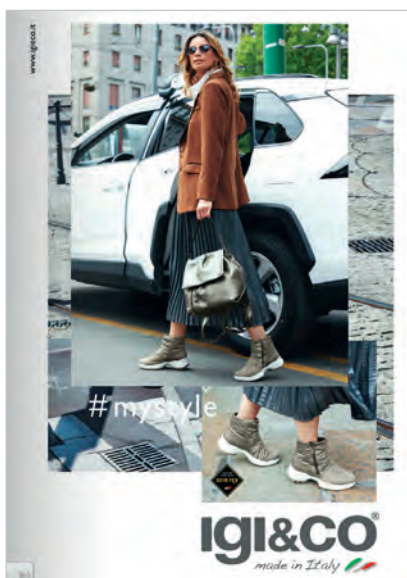
Figura 1. Mujer triunfadora.

La publicidad gráfica que reproduce el estereotipo de mujer afectiva (figura 2) exhibe una mujer cómoda consigo misma ( r = 0,26 , p \leq 0,01 ), expresiva ( r = 0,37 , p \leq 0,001 ) y que disfruta de las actividades de ocio ( r = 0,19 , p \leq 0,05 ). Una actitud pasiva ( r = -0,27 , p \leq 0,001 ), la languidez ( r = -0,18 , p \leq 0,05 ), debilidad ( r = -0,19 , p \leq 0,05 ) y el fracaso ( r = -0,19 , p \leq 0,05 ) tampoco forman parte de la personalidad de esta mujer. A diferencia de la mujer triunfadora, el aspecto físico ideal queda en un segundo plano, ya que la mujer afectiva posee una correlación positiva y muy significativa con una complejión