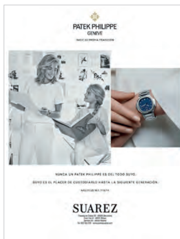
Figura 5. Mujer familiar.