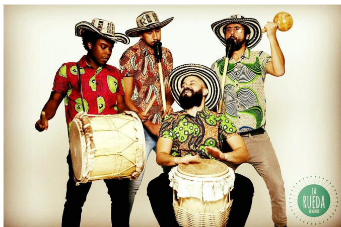
Imagen 1. Grupo de gaita La Rueda de Madrid.

En Colombia el término gaita designa a una flauta indígena con cabeza de cera usada, sola o en parejas, así como al conjunto conformado por estas flautas y tres tambores, y a la música que interpreta dicho conjunto.