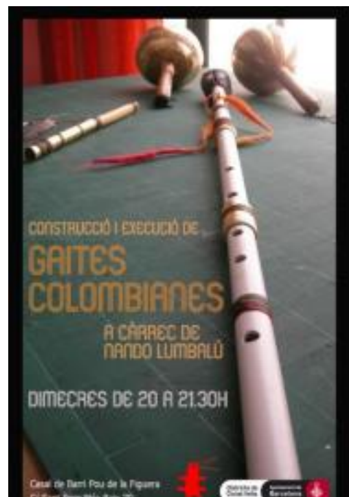
Imagen 6. Clases de gaita en Barcelona impartidas por Hernando Muñoz.