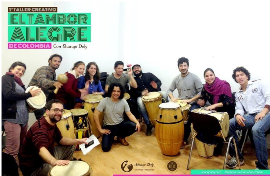
Imagen 7. Shango Deli, taller en Madrid organizado por La Rueda de Madrid. Enero de 2016.