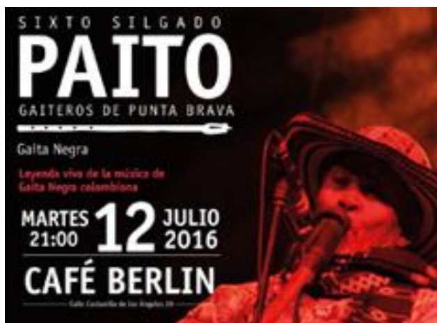
Imagen 5. Concierto de Paíto en Madrid 2016.