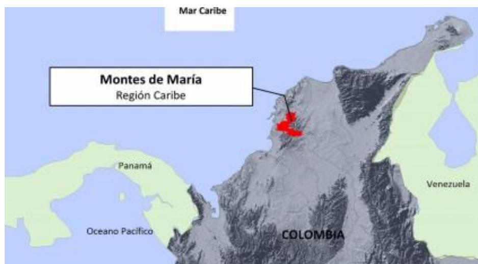
Imagen 2. Ubicación de la región Montes de María en Colombia.

La variante de la gaita que nos interesa tiene como epicentro la zona de los Montes de María, subregión geográfica y cultural de 2.677 km 2 conformada por quince municipios de los departamentos del norte de Colombia (Bolívar y Sucre, con 596.914 habitantes). Dentro de esta subregión encontramos municipios con mayor relevancia en el mundo gaitero por poseer festivales o escuelas de gaita.