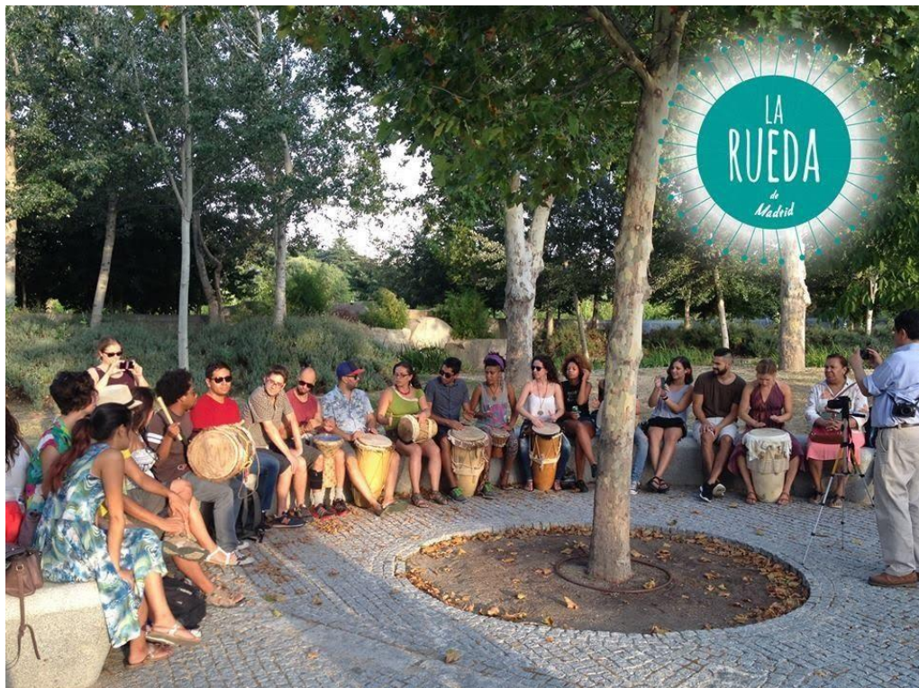
Imagen 8. Rueda de tambores organizada por La rueda de Madrid. Madrid agosto de 2015.